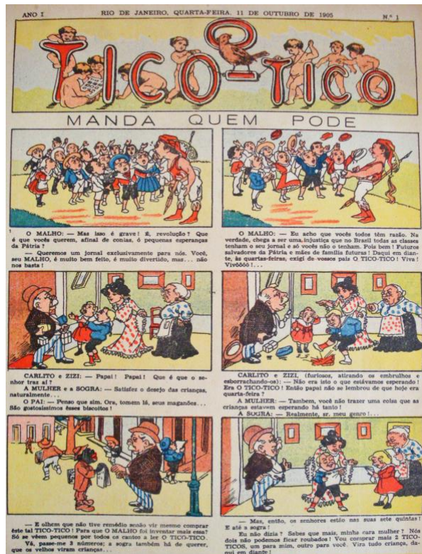
Artista desconhecido (1905). Capa do 1º número O Tico-Tico . Edição fac-símile. Ano I, 11/10/1905, N.º 1.

em quadrinho quanto como sujeitos que pressionam adultos a atenderem seus gostos e preferências. Inclusive o título da história – Manda quem pode – sugere o protagonismo das crianças no espaço da rua e na família.