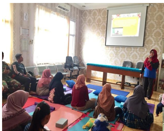
Gambar 2: Penyampaian Materi