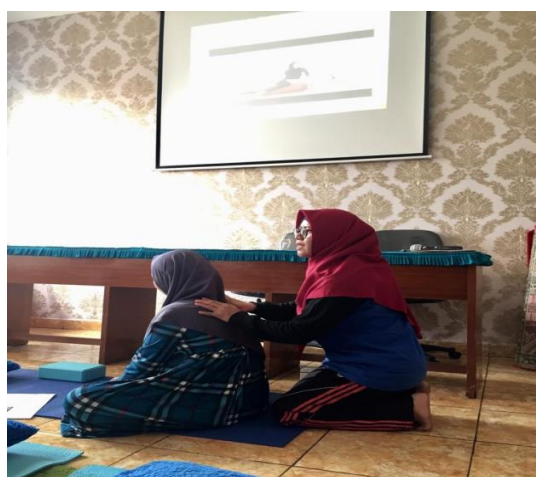
Gambar 3: Peragaan Endorphin Massage