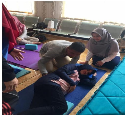
Gambar 4: Peragaan oleh peserta

Pelaksanaan pelatihan endorphin massage ini dilaksanakan secara partisipatif. Ibu-ibu hamil diposisikan tidak hanya sebagai penerima materi namun sebagai warga belajar. Dalam praktiknya setelah menyampaikan materi, narasumber mendemonstrasikan prosedur endorphin massage yaitu dengan instruksi sebagai berikut: pertama Anda dapat melakukan endorphin massage ini dengan duduk ataupun berbaring. Usahakan suami Anda berada di samping Anda. Lakukan terapi ini dengan duduk ataupun berbaring dengan nyaman. Tarik nafas secara perlahan kemudian keluarkan dengan sangat lembut sambil pejamkan mata Anda. Mintalah pada suami Anda untuk mengelus permukaan kulit pada lengan Anda dengan lembut menggunakan jari tangan suami Anda. Mulailah pada lengan atas kemudian turun hingga pada lengan bawah Anda. Lakukan hal ini dengan perlahan serta lembut, dan ganti pada tangan lainnya setelah beberapa menit. Anda dapat melakukan hal ini pada bagian tubuh yang lainnya seperti: bahu, punggung, leher, dan juga paha.