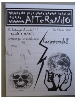
Foto 2. Fanzine Alter Ando

En el marco de la jornada Antiimperialista, la Coordinadora de Medios realizó el lanzamiento público de su primer medio de difusión denominado Alter_Ando 14 . Este formato comunicativo reunía reflexiones de los diferentes colectivos en torno a las temáticas de la jornada. Luego, en abril de 2007 la Coordinadora publicó su segunda edición de Alter_Ando; en ésta abordó la dimensión ambiental desde una reflexión crítica frente a los problemas y conflictos ambientales presentes en la región, en