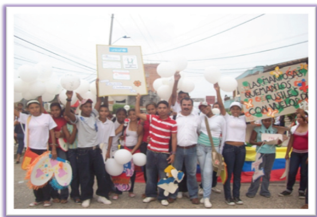
Foto 2. Participando en la construcción de un mundo mejor

En términos de la experiencia particular del proyecto “Niños, Niñas y Jóvenes Constructores y Constructoras de Paz”, el principal factor de ruptura con los ordenes establecidos históricamente en las diferentes comunidades es el mismo ingreso de los jóvenes y las jóvenes al proyecto, ya que este da paso a una sucesión de acciones que buscan el cambio de las condiciones vitales instauradas, pues ha sido a partir de la formación y de la potenciación de los sujetos en sus capacidades críticas, creadoras, comunicativas y políticas, que ellos-as han identificado las posibilidades y características que viabilizan o entorpecen sus desarrollos en pleno ejercicio de sus derechos y de las posibilidades de mundo que se abanicen frente a sus ojos, permitiéndoles desnaturalizar muchas de las prácticas culturales que se encargan de cortar sus sueños de superación del mundo que les contiene.