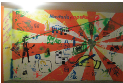
Foto 3. Casa de la Cultura del barrio Villahermosa

La Propuesta Libertaria Popular se desarrolló alrededor de las siguientes áreas de acción: