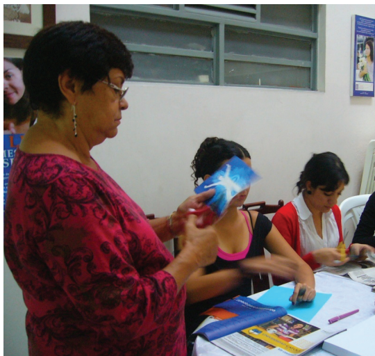
Foto 2: Construyendo el presente. Casa de la Mujer de Pereira, 2010

Joven, juventud y relaciones inter-generacionales son categorías que en el presente texto se asumen trascendiendo un sentido cronológico en