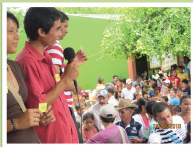
Foto 3. Construyendo ciudadanía

Una de las premisas del proyecto es la vitalidad y el fuerte poder de hacer desde lo pequeño y cotidiano; entendiendo que las pequeñas acciones, los pequeños cambios en las dinámicas de relación diarias son las que modifican las realidades vitales, las que construyen el mundo que habitamos.