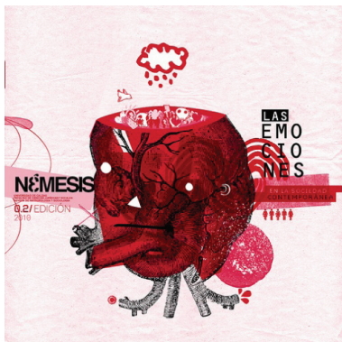
Foto 7. Colectivo Némesis