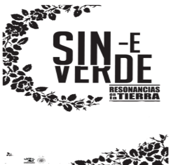
Foto 4. Colectivo Sin-e-verde