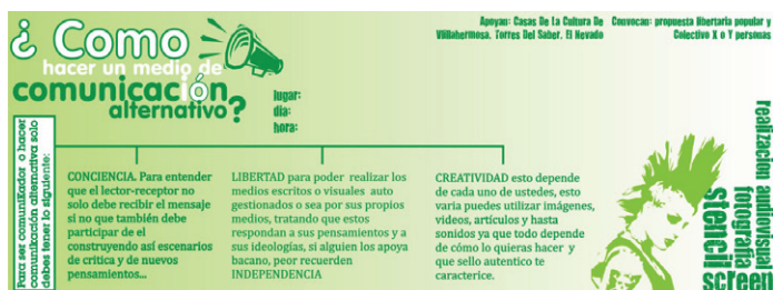
Foto 10. Propuesta Libertaria Popular & Colectivo X ó Y Personas, 2088. Flyer de convocatoria a talleres de comunicación alternativa.

Como ya lo enunciamos anteriormente, la Red gestó junto a algunas Casas de la Cultura de la ciudad de Manizales La Propuesta Libertaria Popular, una iniciativa orientada a generar procesos de formación en comunicación, reflexión crítica y toma del espacio público. Esta apuesta de educación popular fue dirigida especialmente a jóvenes habitantes de barrios, y su quehacer se concentró en la creación-producción de medios alternativos.