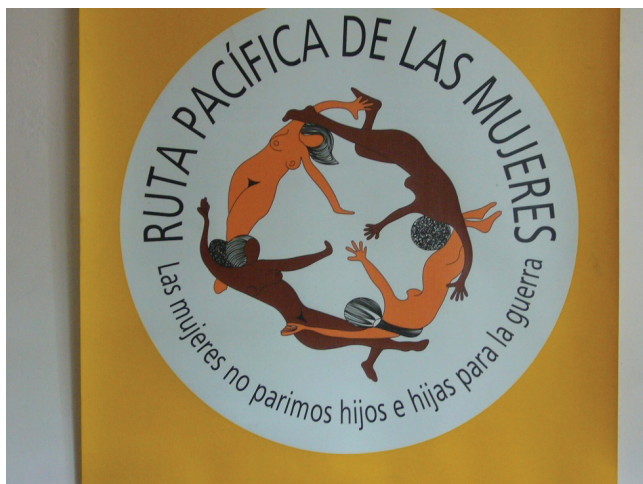
Foto 3: Afiche con consigna significativa de la Ruta Pacífica de las Mujeres