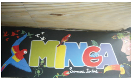
Foto 8. Colectivo Minga Social y Comunitaria.

Confluencia de diversas organizaciones sociales, culturales y políticas que se identifican con el proceso de la minga. Se plantean 7 puntos básicos que permiten la integración: tierra, territorio y soberanía; economía para la vida y legislación del despojo; construyendo poder para el buen vivir; cultura,