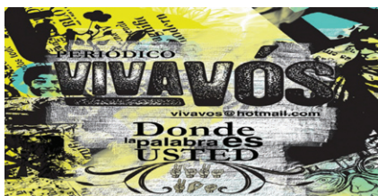
Foto 5. Colectivo Viva Vós

Surgimos con el propósito de rastrear y encontrar la voz viva de esta ciudad entre montañas. Tener la posibilidad de expresar las necesidades del barrio y la comuna, de denunciar, debatir, presentar propuestas para la solución de problemas y brindarle a la gente la posibilidad de