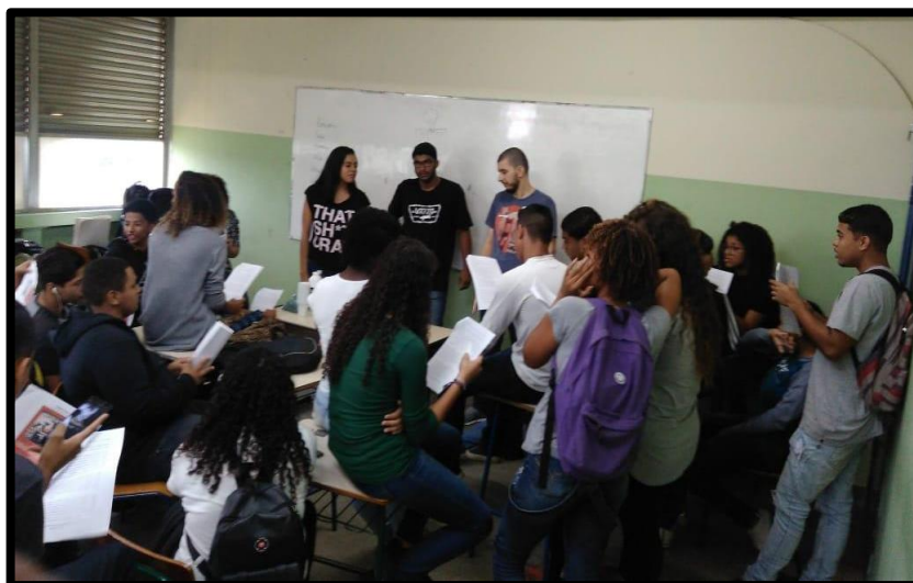
Figura 2 – Apresentação do resumo de Vidas Secas de Graciliano Ramos e leitura de alguns trechos.

[...] Fabiano meteu-se na vereda que ia desembocar na lagoa seca, torrada, coberta de catingueiras e capões de mato (p. 33) (RAMOS, 2003).