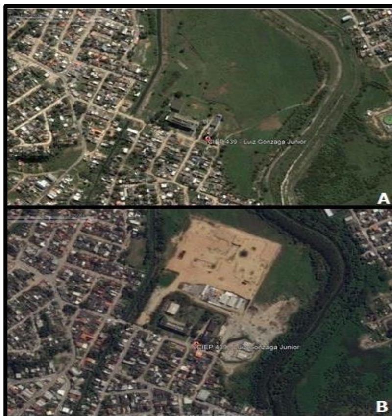
Figura 1 – Imagem de satélite do entorno do CIEP 439 – Luiz Gonzaga Júnior (A) em 2003 e (B) 2019.

Durante o desenvolvimento da atividade, a observação dos alunos pela janela sobre a paisagem ao redor da escola fez com que constatassem expressivas transformações, devido à presença de materiais e máquinas utilizadas em obras promovidas pelo governo do Estado do Rio de Janeiro na construção de uma Estação de Tratamento de Esgoto (ETE) que visa diminuir o despejo de esgoto in natura na Baía de Guanabara (Jornal Extra, 2014). Após a observação da paisagem foram apresentadas imagens locais registradas antes e após o início das obras (Figura 1).