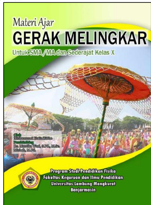
Gambar 2. Cover bahan ajar gerak melingkar berbasis authentic learning

Berikut cover bahan ajar gerak melingkar berbasis authentic learning dapat dilihat pada Gambar 2 berikut.