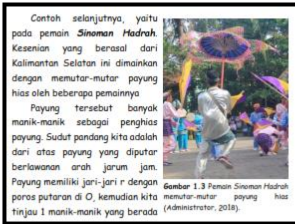
Gambar 1.3 Pemain Sinoman Hadrah memutar-mutar payung hias (Administrator, 2018).

Setiap awal pertemuan disajikan gambar authentic dan pertanyaan authentic yang memotivasi peserta didik agar terlibat aktif dalam pembelajaran. Indikator pembelajaran juga disediakan agar peserta didik mengetahui batasan materi dan lebih terarah dalam proses pembelajaran. Setelah menyajikan indikator pembelajaran, materi ajar yang dikembangkan memuat uraian materi yang berisi berbagai macam informasi authentic tentang gerak melingkar, ditinjau dari contoh fenomena dan gambar yang berhubungan dengan lingkungan daerah peserta didik yaitu Kalimantan Selatan. Salah satu contoh authentic learning ialah Sinoman Hadrah . Berikut tampilan salah satu contoh authentic learning yang digunakan dapat dilihat pada Gambar 3.