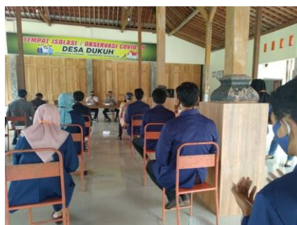
Gambar 3. Kegiatan pembukaan pengabdian masyarakat di desa dukuh