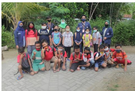
Gambar 2.kegiatan pembelajaran luring didesa dukuh

Pada kegiatan minggu pertama dilakukan observasi ke desa Dukuh kecamatan Gondang serta melaksanakan kegiatan pembukaan KKN dan pengabdian di desa Dukuh .diteruskan dengan penyusunan program kerja yang akan dilaksanakan mulai tanggal 1 oktober 2020 sampai tanggal 30 oktober 2020, program kerja yaitu persiapan pelaksanaan kegiatan pembelajaran luring serta memperkenalkan pembelajaran daring ,membantu dalam pemasangan internet murah yang ditempatkan di balai desa Dukuh Kecamatan Gondang.Kegiatan minggu ke dua yaitu pelaksanaan program kerja yang telah disusun di minggu pertama diantaranya adalah pelaksanaan pembelajaran luring dan memperkenalkan pembelajaran daring untuk siswa maupun guru di desa Dukuh serta pembuatan video kegiatan KKN dan Pengabdian masyarakat. Kegiatan pada minggu ke tiga masih sama dengan minggu ke 2 yang membedakan adalah kegiatan penyusunan laporan akhir. Kegiatan pada minggu ke empat fokus pada finishing pembuatan video profil desa dan kegiatan video KKN serta finishing laporan akhir juga acara penutupan KKN dan Pengabdian masyarakat di desa Dukuh.