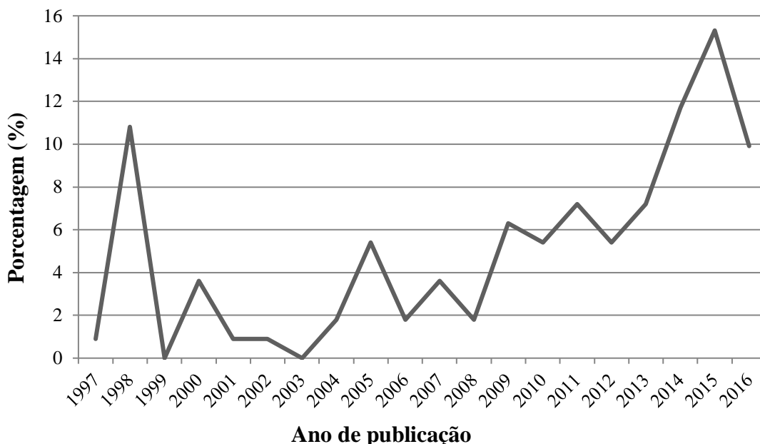
Figura 2. Porcentagem de artigos científicos publicados, sobre gerontecnologia, entre os anos de 1997 e 2016.

entre os anos de 1997 a 2016, evidenciando que a primeira publicação sobre o tema gerontologia datou de 1997 e, houve um aumento brusco em 1998, um declínio a zero em 1999, e nos anos seguintes, as publicações apresentam uma tendência a comportamento crescente constante (Figura 2).