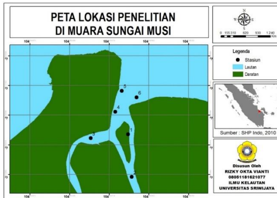
Gambar 1. Peta lokasi penelitian

2°19'22,5" S) dan Stasiun 6 (104°56'2,1" E - 2°19'47,4" S). Penanganan dan analisis sampel dilakukan di Laboratorium Mikrobiologi, Balai Besar Laboratorium Kesehatan (BBLK) Palembang.