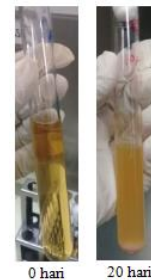
Gambar 3. Hasil uji degradasi setelah 20 hari

Selama masa inkubasi potongan fiber yang berukuran 2x2 cm terurai menjadi pecahan-pecahan sederhana yang sangat kompleks, hal ini dapat dilihat pada Gambar 3 dengan perubahan warna media dan volume media yang berbeda-beda sesuai dengan kemampuan isolat dalam mendegradasi potongan plastik tersebut. Menurut Charkoudian et al. (2010) perubahan warna media disebabkan oleh pigmen yang dikeluarkan oleh bakteri dan bereaksi dengan media sehingga membentuk gugus kromofor (pigmen yang sensitif terhadap rangsangan cahaya) yang mampu merubah warna media. Warna media yang awalnya kuning transparan berubah warna menjadi kuning keruh.