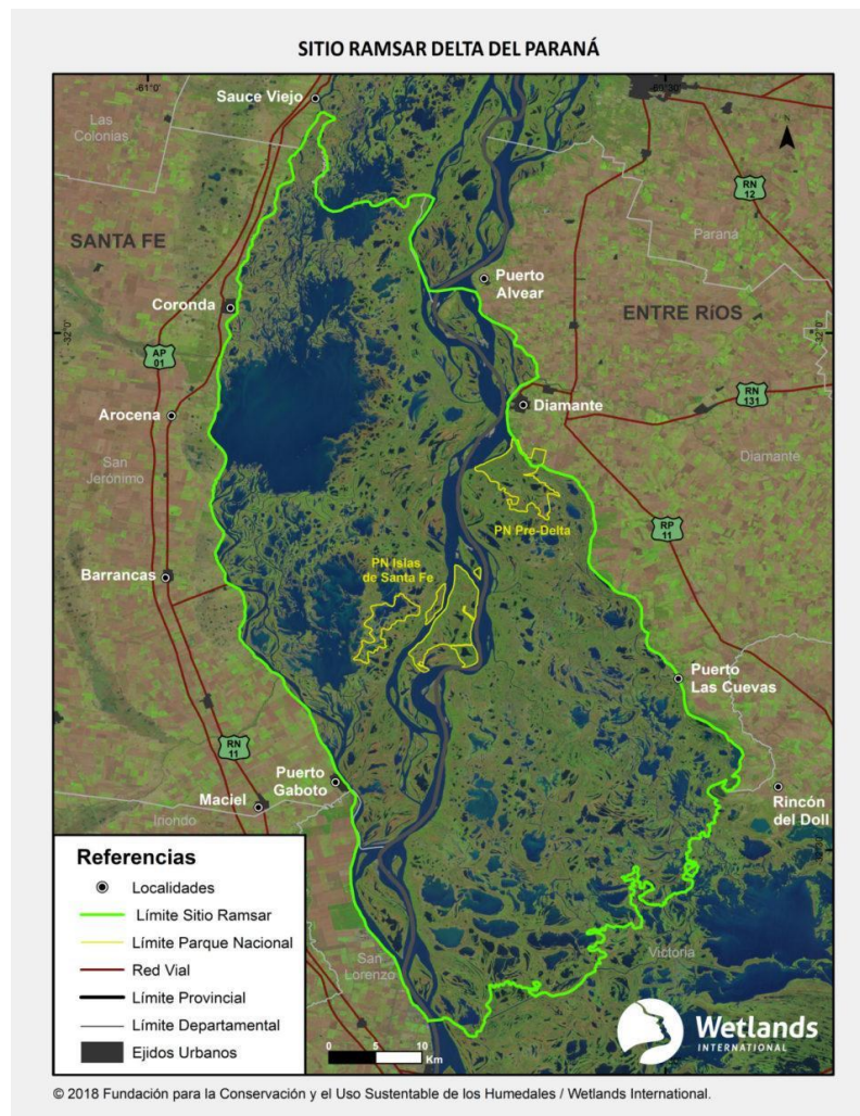
Mapa 1: Delimitación del Sitio RAMSAR Delta del Paraná