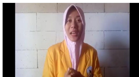
Gambar 1. Video Pertama Materi Ide Pokok Paragraf

Adapun dalam ketiga video yang dibuat membahas mengenai cara menentukan ide pokok serta contoh menentukan ide pokok.