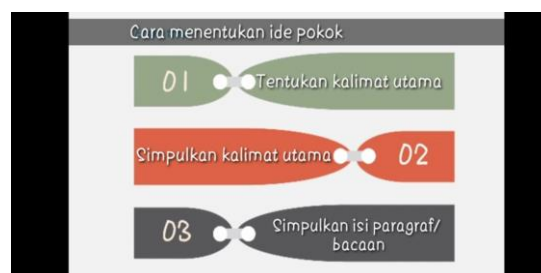
Gambar 2. Video Bagian 2 Materi Ide Pokok Paragraf

Penjelasan langsung ini diberi tambahan teks agar siswa lebih mudah memahami. Hal ini menjadikan siswa tidak hanya mendengarkan, akan tetapi juga melihat. Selain itu, pertanyaan-pertanyaan juga diberikan pada siswa selama pengambilan video.