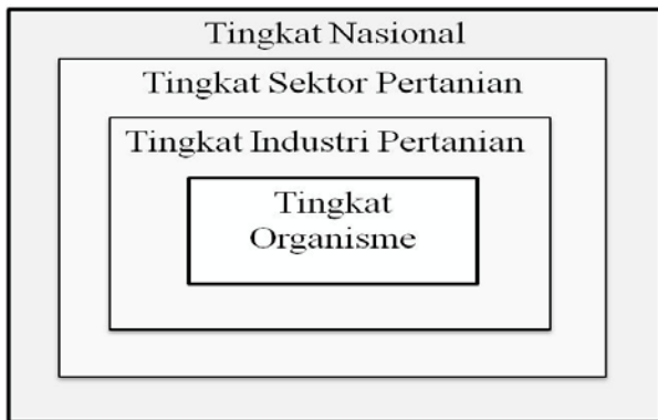
Gambar 1. Empat tingkat domain untuk menghadapi agroterorisme (ubah sesuai dari Konten 2000).