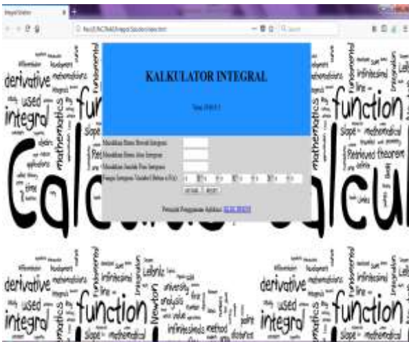
Gambar 2. Tampilan Awal Sistem

dapat menghasilkan nilai dari suatu perhitungan. Kalkulator integral yang peneliti buat ini versi 2018.9.1.