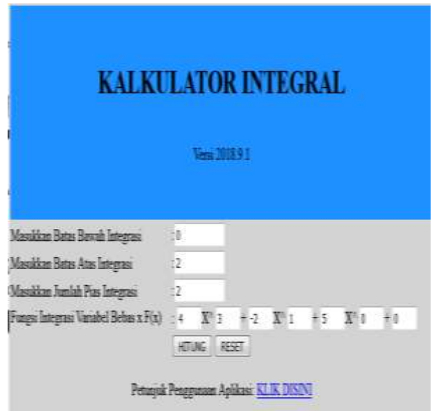
Gambar 4. Tampilan Pengisian Kalkulator

Setelah memahami petunjuk penggunaan aplikasi kalkulator integral, kita dapat memasukkan perintah soal pada kolom yang tersedia sesuai petunjuk. Diketahui suatu mobil bergerak dengan persamaan kecepatan v = 4X^3 - 2X + 5 , dengan v dalam satuan meter per sekon dan t dalam satuan sekon. Tentukan perpindahan mobil setelah menempuh waktu t=2 sekon. Pertama kita memasukkan nilai batas bawah integrasi yaitu 0, kemudian masukkan batas atas integrasi yaitu 2, memasukkan jumlah pias integrasi yaitu 2, pada batas pias kita dapat isikan berapapun sesuai dengan keinginan atau perintah soal. Terakhir memasukkan