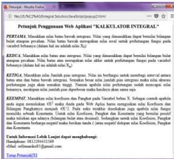
Gambar 3. Tampilan Petunjuk Penggunaan

Gambar 2. merupakan tampilan dari sistem saat pertama kali dibuka. Terdapat beberapa kolom yang merupakan perintah input dari suatu persoalan integral. Kalkulator integral ini akan menghitung persamaan integral dengan kita memasukkan persamaan pada kolom yang tersedia dilayar. Pada tampilan awal terdapat perintah memasukkan batas atas, batas bawah, batas integrasi dan memasukkan persamaan integral. Pada layar terdapat ikon KLIK DISINI, ini merupakan perintah untuk menampilkan petunjuk penggunaan kalkulator integral.