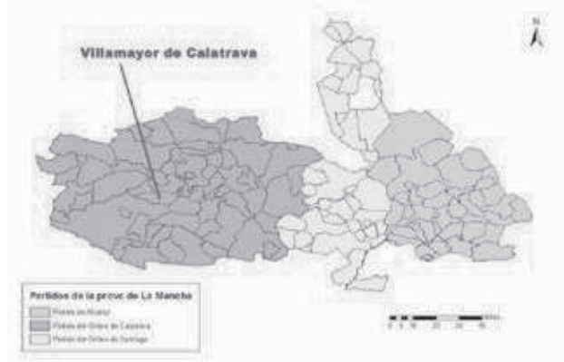
Figura 1. La Intendencia o provincia de La Mancha y sus Partidos en 1749.