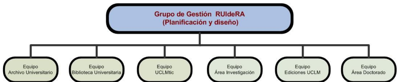
Figura 2. Grupo de Gestión RUIdeRA. Estructura.

Como proyecto transversal de varias áreas, para el diseño y la gestión del repositorio, se creó un grupo de trabajo en el que participan las direcciones de cada una de ellas, así como los técnicos responsables. Después, cada equipo, a su vez, es el responsable de organizar su propio grupo, con las asignaciones y tareas correspondientes.