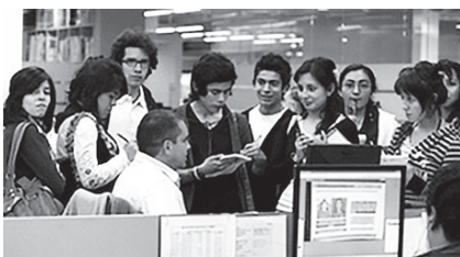
Figura 2.2. Jóvenes del proyecto en la Redacción del periódico

En la Sala de Redacción de El Tiempo , los jóvenes del proyecto lograron expresar sus ideas de forma autónoma y con la libertad que les otorga el marco constitucional colombiano.