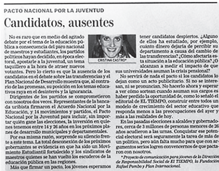
Figura 2.7. Jóvenes columnistas

nado tema. Código de Acceso agendó temas, despertó interés y, sobre todo, puso el dedo en la llaga en asuntos políticos, juveniles y sociales del país. Ejemplo de este género fueron las columnas de opinión de Cristina Castro, integrante del proyecto.