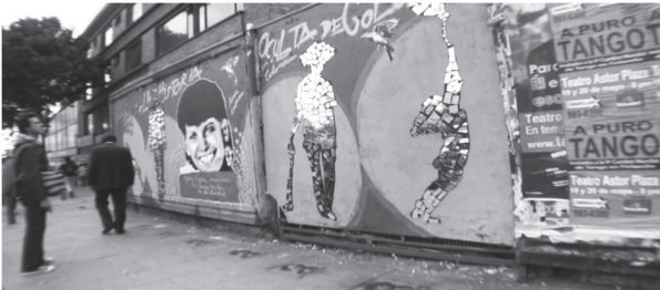
Figura 3.3. Si estoy en tu memoria hago parte de la historia