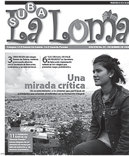
Figura 2.4. Periódico escolar

Portada del periódico escolar La Loma , del I.E.D. Ramón de Zubiría y Gerardo Paredes, producto de la multiplicación.