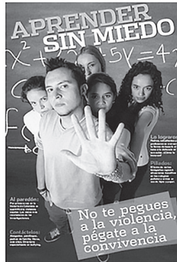
Figura 2.6. Portada de la separata "Aprender sin miedo"

periodismo como: ¿qué?, ¿cómo?, ¿cuándo?, ¿dónde?, ¿por qué? y ¿para qué? Su redacción se apartó del estilo noticioso propiamente dicho. En lugar de valerse de la pirámide invertida, se alternaron distintos estilos narrativos, los cuales despertaron el interés de los lectores.