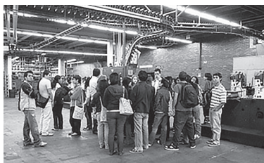
Figura 2.3. Jóvenes del proyecto en la rotativa del periódico El Tiempo

Los jóvenes del proyecto conocieron la rotativa e interactuaron con la parte administrativa para conocer su funcionamiento.