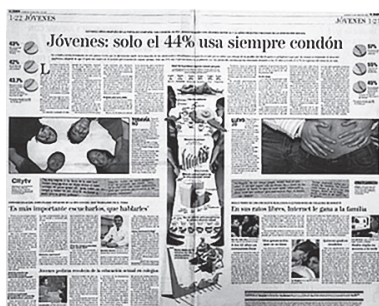
Figura 2.5. Distribución noticiosa en la publicación de los jóvenes