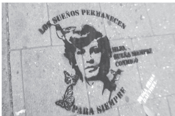
Figura 3.1. Homenaje a las víctimas de la violencia política en Colombia. Avenida Chile, Bogotá