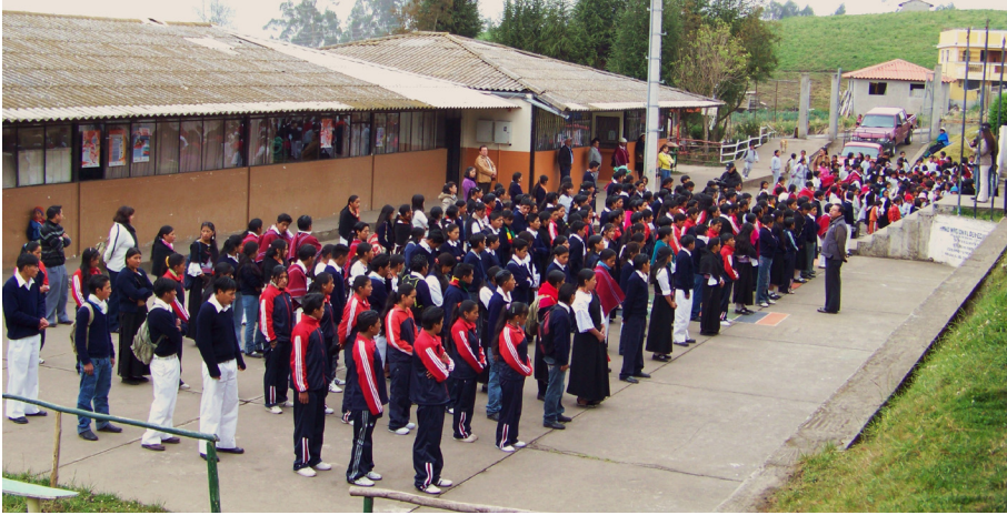
Foto 2. Centro Educativo Comunitario Intercultural en Tungurahua, 2010.

cesos diferenciales individuales del aprendizaje. Por el contrario, “los niveles educativos” están concebidos en atención al desarrollo y a las necesidades de los estudiantes. Por lo que la DINEIB propone unidades, módulos y áreas de conocimiento para el aprendizaje, sin necesidad de que existan para ellos medidores de tiempo inflexibles. “La práctica educativa estará destinada a cumplir con los requisitos de desarrollo humano, aprendizaje y adquisición de conocimientos, independientemente del número de años de estudio que para cada nivel establezca el sistema nacional” (DINEIB, 1993: 25). De tal manera que un niño o joven puede superar varios niveles en un año lectivo, o al revés, demorarse más tiempo en cada nivel de acuerdo a su aprendizaje.