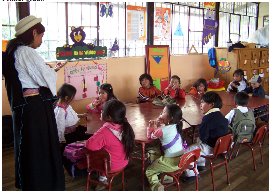
Foto 3. Escuela Intercultural en Tungurahua, 2010.

poco inglés, ese sí, de inglés aprendemos canciones, el vocabulario, verbos” (Niño Chibuleo, 2009).