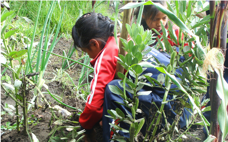
Foto 1. Escuela de Tunsalao, Chimbozaro. 2010.

A pesar de la acomodación de la escuela, para favorecerse de los modos organizativos de las comunidades, es interesante ver cómo las formas organizativas indígenas contribuyen al mejoramiento de situaciones concretas, en la escuela y en las comunidades. De tal manera que no podemos afirmar que la escuela queda intacta al acomodarse, porque de alguna forma se ve alterada en varios de sus componentes secundarios, es decir, en aquellos que no afectan la estructura educativa principal, sino que son complementarios, como las relaciones sociales, los proyectos de aula y los intereses de los estudiantes.