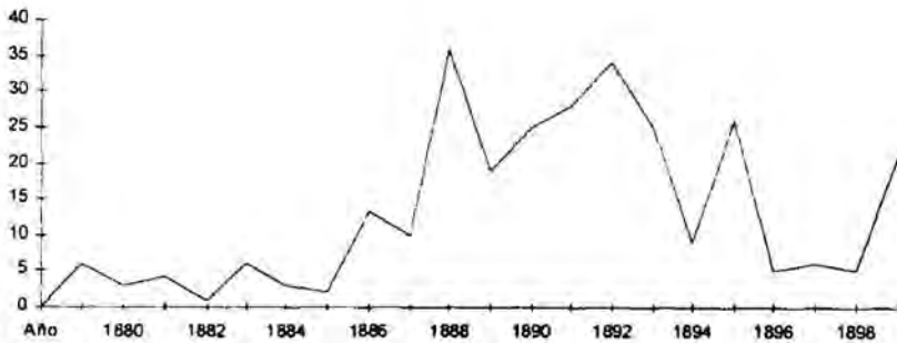
Sociedades inscritas en La Habana. 1880-1899

Fuente: Archivo Nacional de Cuba. Fondo Registro de Asociaciones, 1878-1899.