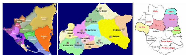
Figura 1. Área de estudio.

fecha en estudio y 2º haber participado en acciones definidas en los planes anuales del componente productivo. La muestra realizada corresponde al 15.8% de la población total (550 beneficiarios del proyecto con el componente productivo). La cual corresponde a 87 productores. También se entrevistaron: un técnico agrónomo y 4 representantes de organizaciones. Para un total de 92 entrevistados. Se analizaron las siguientes variables de estudios; Capacitación y Asistencia técnica, Ingresos productivos, uso y manejo de los desechos orgánicos, y lecciones aprendidas. En el análisis de información en los cuadros de salida y en los cuadros consolidados, se empleó datos de frecuencia y porcentajes por cada variable y por cada actor social.