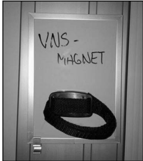
Figur 2 Magnet-tavle med VNS-magnet.