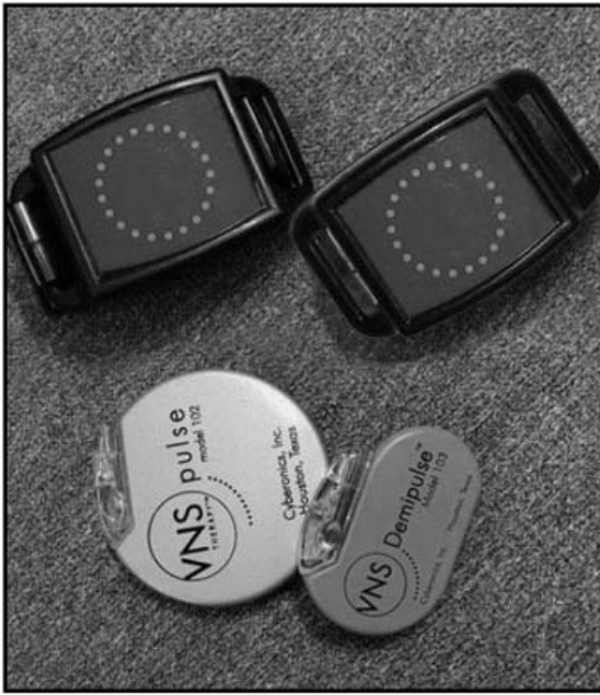
Figur 1 VNS-magneter øverst, og VNS-pulsgeneratorer under.