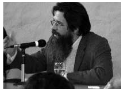
I Jornadas Nacionales "Compromiso Social Universitario y Políticas Públicas. Debates y Propuestas". Mar del Plata, 25 y 26 de agosto de 2011