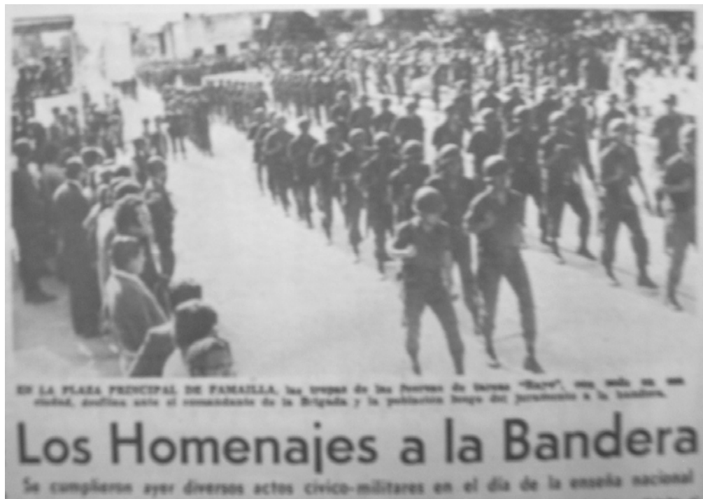
Desfile militar en el día de la bandera. Plaza principal de Famajila. 21-06-75.