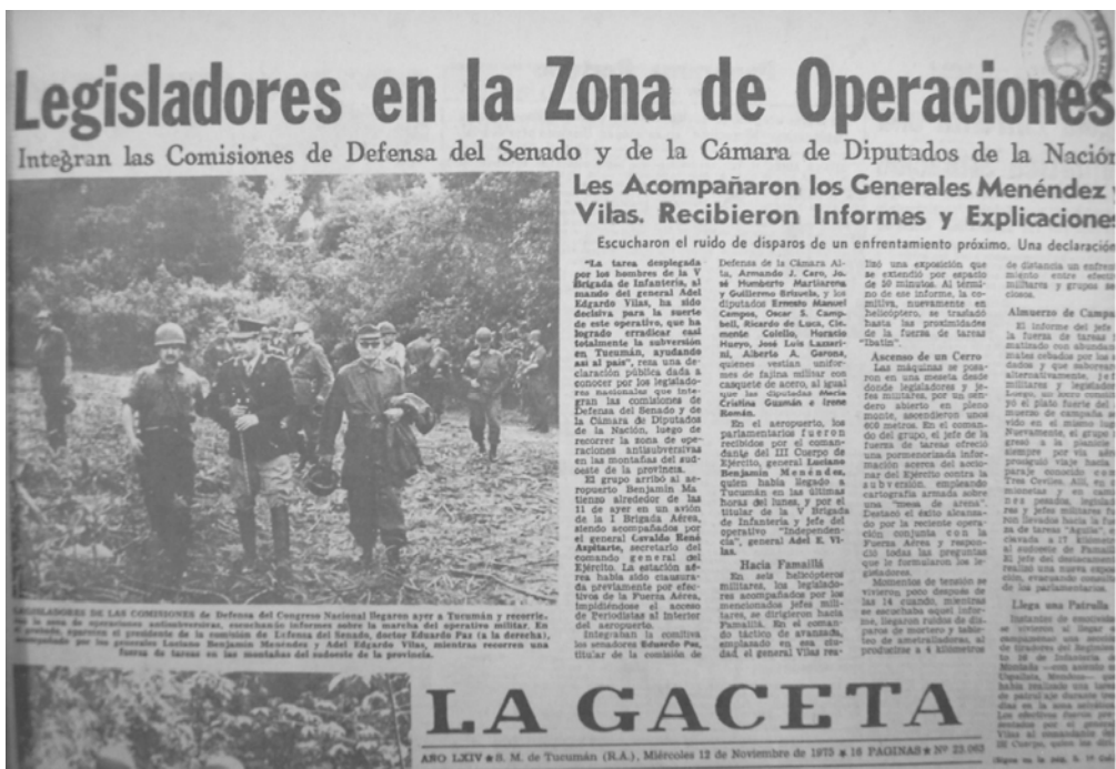
Legisladores integrantes de la Comisión de defensa recorriendo la zona de operaciones antisubversivas. 12-11-75.

Unos días antes, decenas de periodistas de todo el país recorrieron la zona donde el ejército estaba emplazado. El diario La Gaceta extractó las crónicas sobre dicha visita, que aparecieron en los principales diarios nacionales. El diario La Nación sostuvo que "en Tucumán no hay guerra. Es una lucha frontal contra la delincuencia subversiva. ¿Unos días más? ¿Unas semanas más? ¿Unos meses más? Es la batalla de la libertad en la que estamos todos. El terreno lo eligió la guerrilla, el momento también. La V Brigada de Infantería fue imponiendo cuotas de confianza. La bandera o las banderas de o los grupos subversivos -los mismos colores que desfilaron por las calles de Bs. As. cuando el Dr. Cámpora asumió la presidencia de la República- fue prontamente reemplazada en el mástil de la placita del pueblo por la única nacional conocida, respetada y honrada. Hasta que la seguridad no haya alejado definitivamente el temor, el ejército permanecerá en Tucumán en Operaciones. Operaciones que se ejecutan por orden del Poder político e institucional" (02/11/1975).