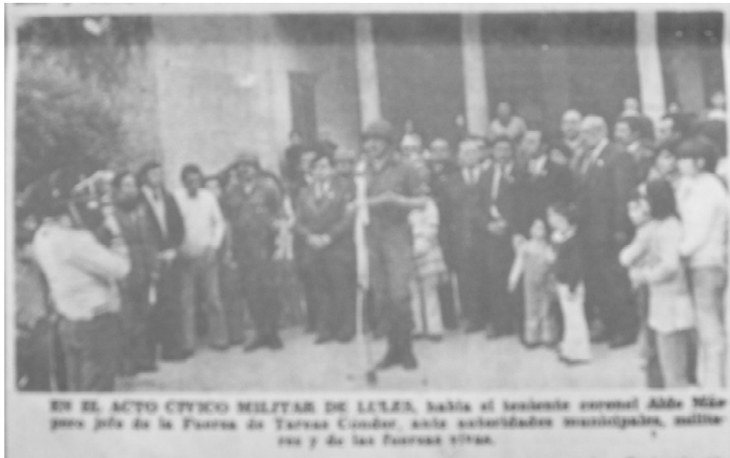
Acto cívico-militar en Lules. 26-05-75 © Diario La Gaceta.