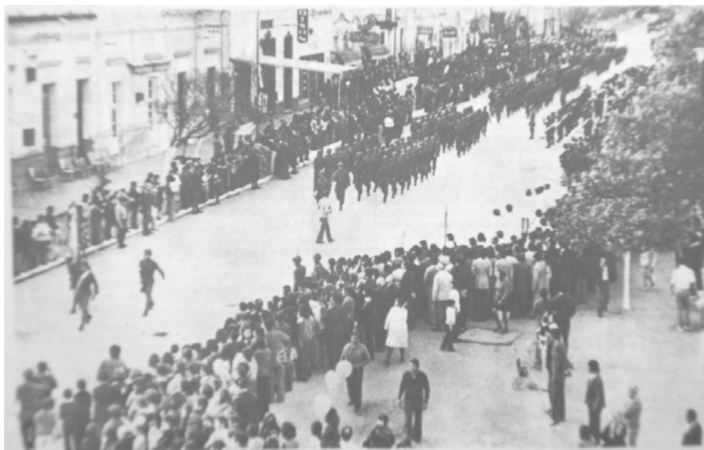
Desfile militar en conmemoración del día de la Independencia, Famallá. 10-07-75.

Estas caracterizaciones negativas dirigidas a la militancia social y política (armada o no), son realizadas en un 91% a través de entrevistas, reportajes y diversos enunciados públicos, mientras que el resto se realizaron en actos militares o religiosos. La figura del "enemigo subversivo" se construía por medio del lenguaje oral y escrito en los lugares ceremoniales (actos, misas, etc.) y con la difusión masiva del diario provincial de mayor influencia en todo el Noroeste del país. Teniendo en cuenta esta tendencia, nos interesa mostrar los ámbitos donde fueron realizadas este tipo de caracterizaciones: