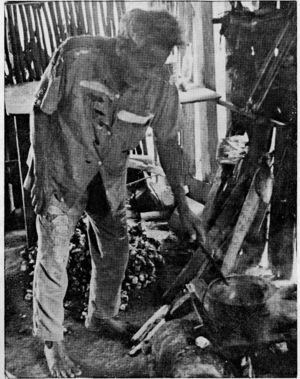
Indio rama cocinando ostras en Rama Cay.

La pesca es la más importante actividad para la gente de Rama Cay, en lo que concierne a la obtención de carne, al igual que lo es para las otras localidades ramas. Hombres, mujeres y niños usan anzuelos y manila y también recogen ostras. Solamente los hombres usan arpón, atarrayas de cuatro o cinco pies y "antorchas" para pescar en la noche, quemando hachones de hojas de sílico para atraer a los peces a la superficie. En el río Kukra también se usan trampas acuáticas, ocasionalmente con carnadas de pijibaye para coger mojarras ( Cichlasoma sp.). Los Rama pescan en agua dulce, en lagunas semisalobres, en las barras de los ríos y en el mar. Todo lo pescado por la gente de Rama Cay se registró durante un período de un año. Entre las capturas más frecuentes figuran el jurel ( Caranx hippos ), róbalo ( Centropomus sp), la mojarra, el sábalo real ( Megalops atlanticus ), la lisa ( Mugil sp.), y ocasionalmente el pejesierra ( Pristis sp.), el tiburón, la tortuga carey ( Eretmochelys imbricata ), la tortuga verde ( Chelonia mydas ), el mero ( Epinephalus sp.) y el manatí ( Trichechus sp.). Al camarón lo pescan durante la corta estación seca, entre marzo y mayo, vendiéndolo a los compradores de Bluefields principalmente.