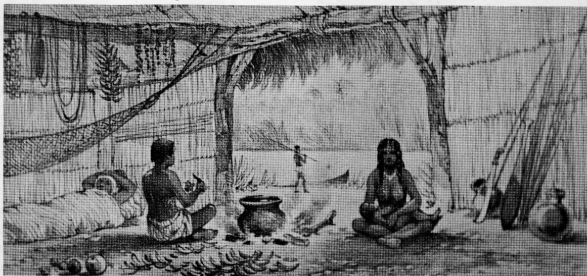
Interior de una vivienda Rama, en la desembocadura del río Punta Gorda, a mediados del siglo pasado, ilustrado del libro de Pim y Seemann (1869).

Los indios de Rama Cay fueron grandemente afectados por su vecindad a Bluefields, una población donde se habla el inglés criollo y, a partir de 1857, por la influencia de los misioneros moravos.