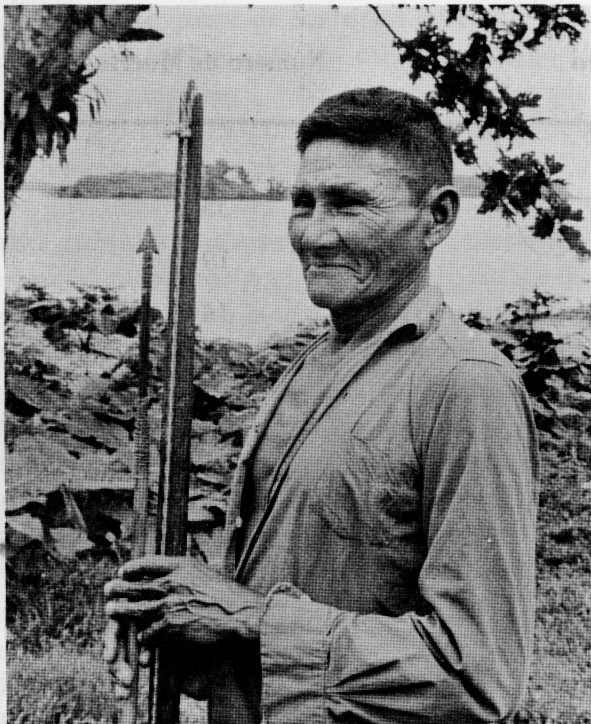
Nativo de Rama Cay con su arco y flechas hechos del cáñamo de la palma de pijibaye.

La iglesia Morava juega un papel muy significativo en la estructura social y en la vida religiosa de Rama Cay. Otras localidades ramas, como las mencionadas previamente, están menos influenciadas debido a su inaccesibilidad o por la ausencia de iglesia o de pastor en la comunidad.