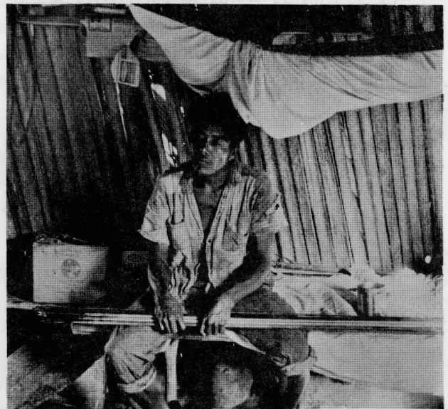
Camastro y mosquitero de una vivienda rama. El individuo tiene entre sus manos varias lanzas con puntas hechas de dientes de tiburón.

Presionados por el espacio, en una isla pequeña y careciendo de medios de proveerse de materiales de construcción, las casas de los Rama se ven ocupadas por más de una familia. En 1969, 85 familias estaban albergadas en 32 habitaciones. La descendencia monógama es unilineal. Hay casos de hermanos que traen a sus esposas a vivir con sus padres, al igual que lo hacen las hermanas con sus respectivos esposos; todos en la misma casa hasta que se pueda construir un nuevo hogar. El matrimonio con los forasteros es restringido, pero ocurren infracciones a esta regla y la comunidad reacciona en forma diferente para cada caso. Por ejemplo, existen tres casos de hombres Rama con esposas no Ramas, que viven alejados en los caños vecinos, a la vez, unos pocos cónyuges no Rama viven en Rama Cay. Debido a las restricciones matrimoniales para con los forasteros, dentro de esta pequeña población existe preponderancia de apellidos tales como Omeir, McCrea, Salomon y Martínez.