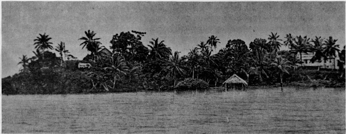
Rama Cay (Ramaquí), alrededor de 1890. Histórica fotografía tomada de Felbdalle (1893); con la iglesia morava a la derecha.

La obra de la iglesia se realizó en inglés, idioma que los Rama comprendían a causa de sus visitas a Bluefields y en razón de que “el número de indios Rama era tan reducido que no valía la pena introducir el estudio de una nueva lengua en las labores (de la iglesia)” (Mueller, 1932: 76). Al poco tiempo el inglés se hablaba ampliamente y algunos observadores anotaron, a finales de la década de 1860, que “no existe duda de que la nueva generación no hablara más que aquélla, ya que su propia lengua está cayendo rápidamente en desuso” (Pim y Seemann, 1869: 280). En la actualidad apenas se cuentan cinco o seis individuos que pueden hablar rama en Rama Cay.