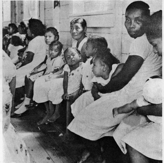
Mujeres y niños de Rama Cay asistiendo al servicio dominical de los Moravos.

➤ Reducidos en territorio, número y cultura, el remanente de los Rama ha sobrevivido en nichos de refugio, aceptando algo del mundo exterior, mientras conservan mucho de lo suyo, para mantenerse culturalmente unidos y así poder sobrevivir.