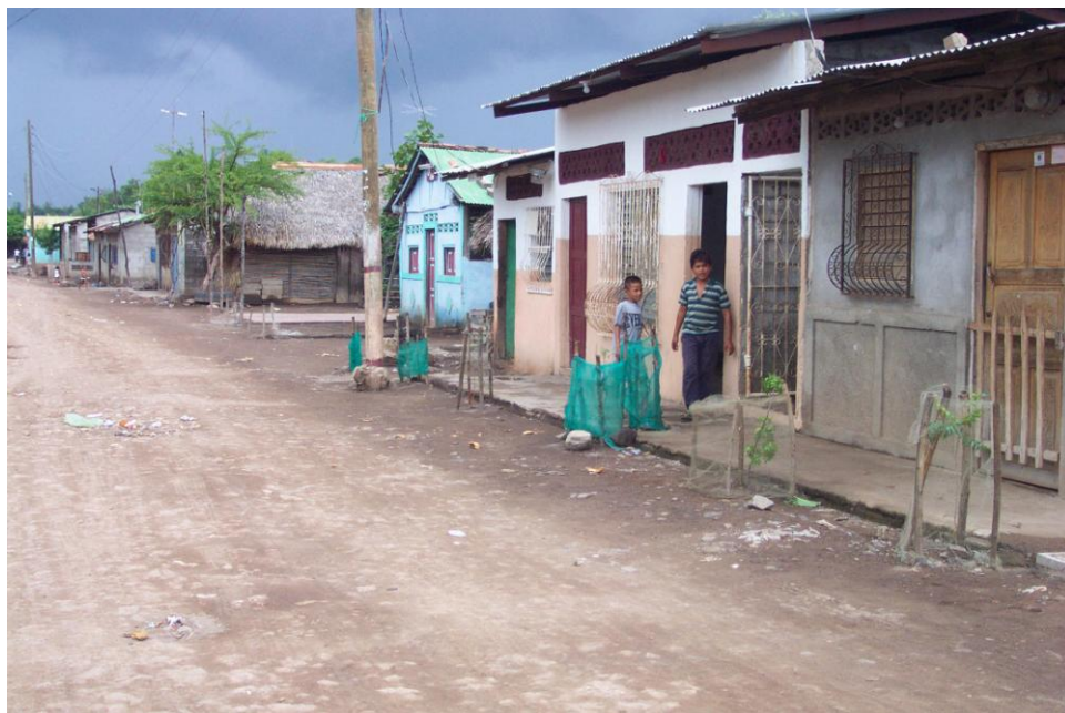
Figura No.11. Casa de Familias con un nivel económico mayor