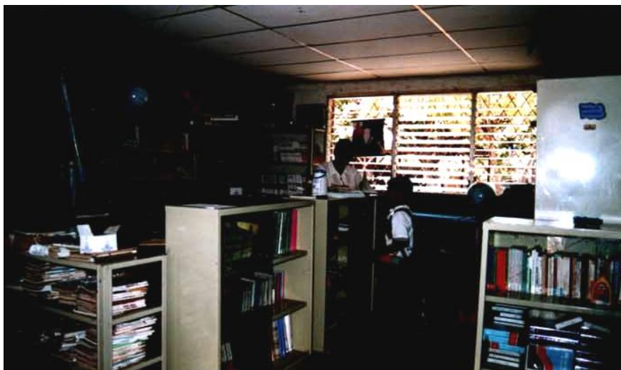
Figura No.6. Biblioteca de la escuela de Puerto Morazán, montada por la UCA y LORRNICA