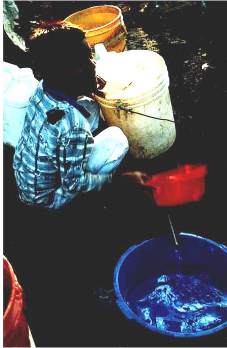
Figura No.3. Obtención de agua en Puerto Morazán

En lo que concierne a el estado vial la llegada a Puerto Morazán se hace sobre un camino de piedra, no alquitrano. Pero en el centro del pueblo hay una parte de la carretera que esta pavimentada.