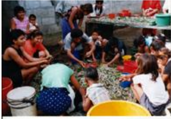
Figura No.9. Limpieza de camarón de pesca por la familia en Puerto Morazán