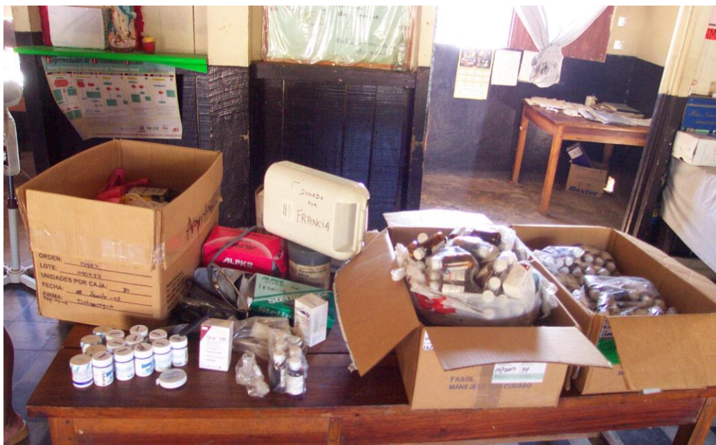
Figura No.14. Entrega de medicina enviada por LORRNICA al Puesto de Salud de Puerto Morazán

En efecto, la asociación ayuda con frecuencia a el centro de salud, la escuela y algunas familias que necesitan una ayuda urgente. Así eso ha permitido mejorar la calidad de la asistencia social. Esta da gratuitamente medicamentos, sábanas y material en el centro de salud. Además esto ha permitido a la escuela tener una biblioteca por medio de la donación de libros. Esta proporciona material escolar (cuaderno, lápiz...) a niños, permitiendo así a mas niños ir a la escuela. Hace también una asistencia individual en hogares que están en gran necesidad. Financia medicamentos, alimentos a familias que son muy pobres y donde hay personas muy enfermas.