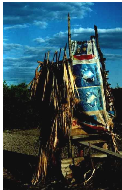
Figura No.2. Servicios higiénicos de Puerto Morazán.