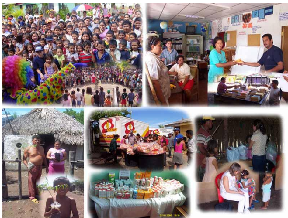
Figura No.13. Actividades que frecuentemente se realizan con la población de Puerto Morazán