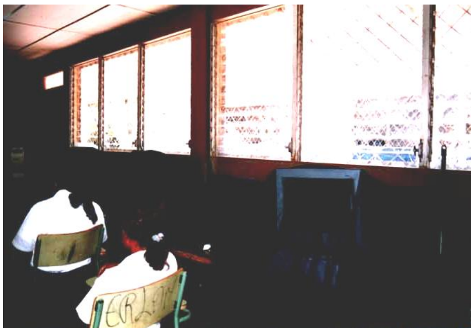
Figura No.4 y 5. Momentos de clase en las escuelas de Puerto Morazán