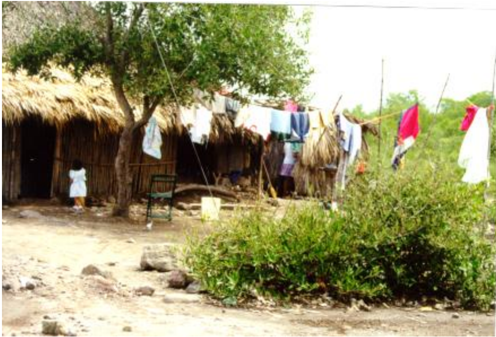
Figura No.10 Casa de Familias con un nivel económico menor

Entonces un desarrollo a largo plazo es difícil sin inversión que permita tener menos diferencias entre la época de lluvia y la época seca.