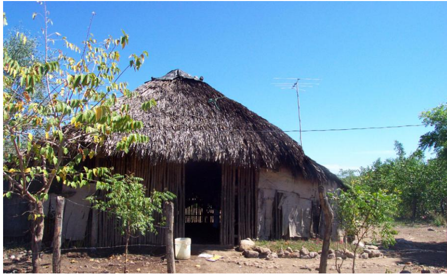
Figura No.1. Típica vivienda de Puerto Morazán.

La situación sanitaria no es adecuada. En efecto, los baños están fuera de la casa y el acceso se hace sobre tablas. No están cerrados y están hechos de palma o de madera.