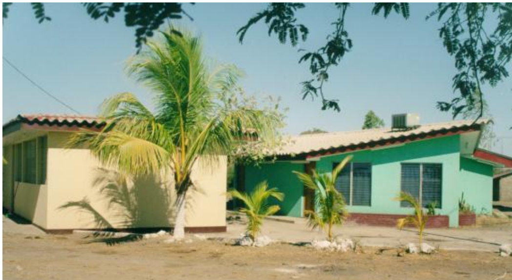
Figura No.12. Infraestructura de la UCA en Puerto Morazán

Es un trampolín porque permite traer la ayuda directamente a las familias más pobres y dar un apoyo muy eficaz. Las personas que trabajan a diario en la UCA en Puerto Morazán son un gran pilar para la asociación porque están inmersos en el campo. Esto asegura una repartición de la ayuda de la mejor manera posible.