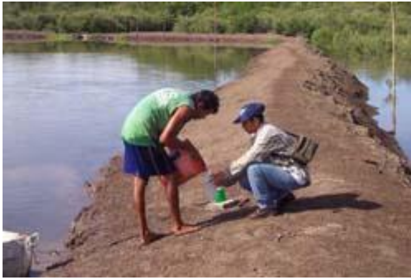
Figura No.8. Proyectos de cooperativa camaronera de Puerto Morazán

los pescadores individuales. Mientras que, los pescadores artesanales venden sus cosechas a comerciantes de Puerto Morazán, las cooperativas las venden a grandes empresas internacionales para la exportación.