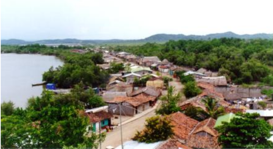
Figura No.15. Vista de Puerto Morazán desde lo alto

Puerto Morazán recibe, entonces, con frecuencia varias ayudas extranjeras. Desde la implantación de esta fundación la situación en el pueblo cambió y mejoró. Aunque los resultados de esta ayuda no están visibles a escala individual eso permitió mejorar mucho las condiciones de vida para la comunidad. Los efectos son más comunes y menos individuales, pero eso trae un progreso muy grande para la población entera.