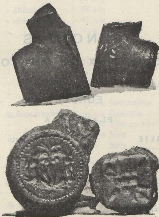
Fig. 3. = Coins 278 A-B (planche I, Scyros).

Ici, pour le moment, je note seulement que les fausses monnaies de Christodoulos, quand il les vend, n'ont pas l'aspect assez rude visible sur les plâtres tirés de ses coins mêmes pour nos planches. Il les re-travaille à la main; il les charge de contremarques, de poinçons des