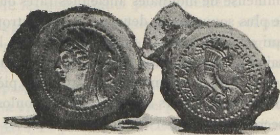
Fig. 2.—Coin N° 525 A-B (Planche Q, Arsinoé d'Égypte).