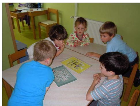
Sliki 26 in 27: Nastajanje zgodbe Prijatelja