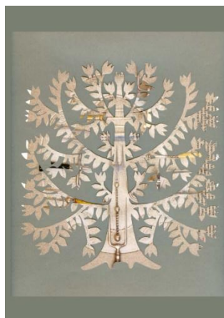
Sliki 24 in 25: Prijatelja