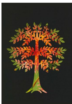
Slika 12: Živobarvno drevo