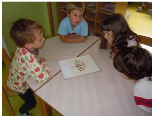
Sliki 4 in 5: Nastajanje zgodbe Nenavadno drevo