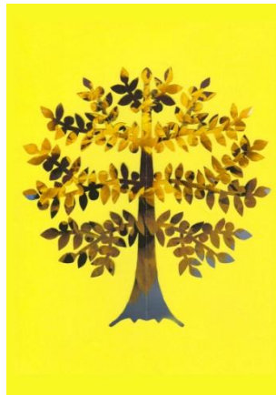
Slika 9: Čudežno drevo