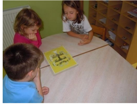
Sliki 7 in 8: Nastajanje zgodbe Prestrašeno drevo