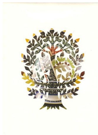
Slika 31: Okroglo drevo