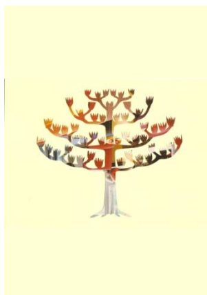
Slika 3: Nenavadno drevo