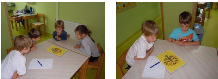
Sliki 10 in 11: Nastajanje zgodbe Čudežno drevo