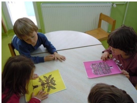
Sliki 19 in 20: Nastajanje zgodbe Hrast in palma