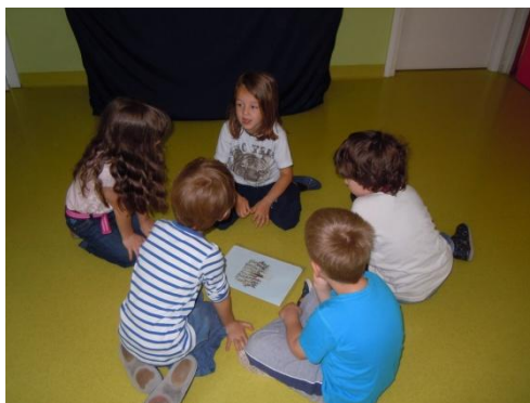
Sliki 35 in 36: Nastajanje zgodbe Voden drevo