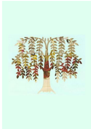
Slika 34: Vodeno drevo