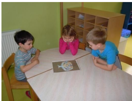
Slika 2: Nastajanje zgodbe Mavrično drevo

Nekoč je živel mavrično drevo, bilo je zelo pisano. Toda to drevo ni bilo navadno, bilo je čarobno. Nekega dne se je pred njim pojavila mavrična Mavrica, obsijalo ga je sonce. Drevo ji je potožilo: »Veš, Mavrica, jaz sem čarobno drevo, ostala drevesa okrog mene pa niso čarobna, zato mi je zelo dolgčas.« Mavrica ga je potolažila: »Tudi jaz sem čarobna mavrica in ti lahko izpolnim eno željo.« Drevo se je razveselilo in si zaželelo, da bi poleg njega zraslo še eno čarobno mavrično drevo. In res, ponoči, ko je drevo spalo, je Mavrica začarala, da je ob njem zraslo še eno čarobno mavrično drevo. Zjutraj, ko se je drevo prebudilo in zagledalo novega prijatelja, je bilo zelo veselo in skupaj sta od sreče kar zaplesala.