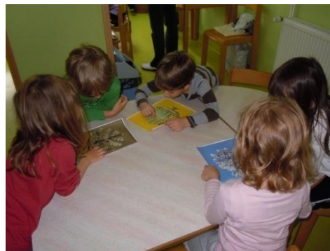
Sliki 41 in 42: Nastajanje zgodbe Letni časi