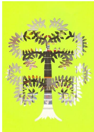
Slika 6: Prestrašeno drevo