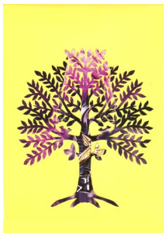
Slika 21: Posebno drevo