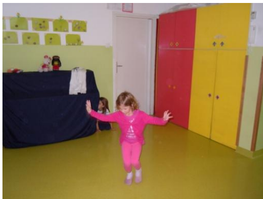
Slike 43, 44, 45, 46, 47 in 48: Gibalna uprizoritev