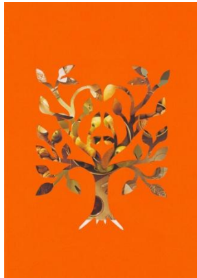
Slika 14: Zlato drevo