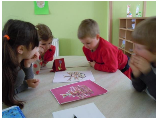
Slika 30: Nastajanje zgodbe Breza in listavec

Starša deklice M sta se lansko leto ločila, mogoče je skozi to zgodbo izrazila željo, da bi bila mamica in očka zopet skupaj.