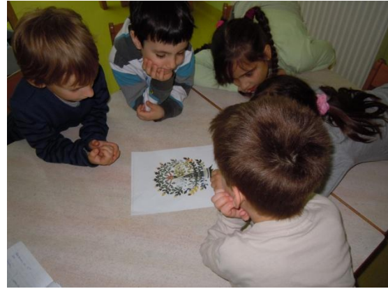
Sliki 32 in 33: Nastajanje zgodbe Okroglo drevo