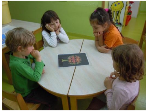
Slika 13: Nastajanje zgodbe Živobarvno drevo

Pri zgodbi je sodelovala deklica, ki ima mlajšo sestrico in bratca, ki ju mora velikokrat paziti. Mlajši bratec je v sosednji skupini, zato se tudi v vrtcu velikokrat počuti odgovorna zanj. Vidi se, da ji včasih ni všeč, da mora paziti mlajšega bratca in sestrico, večkrat si zaželi, da bi bila sama. Če pa jo potrebujeta, jima seveda pomaga. Ker je bila ona pobudnica zgodbe, lahko morda sklepam, da je govorila svojo zgodbo.