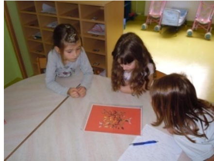
Sliki 15 in 16: Nastajanje zgodbe Zlato drevo