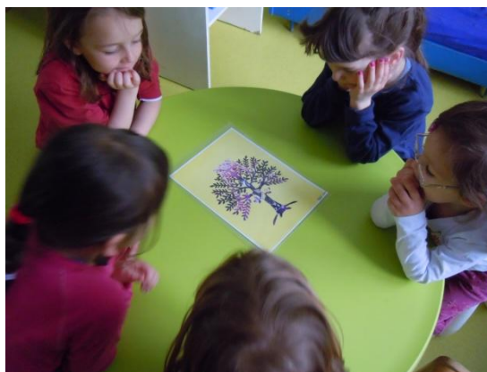
Sliki 22 in 23: Nastajanje zgodbe Posebno drevo