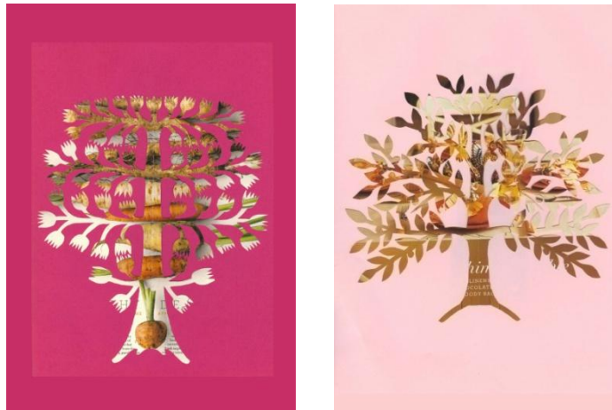
Sliki 28 in 29: Breza (levo) in listavec (desno)