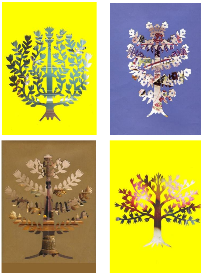
Slike 37, 38, 39 in 40: Pomladno drevo (levo zgoraj), zimsko drevo (desno zgoraj), jesensko drevo (levo spodaj), poletno drevo (desno spodaj)