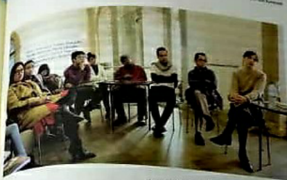
Figura 1. CuratorLAB, Fridericianum, Kassel, Jerman 2016

Documenta 14 diarahkan oleh Adam Szymczyk yang berasal dari Poland. Seorang pengkritik seni dan juga kurator. Mengikuti konsep Documenta 14, ianya dijalankan serentak di Kassel dan Athens di bawah motto pameran 'Learning from Athens' atau 'Belajar dari Athens' dengan pembukaan awal dua bulan pameran di Athens sebelum Kassel dan ianya berjalan selama 100 hari. Kesemua artis melakukan pameran di kedua-dua tempat tanpa perlu mempamerkan karya yang sama. Seperti pameran-pameran besar yang lain, Documenta 14 juga menjadi kerisauan beberapa pihak yang