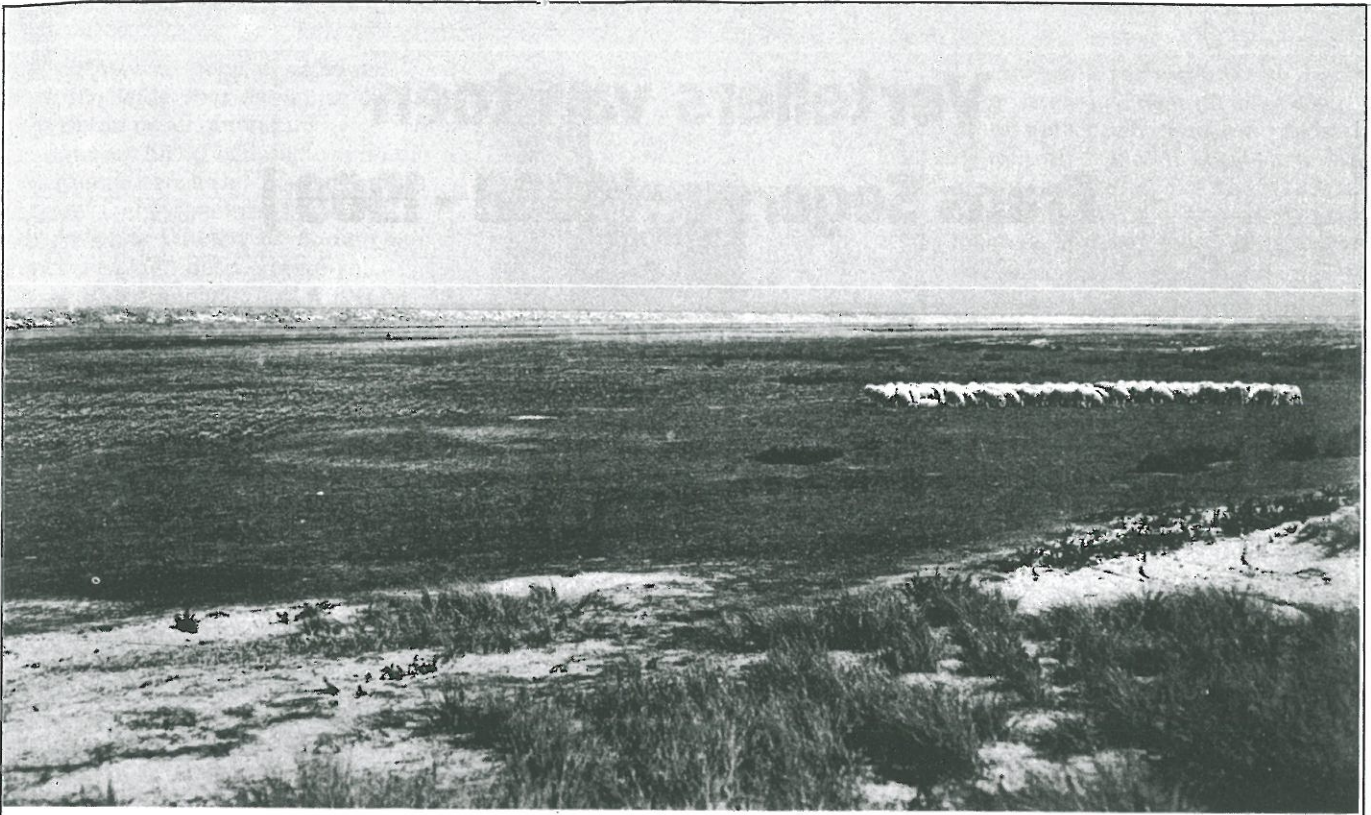
Het ongerepte Zwin met zijn kudde schapen, vastgelegd door Jean Massart op 6 september 1904

Over de schapen en hun herders in voorgaande eeuw werd in 1968 uitvoerig geschreven door Lucien Dendooven. Hieruit onthouden we dat de schapenteelt in onze zeepolders reeds sedert de Middeleeuwen zeer belangrijk geweest is.