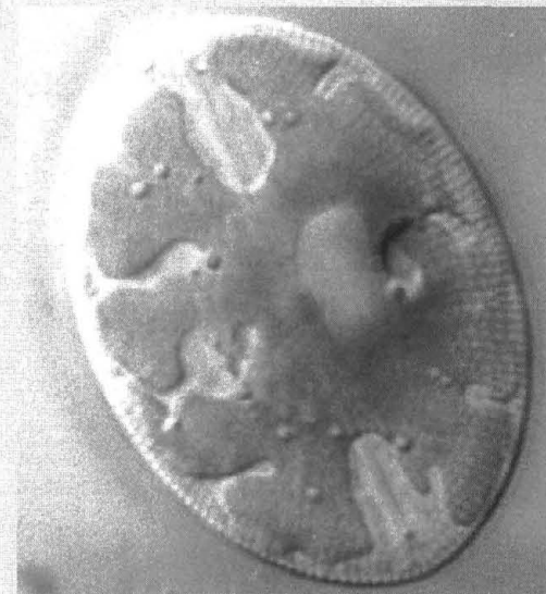
Navicula orthoneoides Hustedt is een typische diatomee van zandstranden aan de monding van het Schelde estuarium.

De matten vormen zich niet overal – de matvormende organismen behoren immers tot het epipelon, de vrijlevende fractie van het microfytobenthos. Populaties van deze organismen ontwikkelen zich slechts optimaal op relatief beschutte plaatsen, waar het sediment door slibaccumulatie meer fijnkorrelig is. Diatomeeën bewegen zich voort door de afscheiding van een soort slijm dat voornamelijk uit verschillende suikers bestaat. Daarnaast scheiden de algen in het licht diverse suikers uit. Deze suikers kitten de sedimentpartikels aan elkaar, zodat het microfytobenthos ook een belangrijke sediment-stabiliserende werking heeft. Dit is een mooi voorbeeld waarbij de ecologie van enkele soorten algen de morfologie van een geheel ecosysteem kan beïnvloeden.