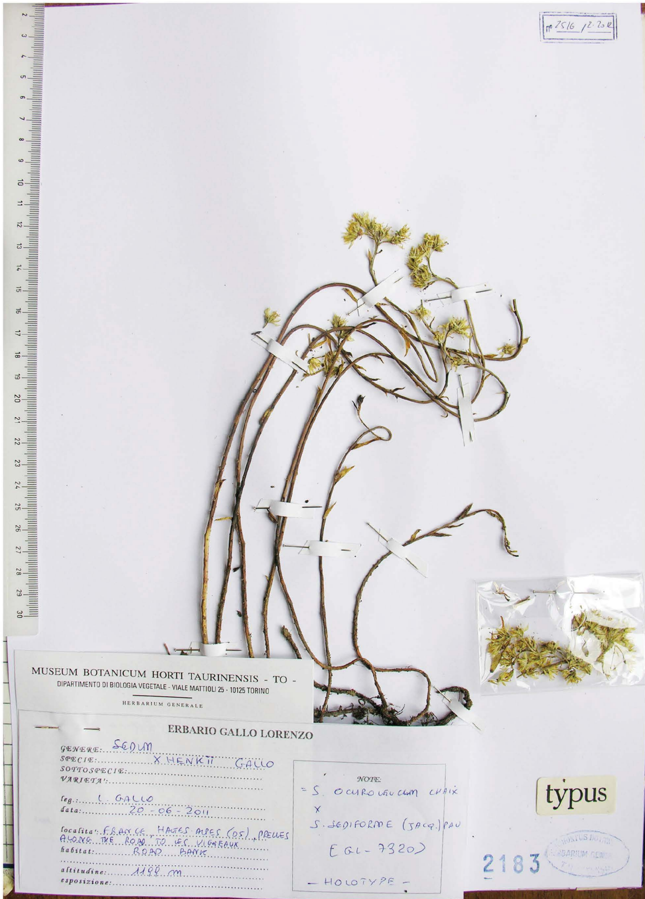
Fig. 4 = Holotype of S. xhenkii Gallo (GL7320 - TO)

line, keeled, pale yellow in bud. Filament white-green, papillose; anther cylindrical yellow, carpel green and papillose, style slightly outwards.