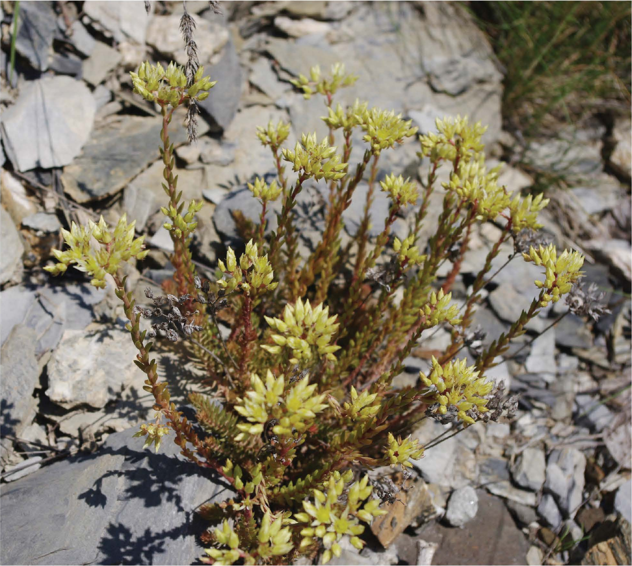
Fig. 8 = Sedum × pascalianum Gallo: Vallon de Caramagne, 1100 m (Val Roya, Provence-Alpes-Côte d'Azur, France), 6/07/2011 (type locality)