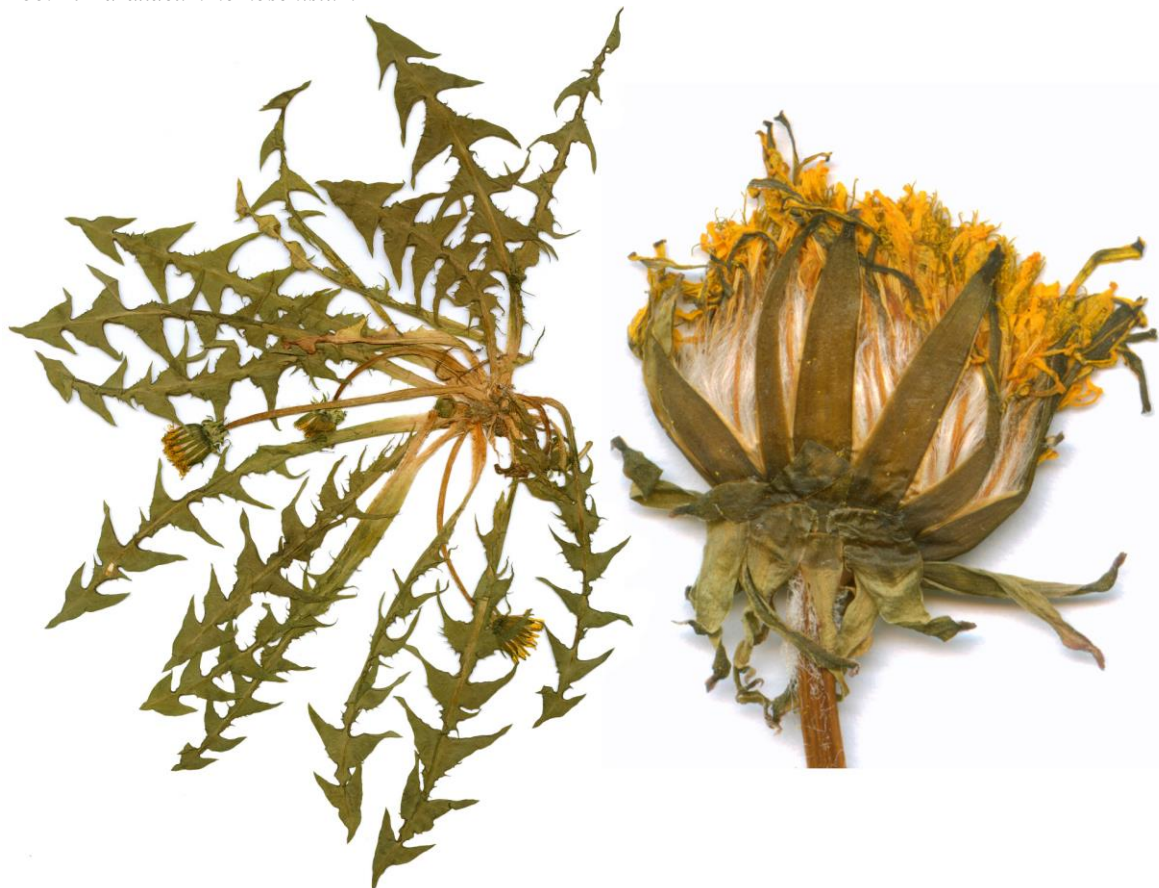
Abb. 18 Taraxacum infuscatum