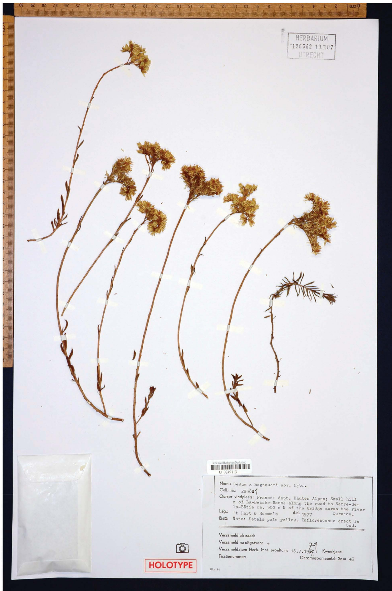
Fig. 3 = Holotype of S. xhegnaueri 't Hart (HRT22581 - L)