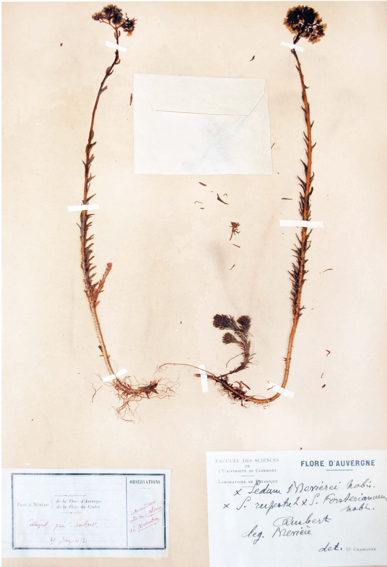
Fig. 2 = Holotype of S. brevieri Chass. (CLF)