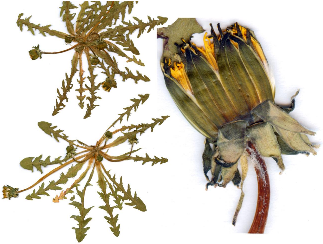
Abb. 9 Taraxacum broddesonii