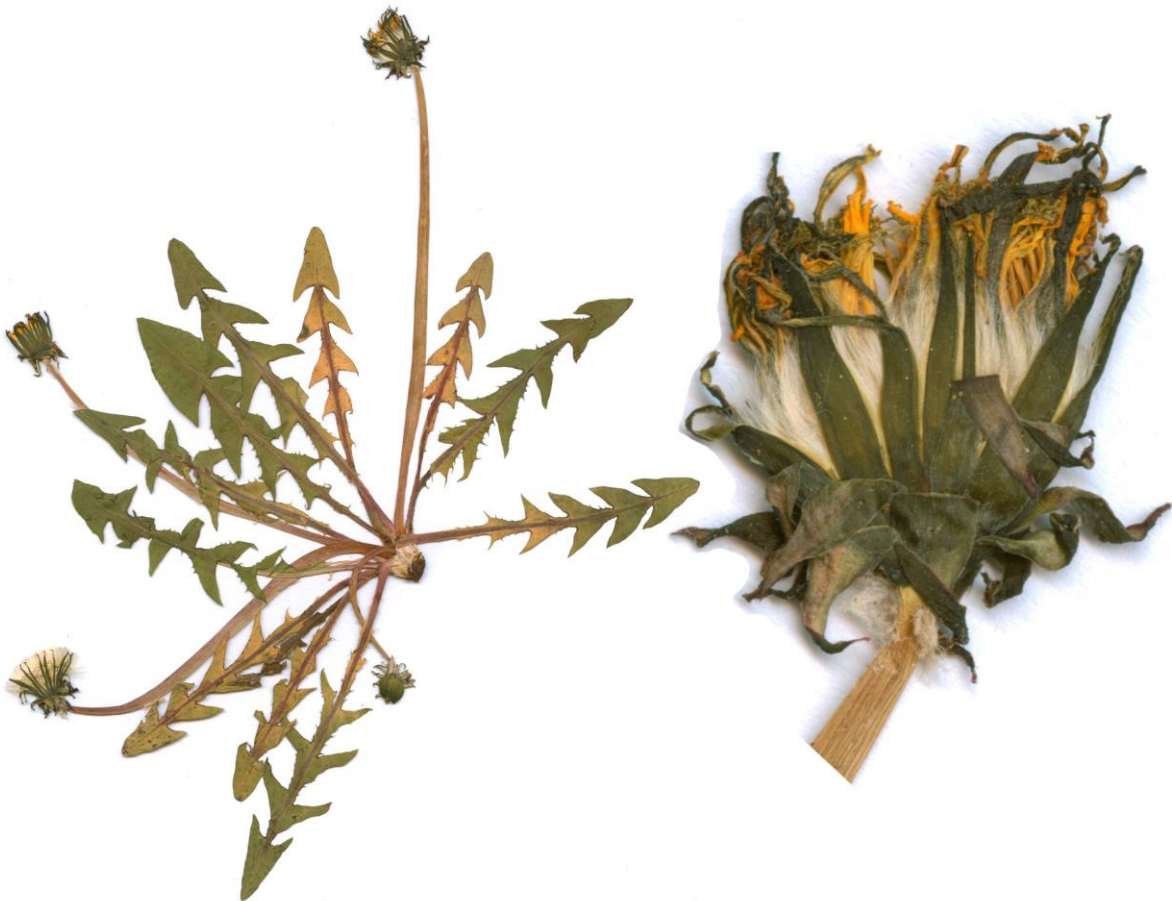
Abb.2 Taraxacum fusciflorum