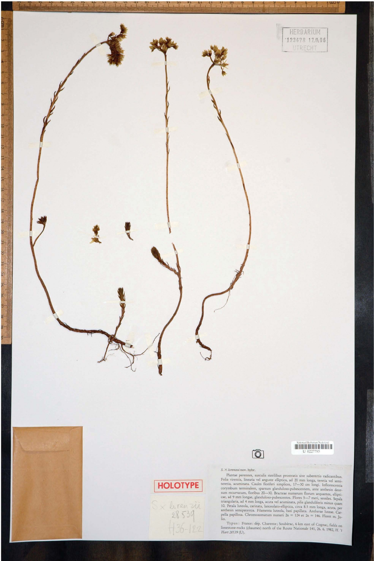
Fig. 5 = Holotype of S. x lorenzoi 't Hart (HRT28539 - L)