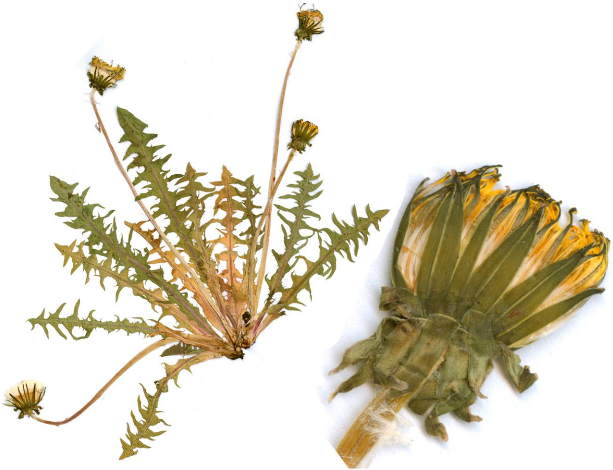
Abb.35 Taraxacum unidentatum