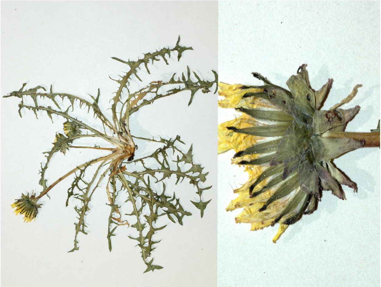
Abb.1 Taraxacum rhaeticum