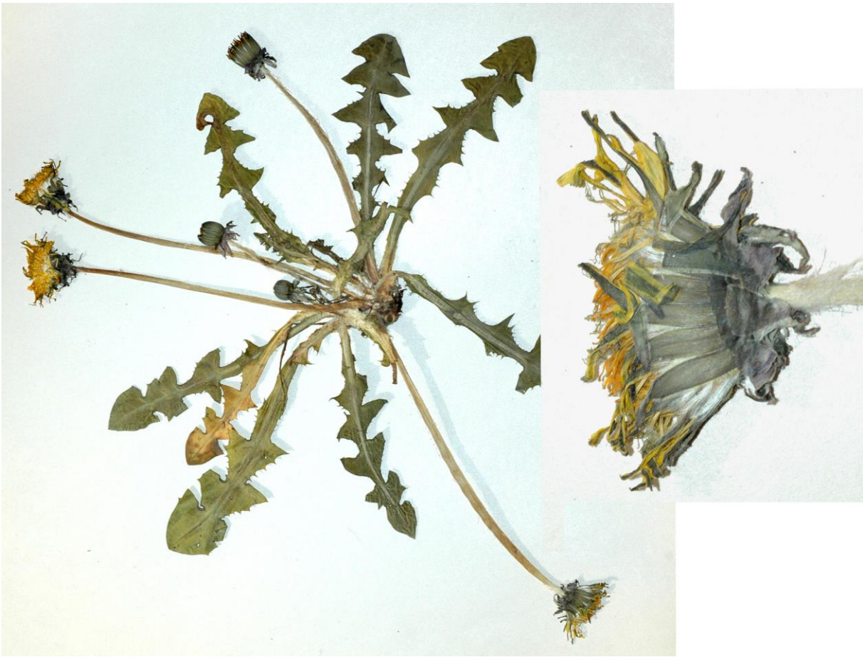
Abb. 19 Taraxacum intumescens