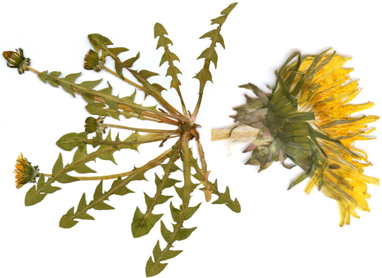
Abb. 13 Taraxacum freticola