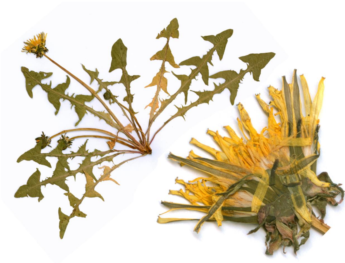
Abb. 34 Taraxacum sundbergii