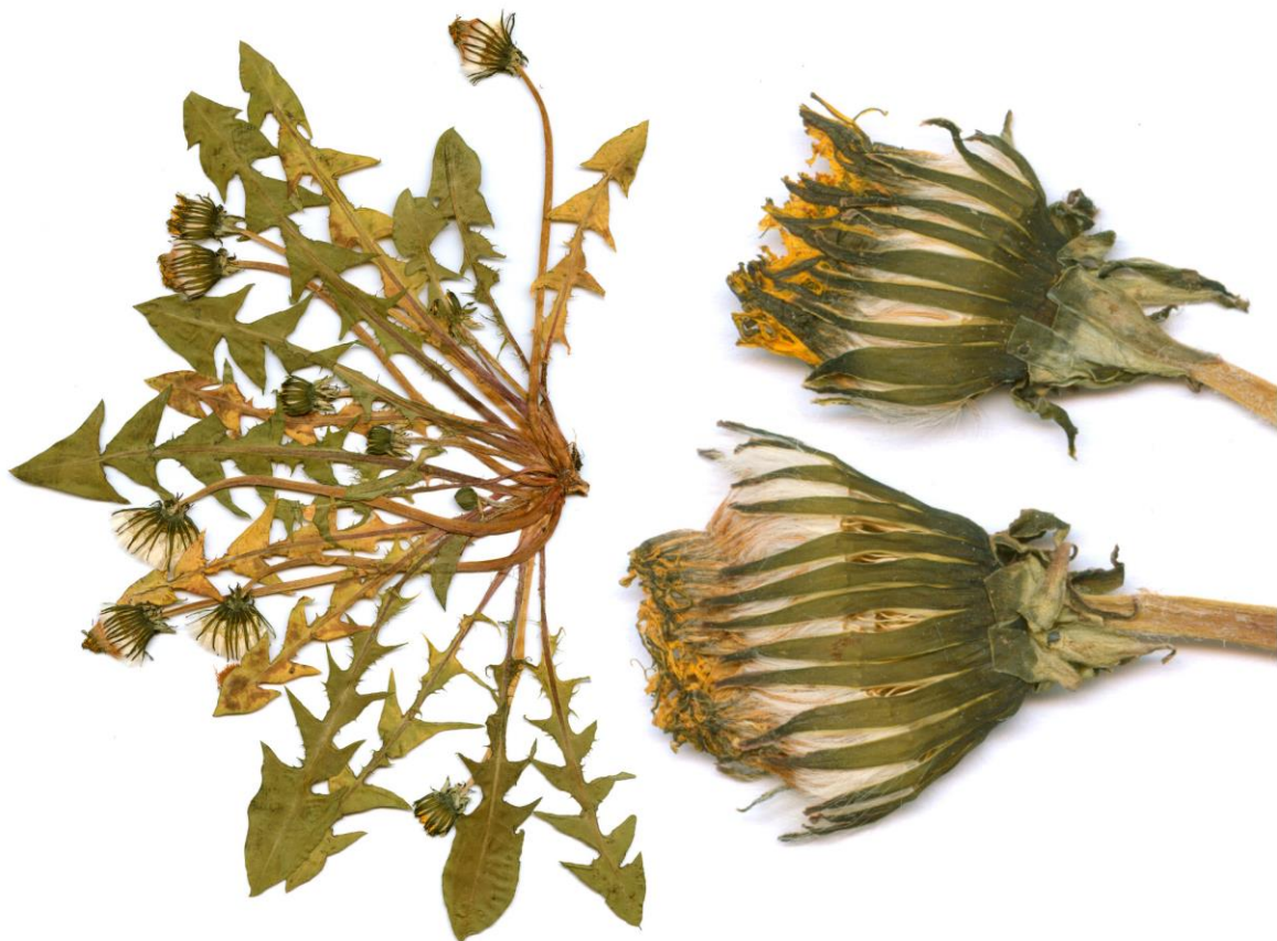
Abb. 22 Taraxacum lojoense