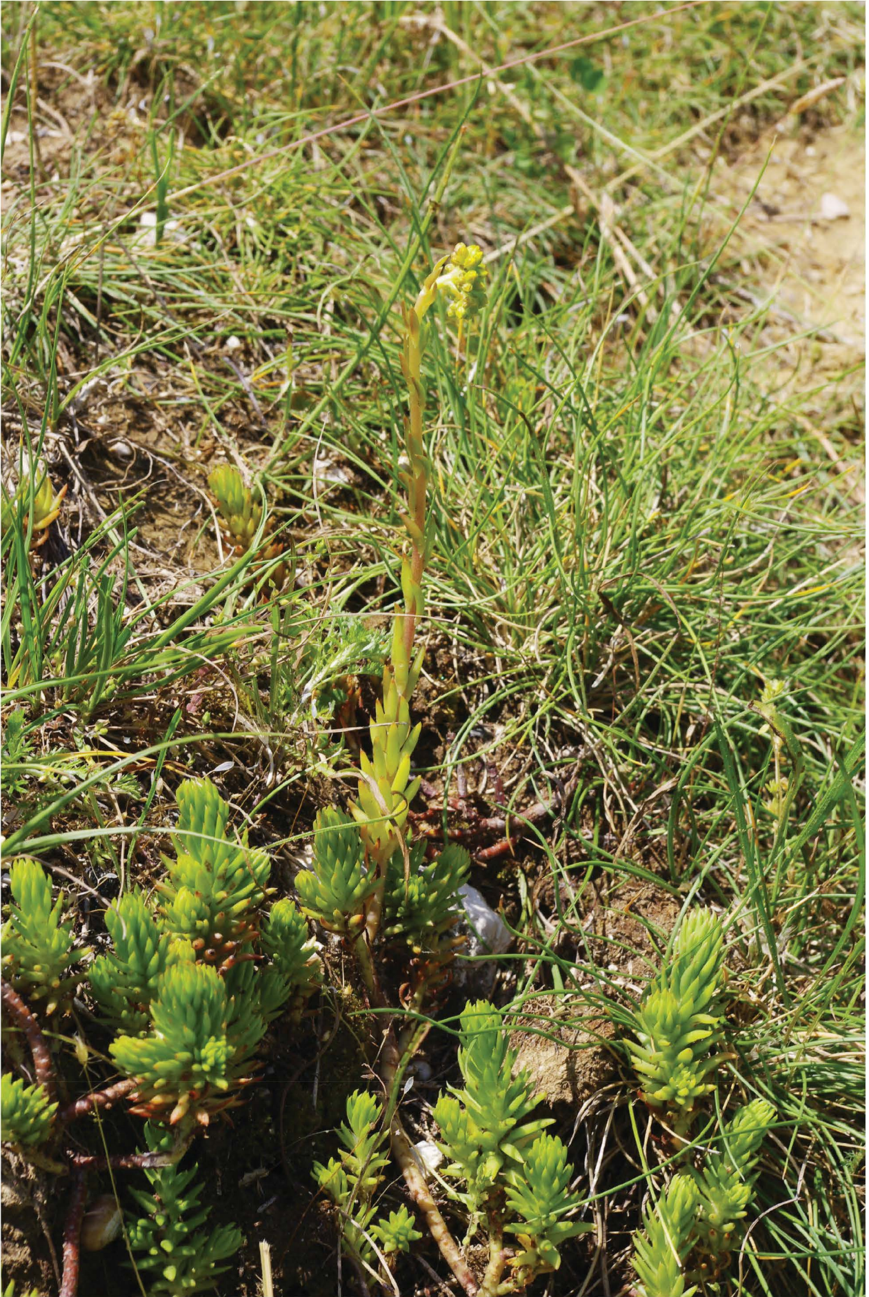
Fig. 7 = Sedum affomarcoi Gallo & Afferni: Campo Felice, 1400 m (L'Aquila, Abruzzo, Italy), 29/06/2011