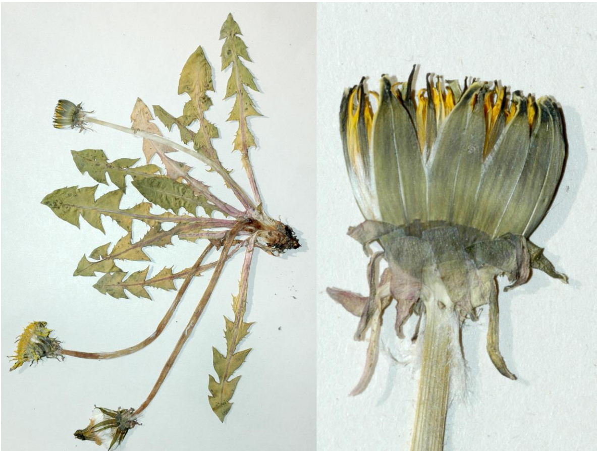
Abb. 16 Taraxacum hemicyclum