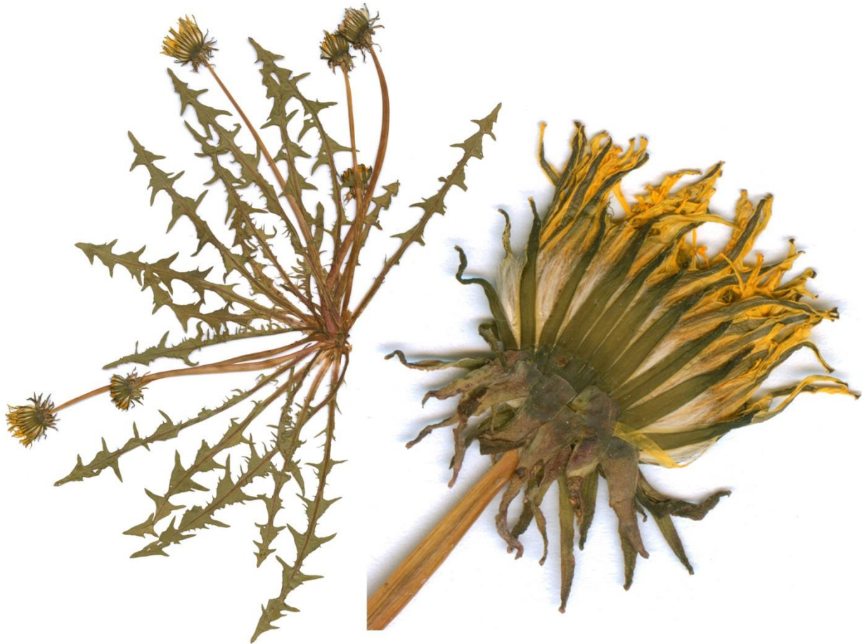
Abb. 37 Taraxacum violaceinervosum