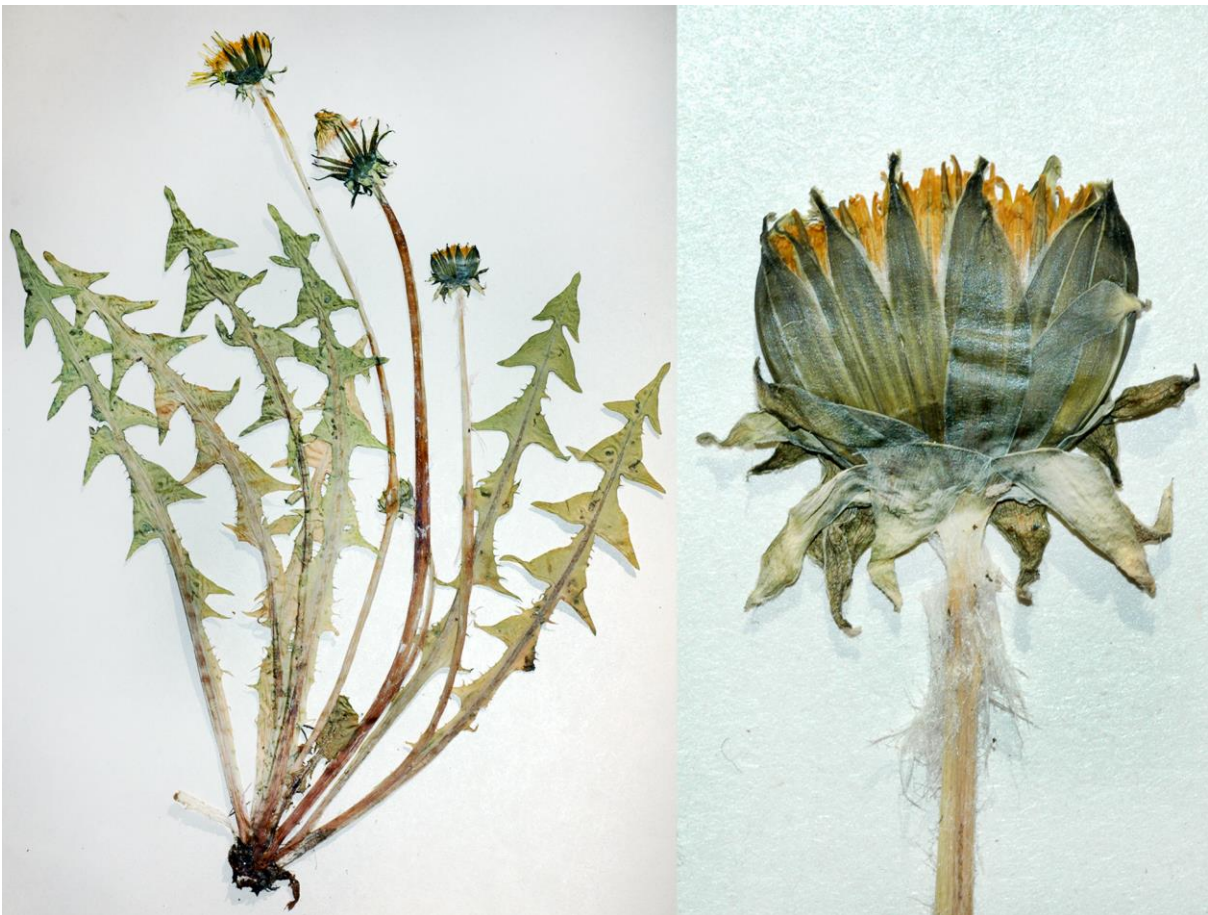
Abb. 6 Taraxacum acroglossum