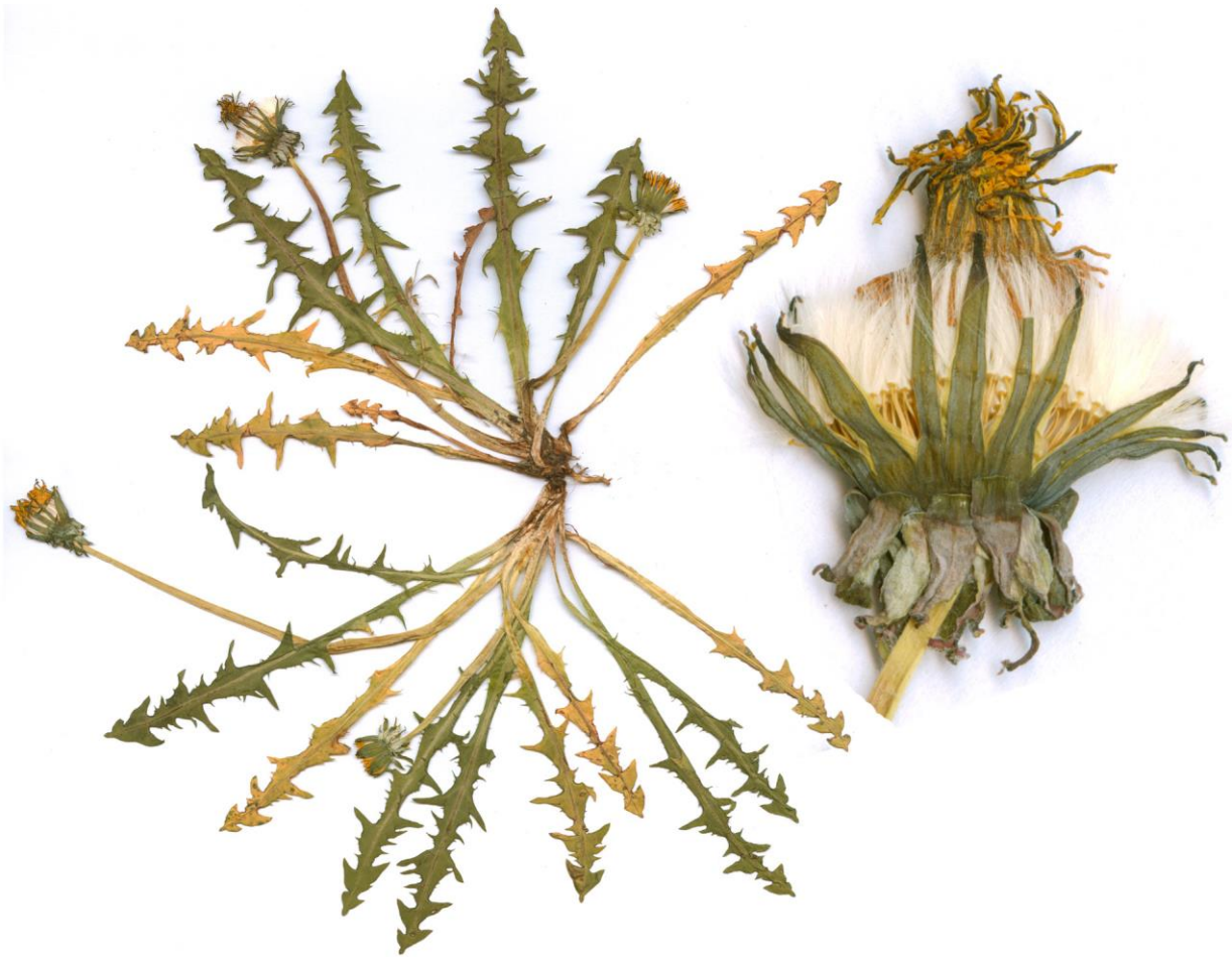
Abb. 21 Taraxacum leucopodum