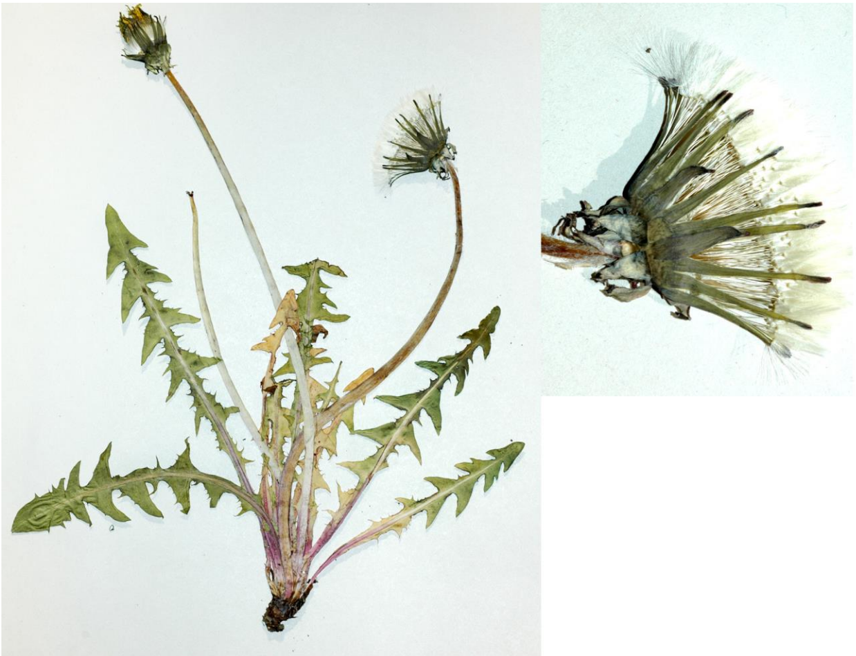
Abb. 15 Taraxacum glossodon