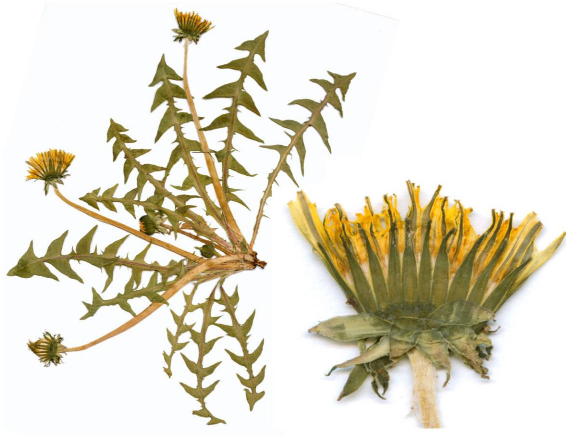
Abb.32 Taraxacum saxonicum