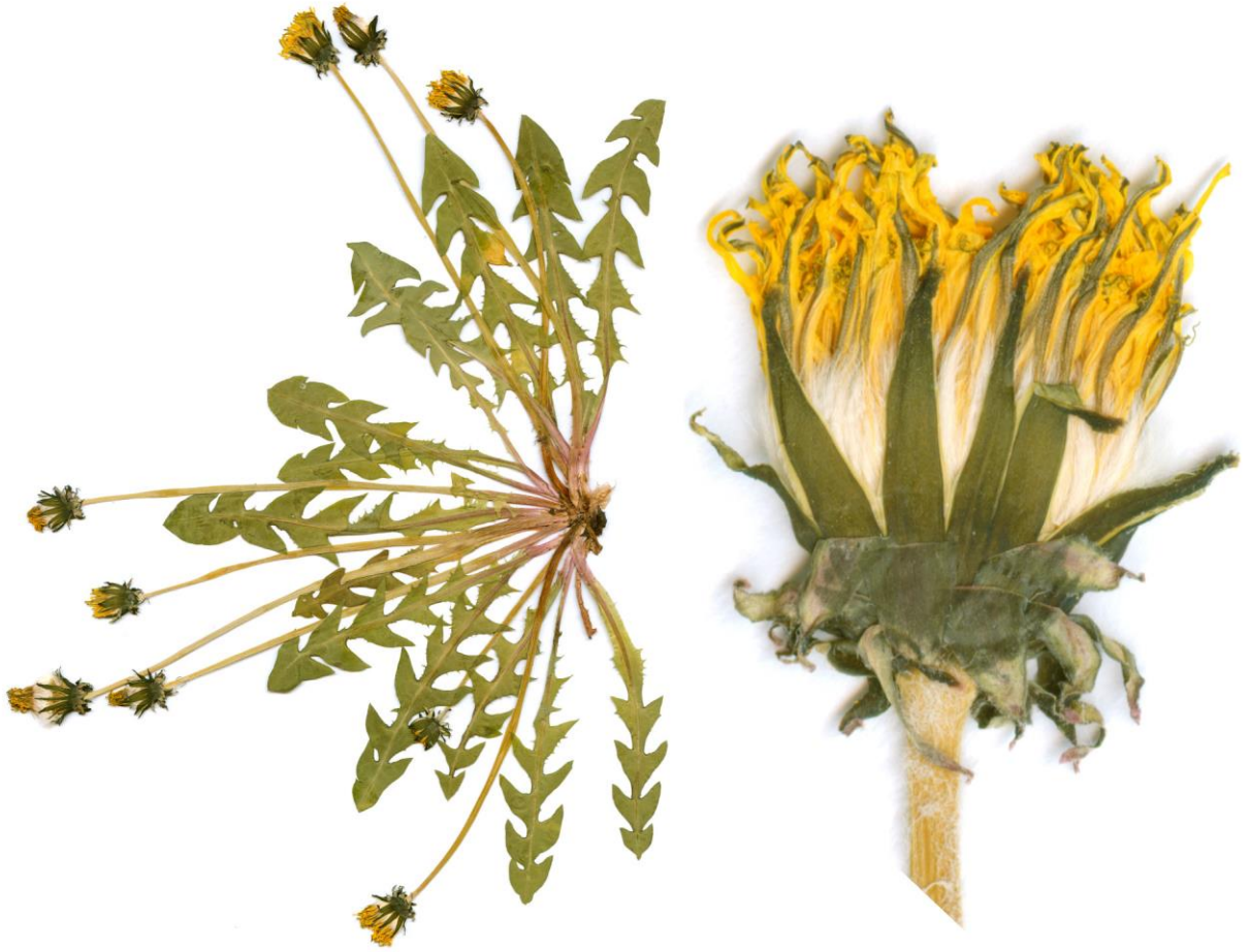
Abb. 25 Taraxacum oblongatum