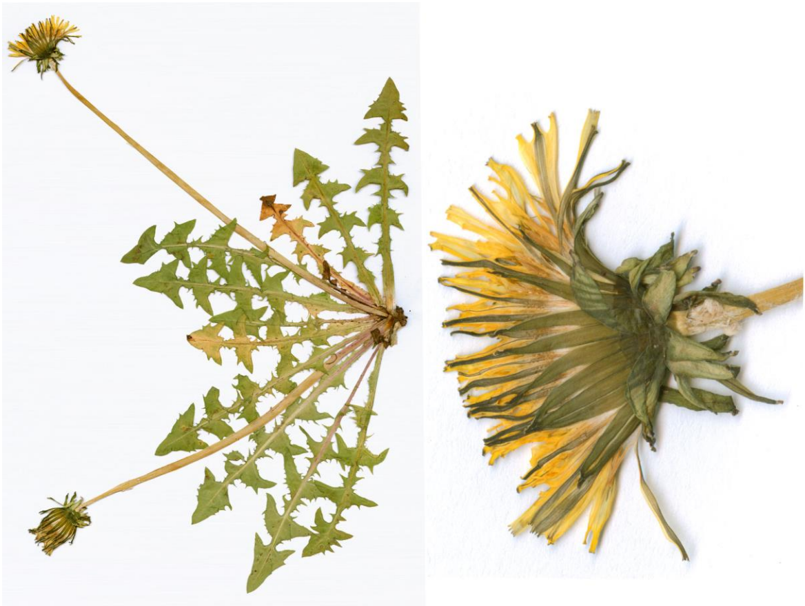
Abb. 26 Taraxacum ottonis