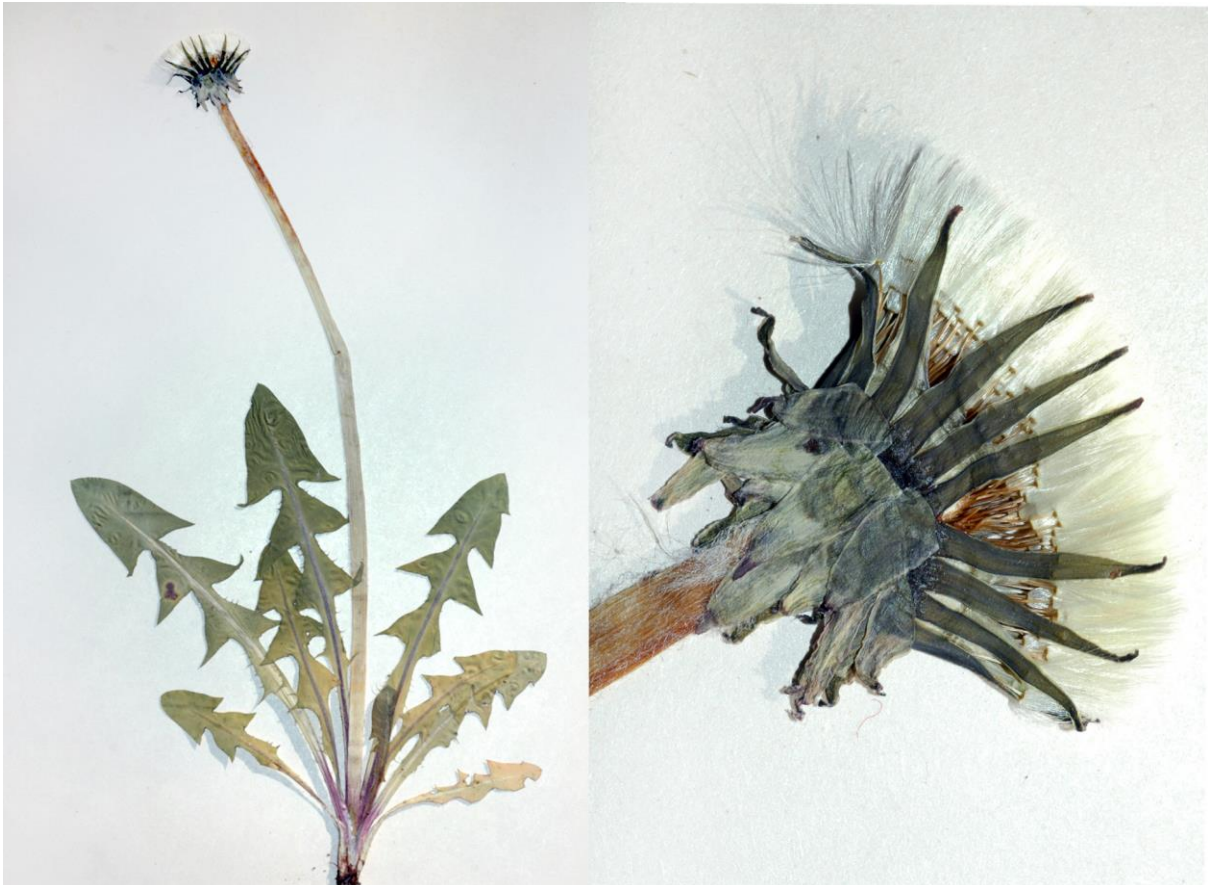
Abb. 24 Taraxacum moldavicum