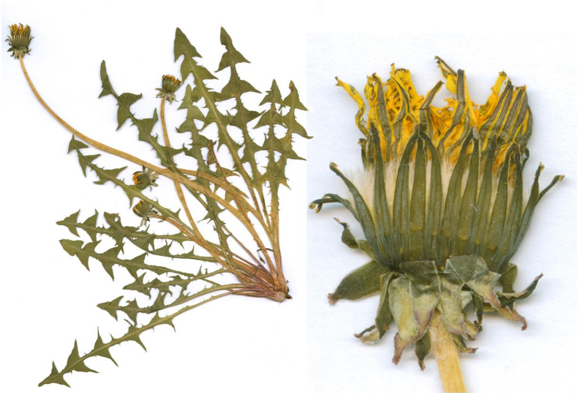
Abb. 10 Taraxacum clarum