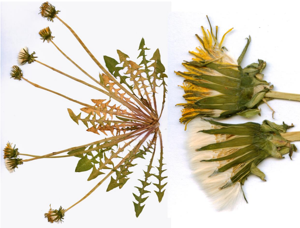
Abb. 28 Taraxacum praestabile