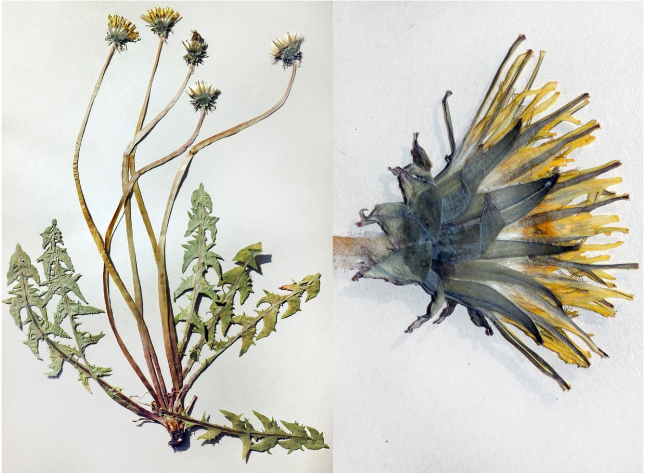
Abb.3. Taraxacum marklundii