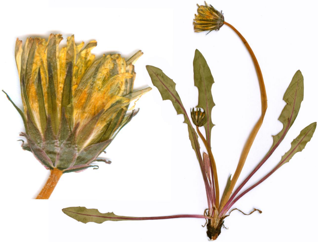
Abb. 5 Taraxacum vindobonense