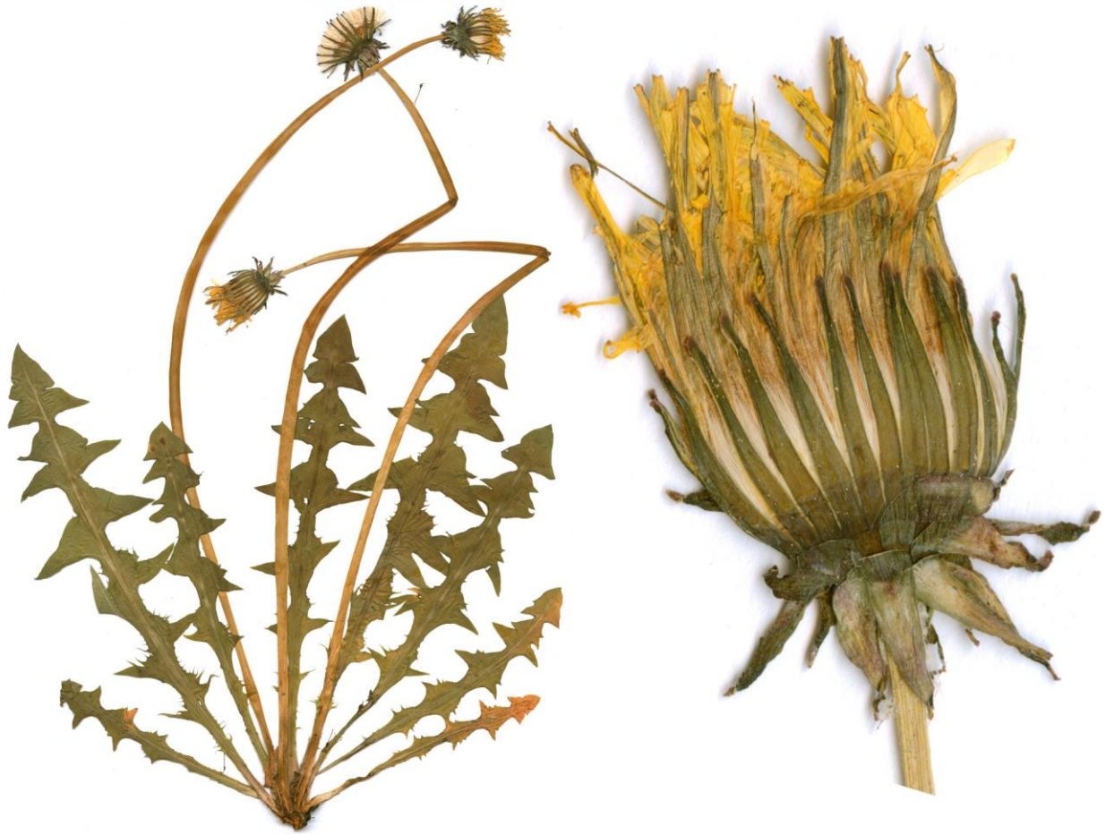
Abb. 33 Taraxacum sellandii