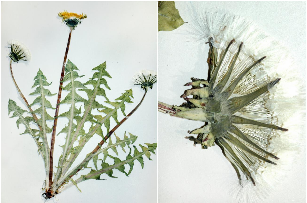
Abb. 14 Taraxacum gesticulans