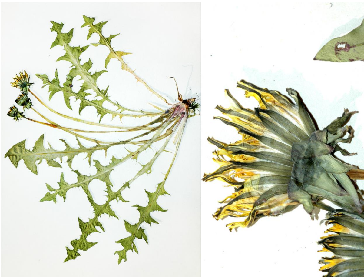
Abb. 20 Taraxacum laciniatum