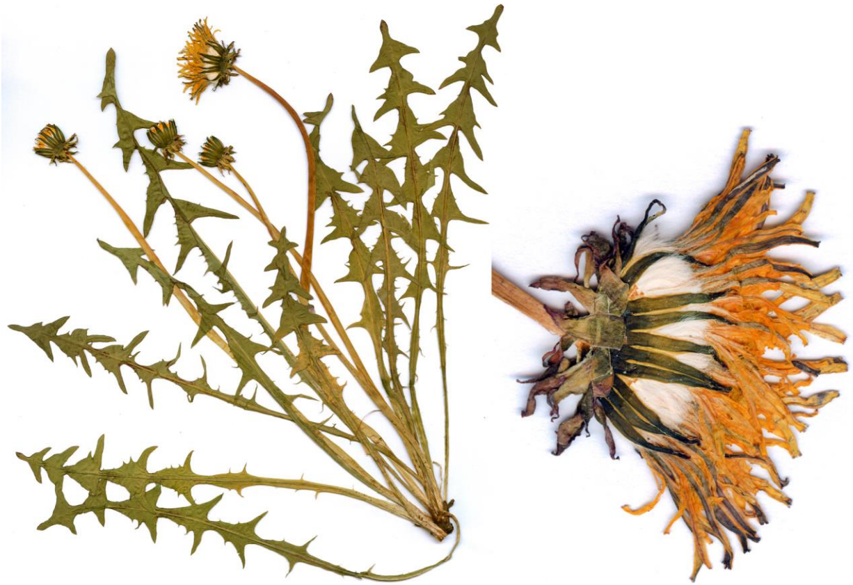
Abb. 7 Taraxacum atroviride