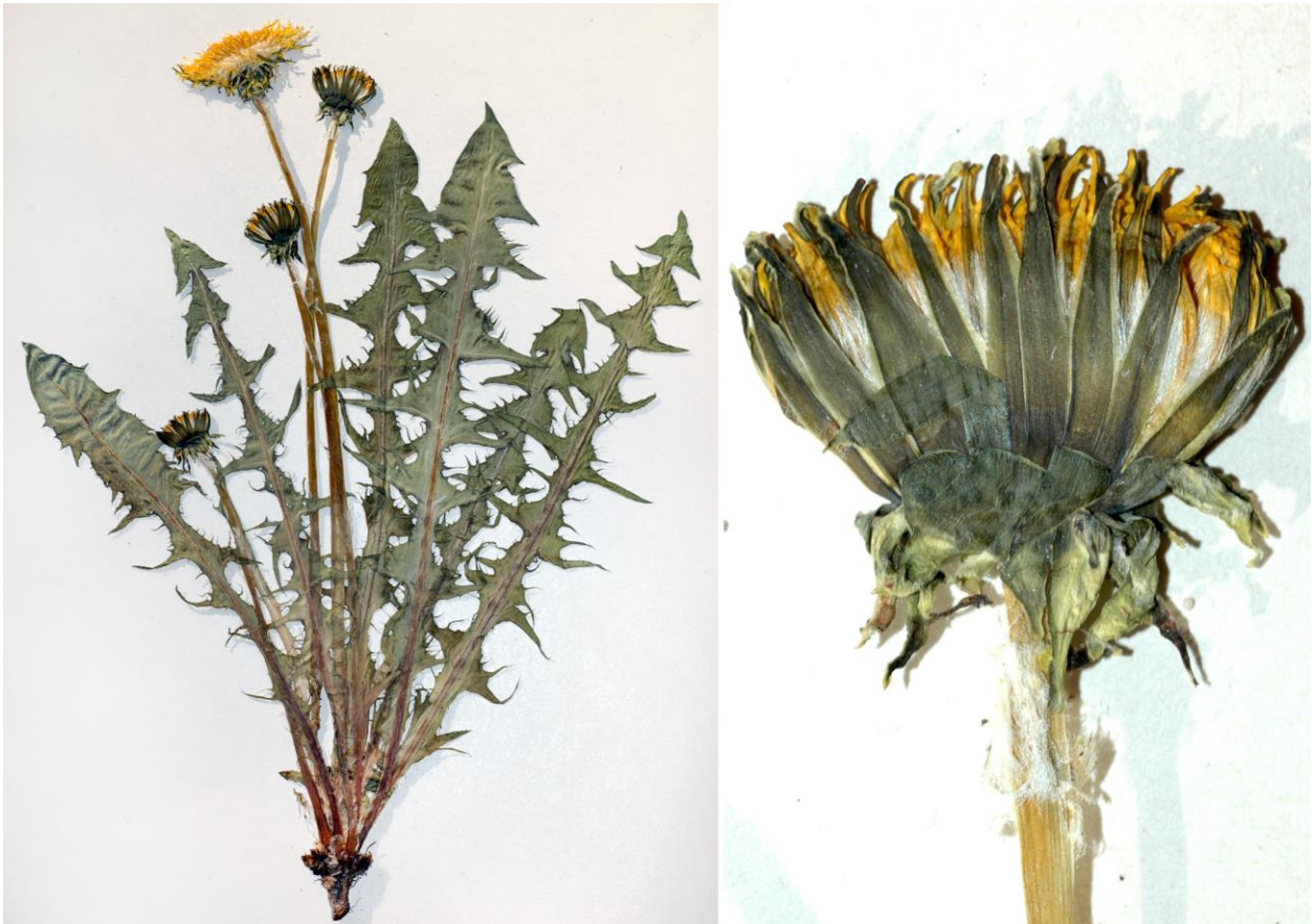
Abb. 36 Taraxacum uniforme