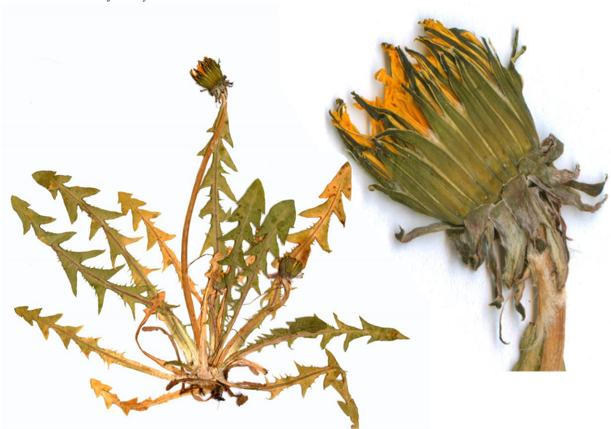
Abb. 12 Taraxacum floccosum