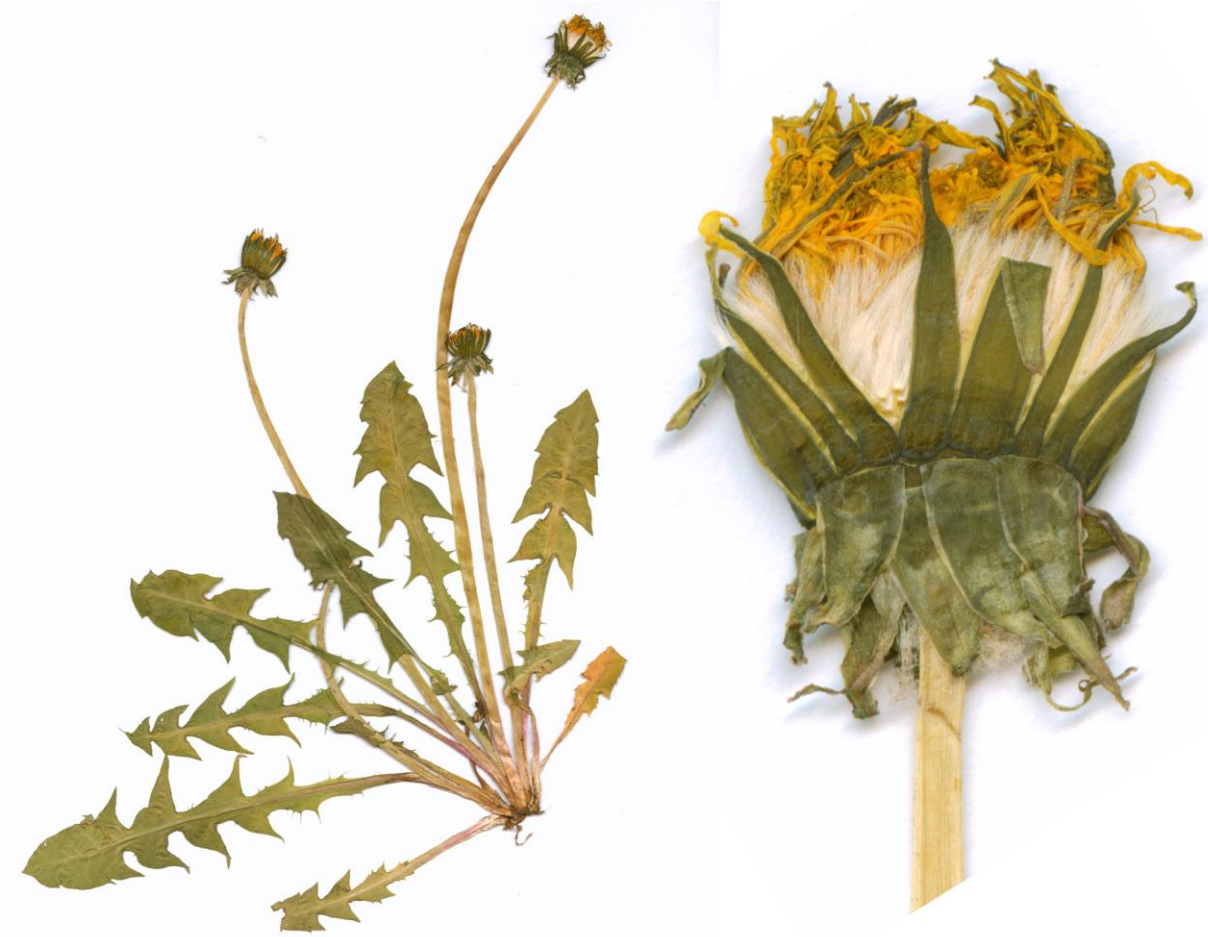
Abb. 31 Taraxacum retroflexum