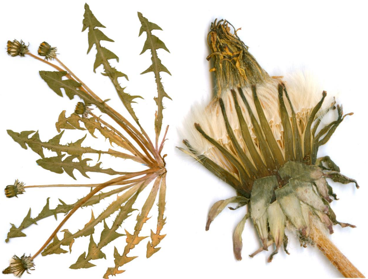
Abb. 30 Taraxacum pulverulentum