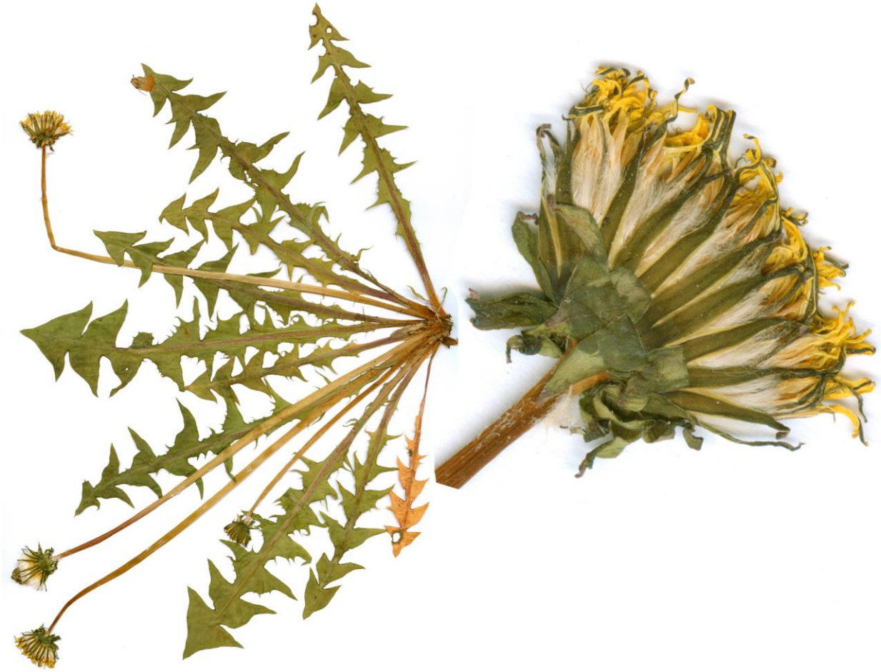
Abb. 23 Taraxacum lundense