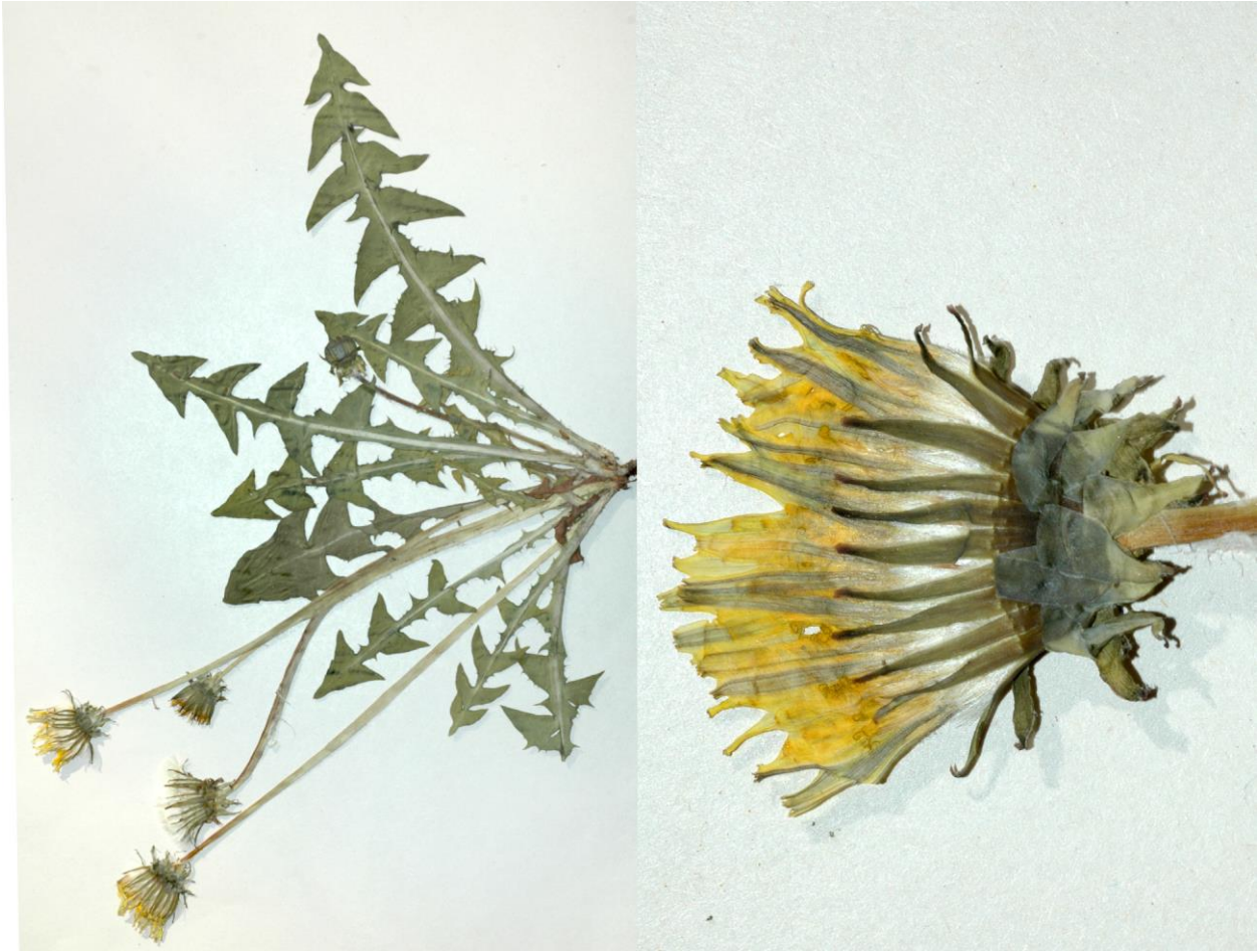
Abb. 27 Taraxacum pallidipes