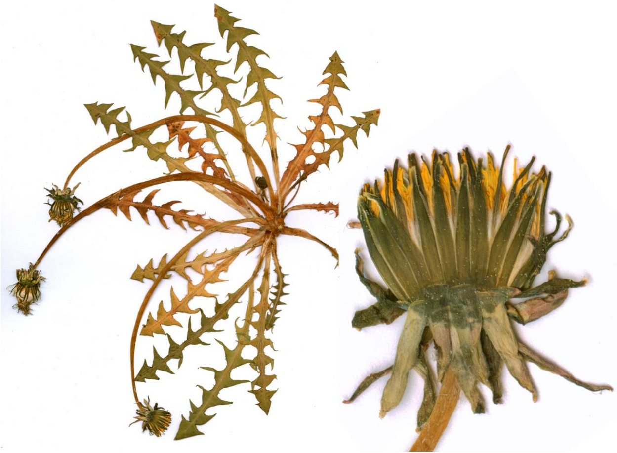
Abb. 11 Taraxacum flavostylum