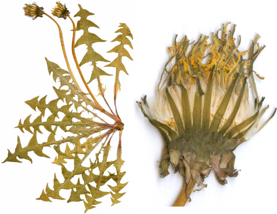
Abb. 29 Taraxacum pseudoretroflexum