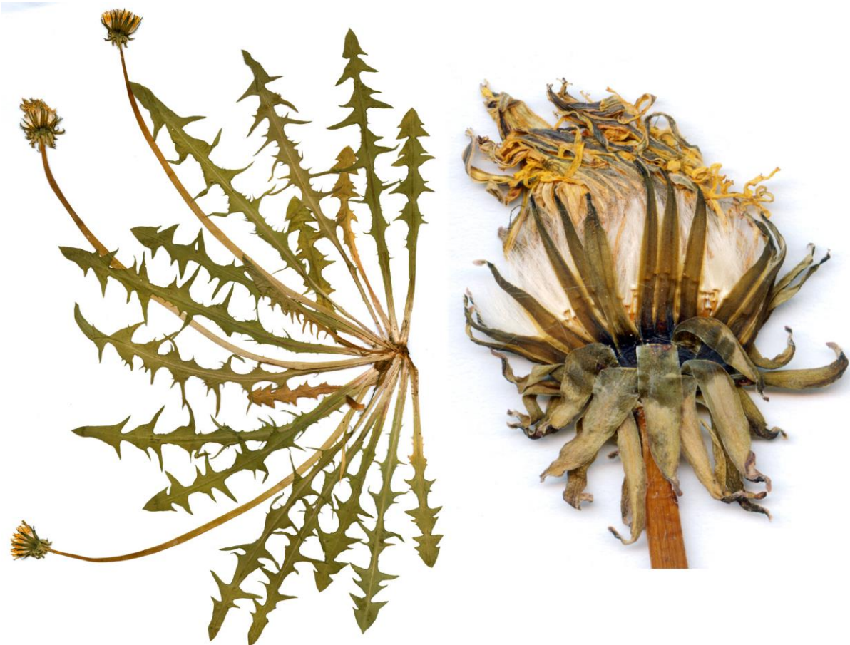
Abb. 8 Taraxacum breitfeldii