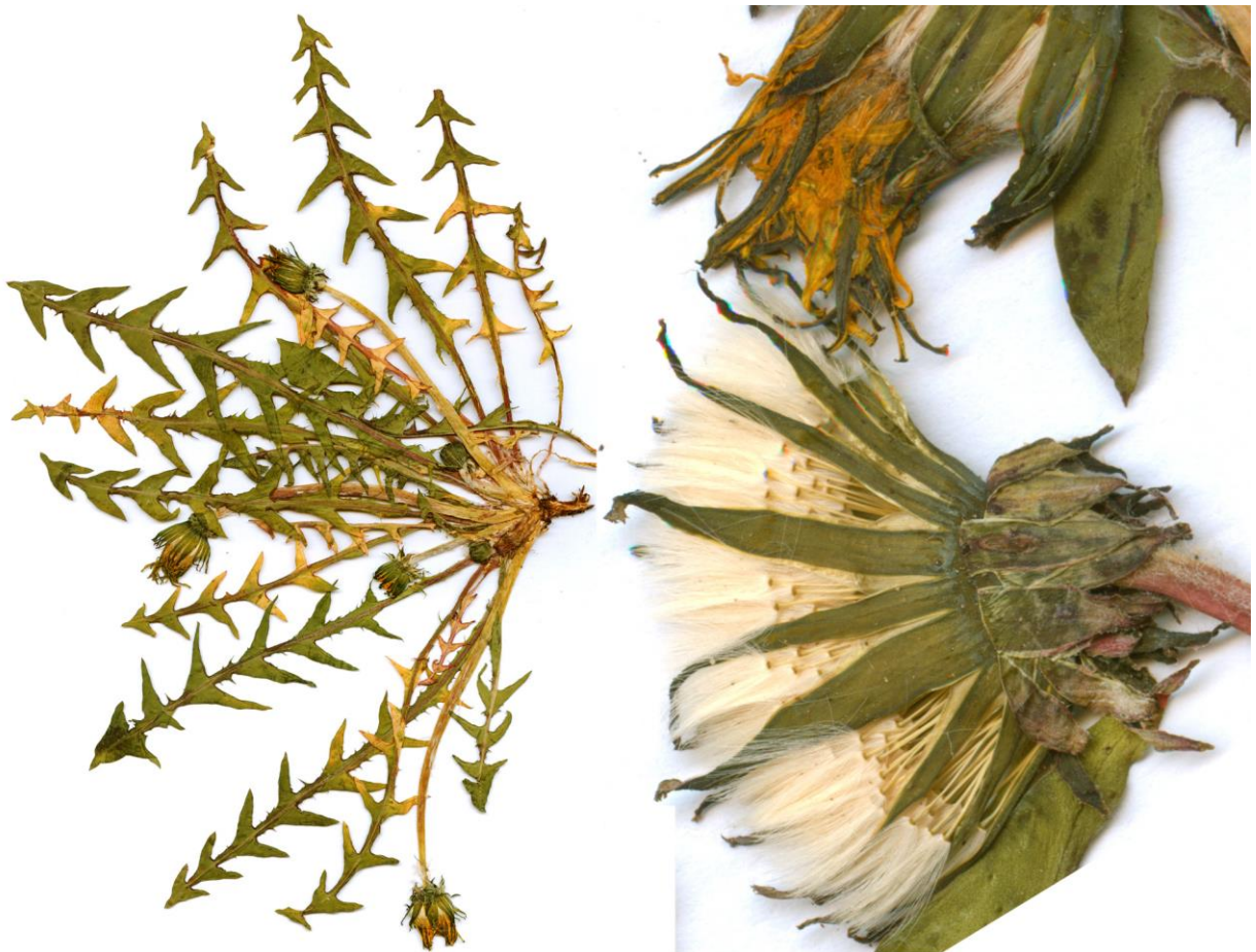
Abb. 4 Taraxacum spiculatum