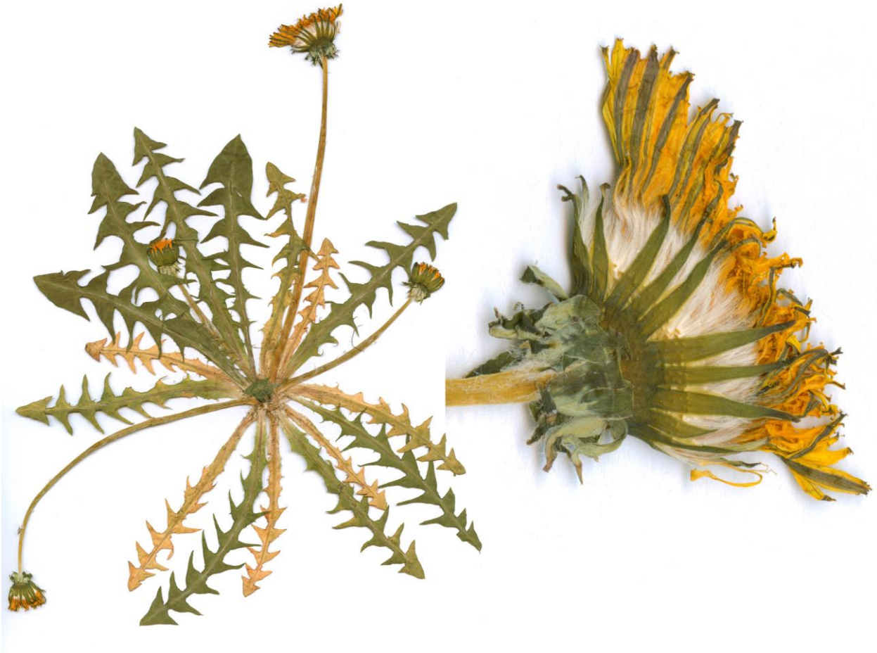
Abb. 17 Taraxacum homoschistum