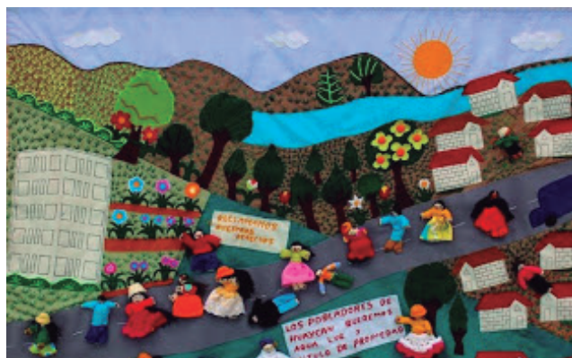
Figura 5 - Arpillera “Marcha por nuestros derechos”