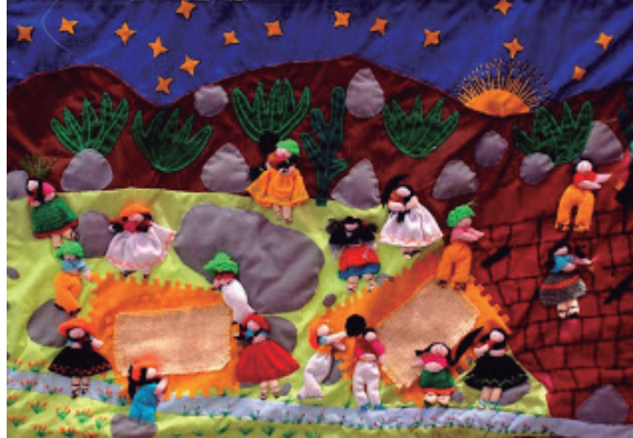
Figura 2 - Arpillera “Cuando llegamos a Huaycán”

Las mujeres cuentan que cuando llegaron a la localidad de Huaycán, a mediados de los ochenta y principios de los noventa, el trabajo fue arduo. Había muchas piedras grandes y el suelo era duro (Figura 2). Las ventajas del espacio, como otros que también fueron ‘invadidos’, es que se encontraban a la periferia de la ciudad, estaban deshabitados y, en algunos casos, ya se contaba con familia o persona conocida que podía ayudar con el asentamiento. Tuvieron que picar las piedras para habilitar el terreno. Asimismo, se ve como las personas cargan sus esteras para utilizarlas en la construcción de sus chozas.