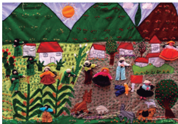
Figura 1 - Arpillera “Violencia en nuestras comunidades de origen”

En la primera arpillera (Figura 1) se contempla una escena común de los años ochenta en la zona andina del Perú. Se observan unos personajes enmascarados (terroristas a la derecha, militares en traje verde a la izquierda) y armados con pistolas que irrumpen en las comunidades y chacras para hostigar a los(as) habitantes e incluso matarlos(as) (hay un personaje tirado en el suelo). Entraban en las acequias y zonas de cultivo para abastecerse de alimentos. A pesar de esta escena violenta, se puede apreciar que los colores y demás elementos son vistosos. Se ven plantas, animales, árboles frutales, plantaciones de maíz, flores en los cerros verdes, viviendas, entre otros elementos. Son temas que contrastan, pero que da indicios de cómo recuerdan las mujeres el paisaje en sus respectivos lugares de origen. Las características de estas escenas recuerdan a los puntos claves extraídos de las entrevistas.