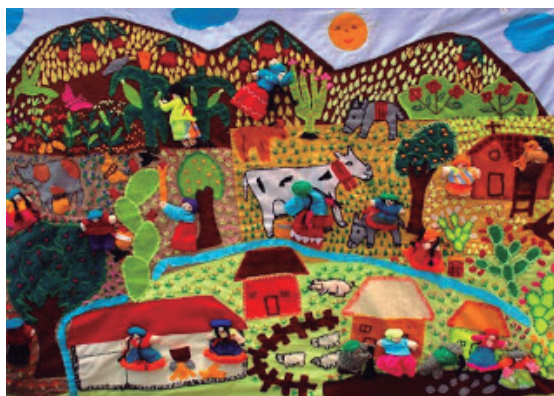
Figura 3 - Arpillera “Nuestros conocimientos”

En la tercera arpillera (Figura 3) se ha plasmado las memorias de la vida de las artesanas antes del conflicto armado; es decir, antes de los años ochenta, la cual se percibe como armónica. En el fondo se ven a unas mujeres cosechando maíz, a la derecha unos señores que arreglan el tejado de una casa, en el centro a una señora que ordeña una vaca, un grupo de señoras siembran papas y otras cocinan usando leña. Esta representación del paisaje, además de hablar de un modo de vida tranquilo, representa también la relación que guardan las comunidades con su territorio. Se percibe que han representado vegetación típica como la tuna ( Opuntia ficus-indica ), naranjales ( Citrus X sinensis ), limones ( Citrus × limón ), y otros frutales. El nombre que se le ha dado a la arpillera también es muy simbólico, ya que se valora aquellos conocimientos tradicionales y ancestrales que se aprehenden desde la interacción con el entorno.