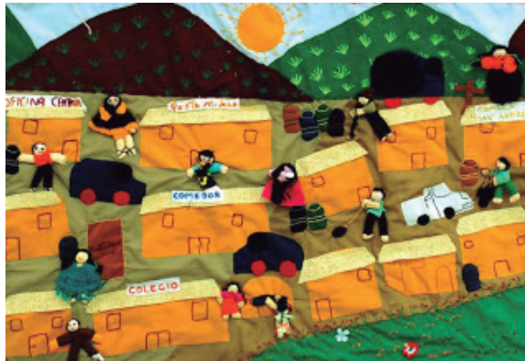
Figura 4 - Arpillera “Nuestro trabajo organizado en Huaycán”

Cada una de las pequeñas casas que se observan en la cuarta arpillera (Figura 4) representa un servicio que las personas fundadoras querían conseguir para su nuevo hogar, Huaycán. Hace referencia entonces a los años posteriores al 2000, cuando fueron encarcelados los principales responsables de la violencia política, que había marcado el contexto de los desplazamientos. Entre los servicios priorizados se encontraba el educativo (escuelas y colegios), alimenticio (comedor popular), salud (posta médica) y administración pública (oficina central). La población se organizaba para hacer limpieza comunal y remover las piedras que impedían la construcción de estas nuevas infraestructuras, así como el paso del aguatero (persona que acarrea el agua y la distribuía en los hogares). Atrás se empieza a ver como la ocupación de la zona está degradando la vegetación de los cerros, haciendo que se vean marrones, aunque aún se conservaba cierto verdor.