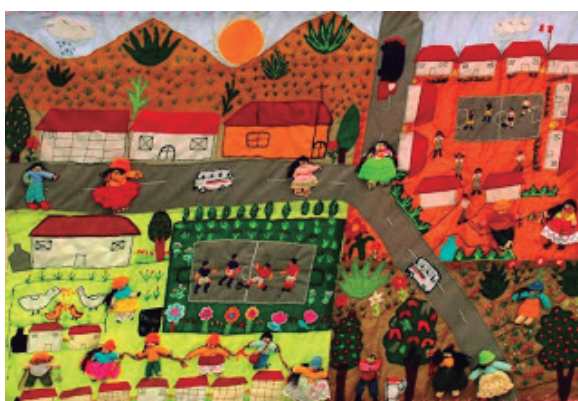
Figura 7 - Arpillera “El futuro que construiremos en Huaycán”