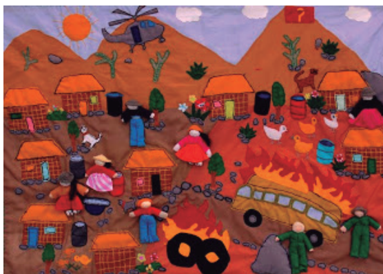
Figura 6 - Arpillera “Violencia en Huaycán”

Se pueden ver las chozas de estera y los cilindros con agua que había al principio de la ocupación del territorio en la periferia este de Lima (Figura 6). Sin embargo, este proceso no fue pacífico y había mucha violencia en el Huaycán de los años noventa. Los pobladores incendiaban vehículos y neumáticos en las calles. También, se colocaban piedras en las vías para impedir el acceso de otros transportes. Se conformaron Comités de Autodefensa para protegerse de posibles senderistas 3 . Las personas desplazadas no tenían otro espacio para vivir, así que tuvieron que soportar la violencia que encontraron en el nuevo lugar, a pesar de que justamente migraban para escapar de ella, “¿A dónde vamos a vivir? ¿Qué vamos a hacer? Quedarnos ahí, si nos matan, nos matarán ¿qué podemos hacer?” (Felicita Loayza en Bernedo, 2011).