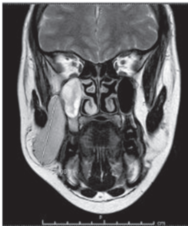
Figura 1. Imagen TC con medio contraste, se observa colección en región pterigomandibular derecha

Paciente hombre de 26 años de edad, estudiante. Sin antecedentes mórbidos ni alergias, con hábitos de consumo de marihuana y cocaína de forma ocasional. Ingresó al servicio de urgencias del Hospital San José (HSJ) por aumento de volumen en la región perimandibular derecha. Refiere trismus, dolor 5/10 en escala EVA y sensación febril. Al examen físico general presenta fiebre de 39 °C, nódulos linfáticos submandibulares palpables y compromiso del estado general. El examen físico segmentario constata limitación en la dinámica mandibular y aumento de volumen submandibular. Al examen intraoral se observa alveolo de diente 4.7 en proceso de cicatrización, diente 4.8 con capuchón pericoronario eritematoso y exudado purulento, dolor a la palpación en espacio pterigomandibular derecho, fondo de vestibulo y piso de boca sin compromiso infeccioso. La tomografía computarizada (TC) con contraste presenta espacio laterofaríngeo derecho levemente desplazado, área hipodensa en espacio pterigomandibular e infratemporal derecho (Figura 1). Sin evidencia de espacios abscedados. Paciente tomó conocimiento del caso y firmó consentimiento del tratamiento propuesto y el registro de su caso clínico.