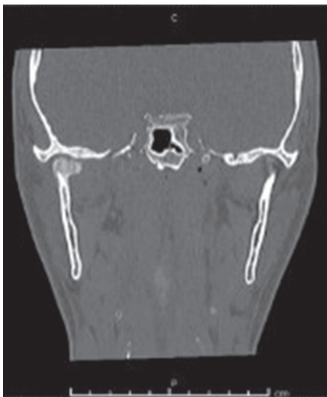
Figura 4. Imagen TC control 3 meses. Se observa signos de reparación ósea en cortical de cabeza de cóndilo derecho

Una complicación es que la sintomatología inicial de la artritis séptica se podría confundir con otras alteraciones de la ATM como degeneración interna, condromatosis sinovial o artritis reumatoide. Muchas veces los cambios en el hueso no se observan hasta que el proceso ya está en su fase más aguda, por lo cual, es importante el estudio