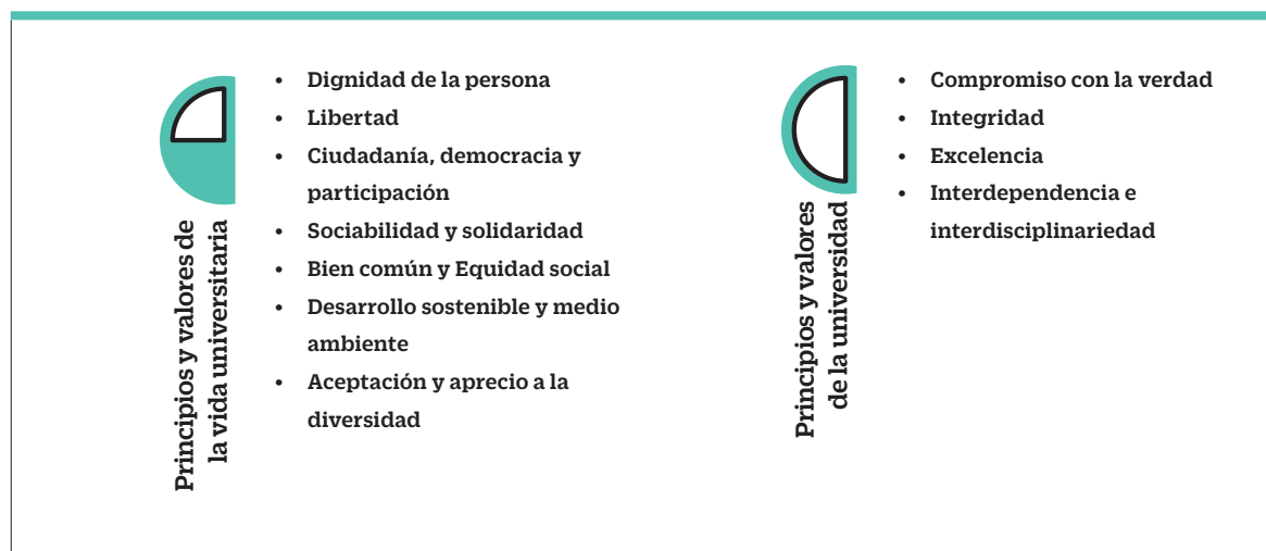
Figura 1. Principios y valores Proyecto Universidad Construye País, elaboración propia, basado en Jiménez (2008).

Sin embargo, Vallaes (2018) afirma que el compromiso ético de la universidad es una de las diez