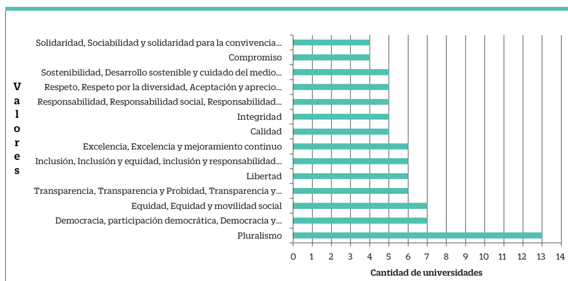
Figura 3. Distribución de universidades estatales chilenas según valores institucionales, elaboración propia.