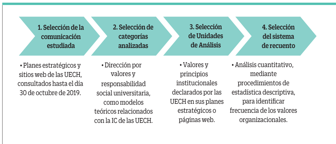
Figura 2. Procedimiento aplicación del análisis de contenido, elaboración propia, basado en Piñuel (2002).

(Gaete, 2015; Gil, 2012; Mendoza-Fernández et al., 2015; Núñez, Alonso, & Pontones, 2015).