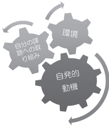
図3 エクステンションプログラム受講による作用

いという強い動機（本講座では自分の英語発音を向上させたいということ）を既に持ち得て参加していたことなどである。つまりエクステンションプログラム受講に際しては「自発的動機」が動力となり、受講という「取り組み」を得て、自らの置かれた「環境」に学んだことを還元していく仕組みを得て生涯学習が発動する（図3）。この「自発的動機」「取組」「環境」は3つの歯車となり、かみ合い方や動く方向により、受講