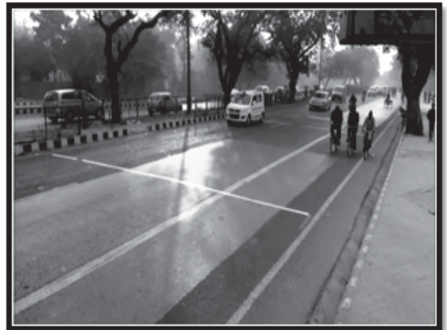
चित्र 2 – (ए और बी) स्थान ए और बी में एकत्र किए गए वीडियो डेटा का स्नेपशॉट