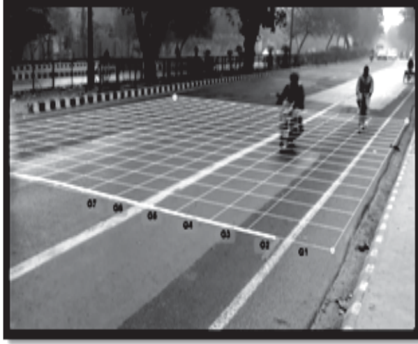
चित्र 3 – 0.5 मीटर की दूरी पर वस्तुतः चिह्नित लाइनें