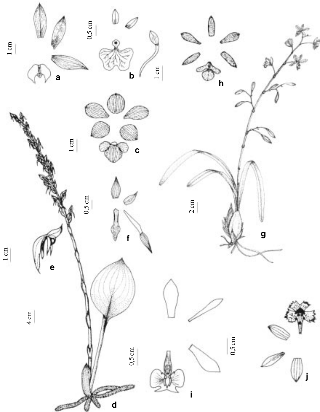
Figura 1. a. Catasetum cernuum ; b. Comparettia coccinea ; c. Cyrtopodium cardiochilum ; d-f Eltroplectris janeirensis ; g-h. Encyclia patens ; i. Epidendrum densiflorum ; j. E. secundum .