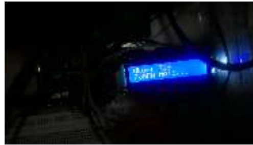
Gambar. 6 Kelembaban Tanah 369

Kelembaban tanah terbaca 345 di anggap basah maka pompa mati