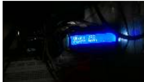
Gambar. 7 Kelembaban Tanah 382

Kelembaban tanah 423 di anggap basah maka pompa mati