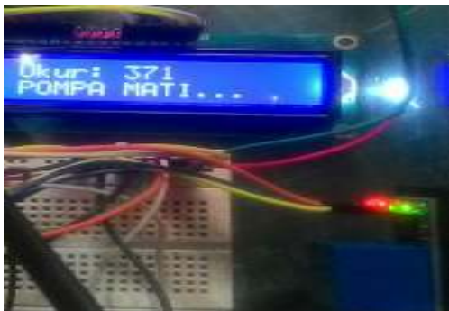
Gambar. 8 Lampu LED Relay

Lampu LED pada Relay hanya menyala yang berwarna merah saja maka pompa akan hidup.