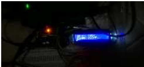
Gambar. 3 Kelembaban tanah 1007

Kelembaban tanah terbaca 1003 tanah di anggap kering pompa menyiram tanaman cabai