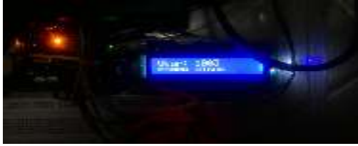
Gambar .2 Nilai Kelembaban 1003

sensor kelembaban tanah sehingga dapat dilihat hasil nilai kelembaban tanah pada saat pompa menyala dan saat pompa mati