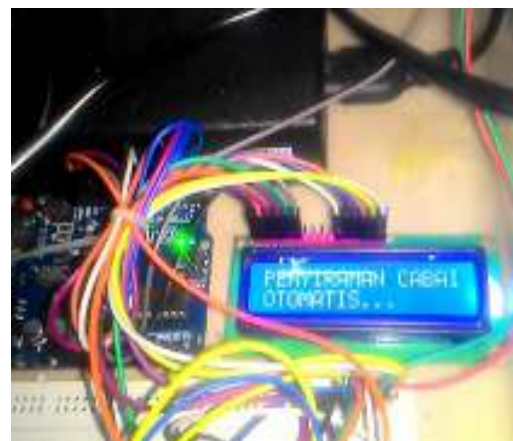
Gambar. 1 Pengujian LCD

Pengujian LCD 16x2 di lakukan dengan tujuan untuk mendapatkan parameter berupa tampilan karakter pada LCD sesuai dengan keinginan pengujian dilakukan dengan pemrograman karakter atau tulisan yang ingin di tampilkan pada LCD tersebut.