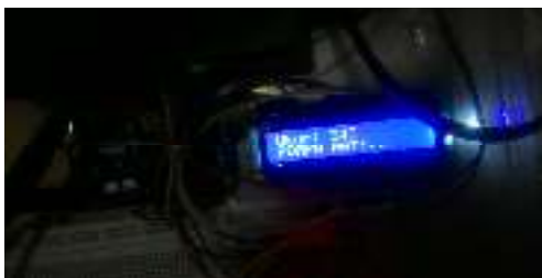
Gambar. 5 Kelembaban Tanah 345

Kelembaban tanah terbaca 1013 di anggap kering maka pompa menyiram tanaman cabai