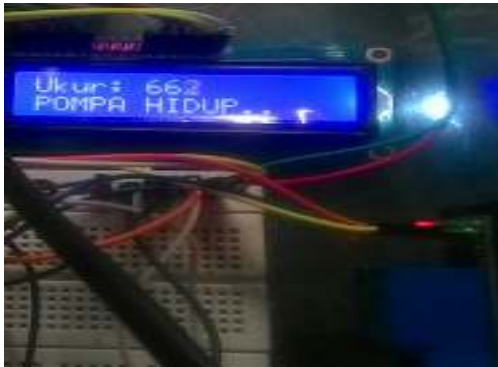
Gambar. 7 Lampu LED Relay

menyala hijau/merah dan bisa di lihat pada gambar dan dibawah ini.