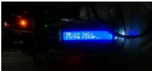
Gambar. 4 Kelembaban tanah 1013

Kelembaban 1007 tanah di anggap kering pompa menyiram tanaman cabai