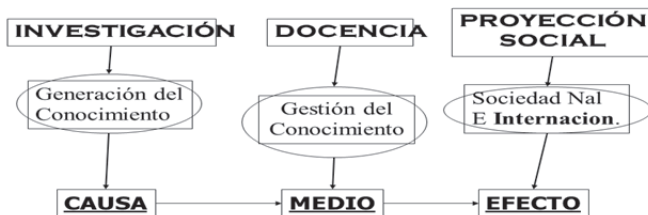
Gráfico 2. Modelo orientador de procesos Facultad de Psicología. (2003).

éxito, orientaron el modelo de procesos de los aspectos misionales de la Universidad. Este modelo de gestión de procesos permite desde los principios orientadores de la Universidad cambiar la tradicional concepción que la docencia tiene la mayor parte de la responsabilidad dentro de los programas de formación profesional, y la proyección social la de menor relevancia. Dado que la universidad, es un centro de conocimientos, supone su generación, en consecuencia, los nuevos conocimientos solo serán válidos si se logran a través de la Investigación; la pertinencia de los nuevos conocimientos tienen sentido en la medida que se les atribuyan una validación social y a la docencia que antes daba sentido a la academia, se convierte la disculpa gestionaora de los aprendizajes escolares. En términos de causa – efecto, se necesita investigar para poder impactar.