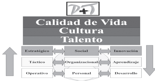
Gráfico 4. Modelo de Redes. (2003)