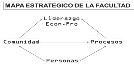
Gráfico 3. Mapa estratégico de la Facultad de Psicología. (2003).

del liderazgo personal, organizacional y profesional de la comunidad educativa (Gráfico 3).