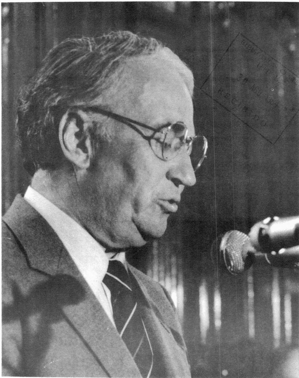
Doctor Belisario Betancur Cuartas Presidente de Colombia 1982 – 1986

Egresado de Nuestra Facultad de Derecho y Ciencias Políticas Universidad Pontificia Bolivariana Medellín, Colombia