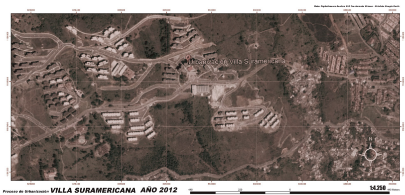
Figura 3. Villa Suramericana y alrededores (2012).