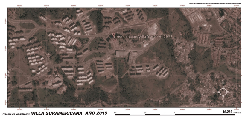
Figura 4. Villa Suramericana y alrededores (2015).