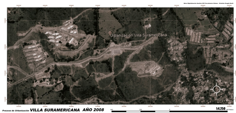
Figura 2. Villa Suramericana (2008).

unidades para inicios de la primera década del siglo XXI (Comfama, 2010, p. 21). Dentro de este proceso, fue construida la Villa Suramericana, un conjunto de apartamentos ubicado en el barrio Nuevo Occidente del corregimiento de San Cristóbal de Medellín (figuras 2, 3 y 4). Un antecedente importante de este hecho fueron los Juegos Centroamericanos y del Caribe, realizados en Medellín en 1978, cuya villa deportiva sirvió para desarrollar lo que hoy se conoce como la Unidad Residencial Tricentenario.