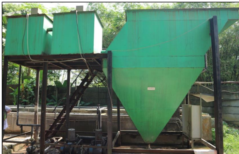
Gambar 2. Lamella di RPH X (Dokumentasi: Hasil observasi, 2017).

Berdasarkan Tabel 6, dapat dilihat bahwa status mutu air pada outlet IPAL termasuk ke dalam kategori Kelas A yang berarti bahwa kualitas air outlet IPAL baik sekali atau telah memenuhi baku mutu.