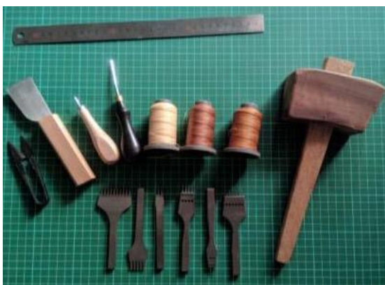
Gambar 14. Alat Produksi Jahit Tangan