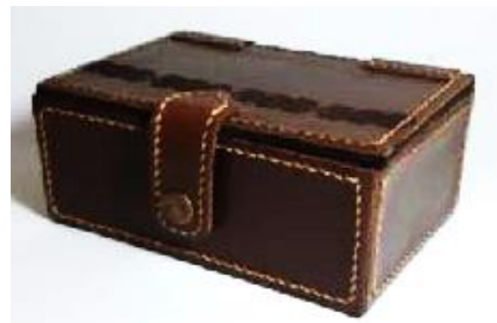
Gambar 26. Kemasan Model 5