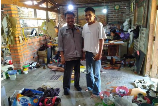
Gambar 6. Kunjungan ke Industri Kerajinan Tas “D’War” di Kabupaten Magetan

seperti ukuran limbah, tekstur, warna, dan kelembasan kulit ( softness ).