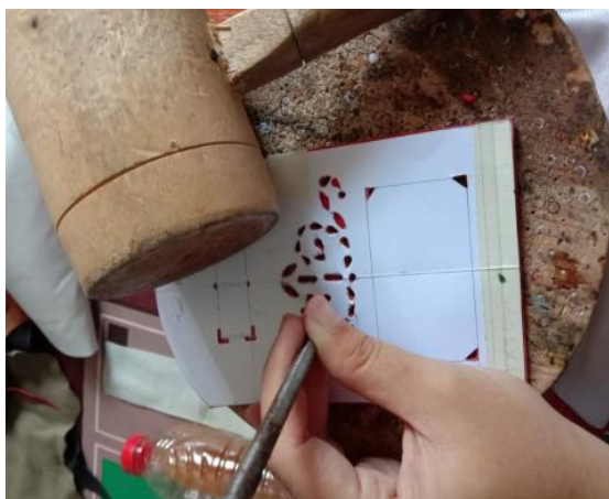
Gambar 19. Proses Menghias Kulit dengan Komposisi Lubang

Kulit yang telah dipotong pada bagian tertentu diberi hiasan, salah satunya hiasan komposisi lubang. Proses menghias dengan bentuk-bentuk lubang dilakukan setelah proses potong. Alat yang digunakan untuk membuat lubang adalah punching . Operasional penggunaan alat ini dilakukan secara manual, yaitu dipukul dengan palu yang pada bagian daging (dalam) diletakkan pada landasan kayu.