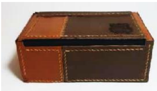
Gambar 29. Kemasan Model 8