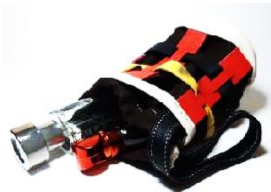
Gambar 23. Kemasan Model 2