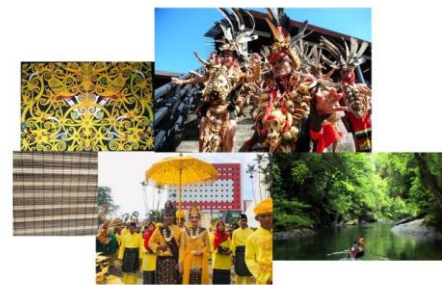
Gambar 13. Visualisasi Kalimantan Barat