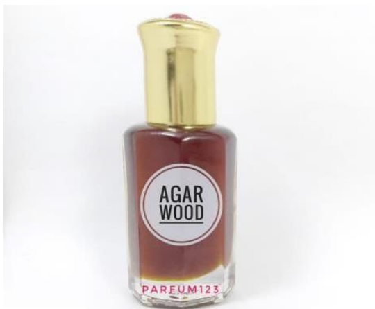
Gambar 3. Botol Minyak Parfum Kayu Gaharu

Beberapa konsumen kayu gaharu sering menyimpan serpihan ( chip ) untuk dinikmati aroma wanginya. Sifat kayu gaharu seperti kayu cendana yang mengeluarkan aroma wangi dalam jangka waktu relatif lama. Kegunaan lain adalah bahan campuran dupa yang dibuat serbuk dan dicetak berbentuk silinder kecil menyerupai lidi. Kayu ini juga sering diambil minyaknya untuk essential oil yang sering digunakan sebagai bahan dasar obat, kosmetik, dan parfum. Harga minyak kayu gaharu yang dijual CV Global Agarwood Station mulai dari Rp300.000, 00 - Rp500.000, 00 per 50 ml.