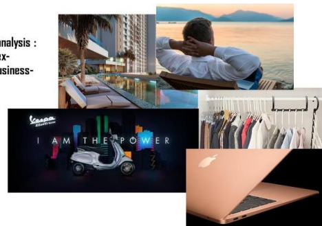
Gambar 12. Visualisasi Prediksi Konsumen Produk Olahan Kayu Gaharu

consumer analysis : urban-unisex- middleup-business- officer