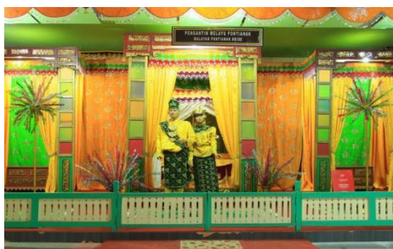
Gambar 10. Kebudayaan Melayu Kalimantan Barat