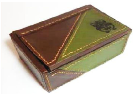
Gambar 30. Kemasan