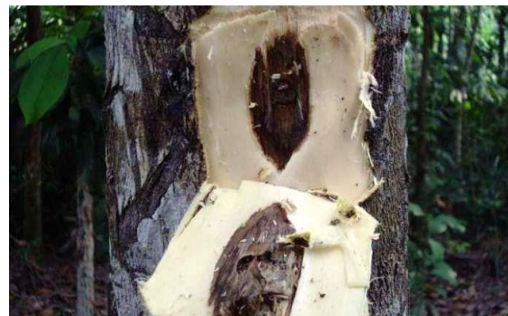
Gambar 1. Kayu Gaharu

Kayu gaharu merupakan hasil reaksi tanaman terhadap mikroba yang masuk ke dalam batang kayu. Reaksi ini menghasilkan sejenis resin yang memiliki ciri khas pada baunya. Resin ini diambil sebagai bahan dasar kosmetik dan parfum yang disukai sejak zaman dahulu. Bahan kayu gaharu ini berwarna gelap, seperti kehitaman atau kecoklatan.