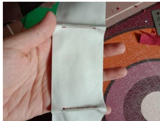
Gambar 20. Proses Perakitan Tepung/Gusset

Jenis jahitan yang digunakan adalah jahitan dengan jenis single needle dan jarak antarjahitan 2-3 mm per stitch . Model jahitan ini termasuk jenis moderat yang mudah diaplikasikan pada produk-produk kasual. Jenis kaitan benang jahit adalah jahit chain stitch yang termasuk jahitan sederhana tetapi cukup kuat untuk menjaga kaitan benang.