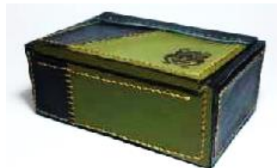
Gambar 27. Kemasan Model 6