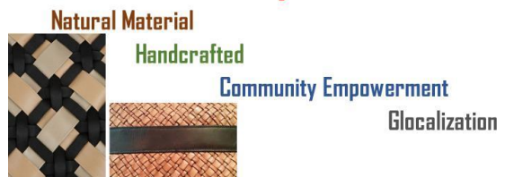
Gambar 8. Trend Forecasting Keyword

Elemen lokal diangkat dari kebudayaan Melayu dan Dayak yang tumbuh di Kalimantan Barat. Alasan kuat pengambilan elemen ini adalah produk olahan kayu gaharu berasal daerah kawasan tersebut. Kebudayaan yang berkembang di Kalimantan Barat didominasi oleh kebudayaan-kebudayaan yang berasal dari beberapa suku, seperti Dayak dan Melayu. Kebudayaan ini secara harmonis telah berdampingan dalam kurun waktu lama. Kekayaan budaya ini diaplikasikan dalam penyusunan konsep perancangan.