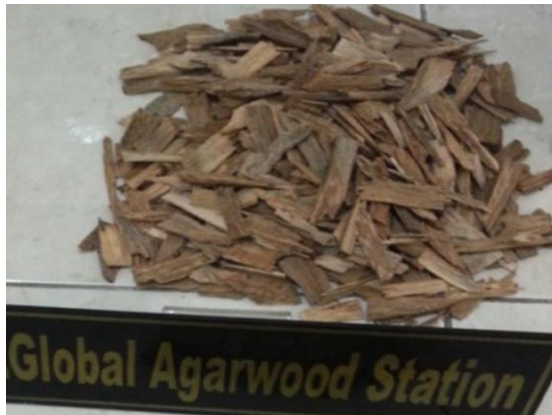
Gambar 2. Serpihan Kayu Gaharu

Rp2.000.000, 00 – Rp 15.000.000, 00 per kilogram.