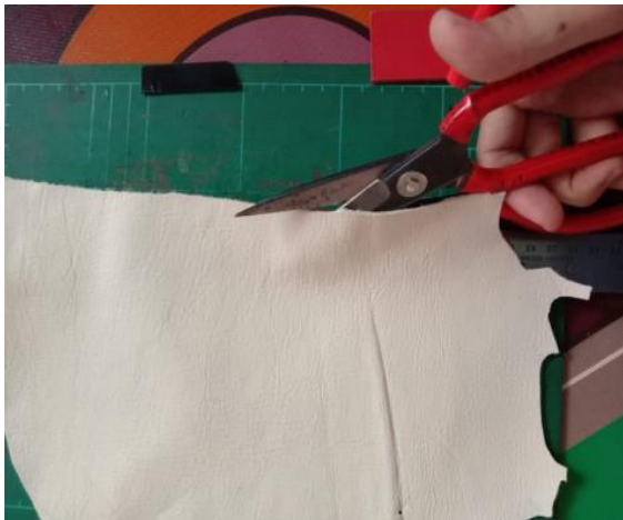
Gambar 18. Pemotongan Kulit

Proses pemotongan dilakukan setelah proses pemolaan dan pemeriksaan ulang selesai. Proses pemotongan dilakukan dengan hati-hati agar diperoleh hasil potongan dengan ketepatan tinggi. Proses ini memengaruhi kemudahan proses penjahitan.