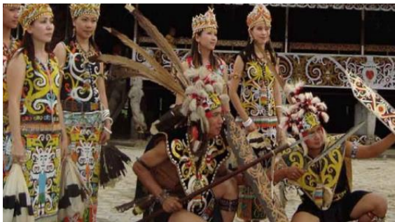
Gambar 9. Masyarakat Adat Suku Dayak di Kalimantan Barat