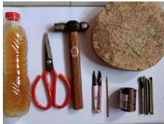
Gambar 15. Alat Pelubang Dekorasi Kulit

Pemolaan dilakukan dengan memindahkan luasan bidang dari pola ke kulit. Kaidah pemolaan memperhatikan efisiensi dan menghindari defek-defek kulit. Arah kemuluran dan ketegangan kulit dapat diabaikan karena kemasan ini tidak mengalami tekanan dan tarikan saat pengoperasiannya.