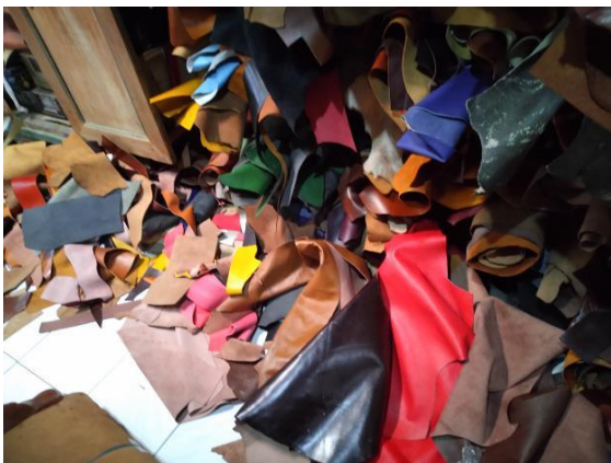
Gambar 7. Limbah Kulit Samak Krom