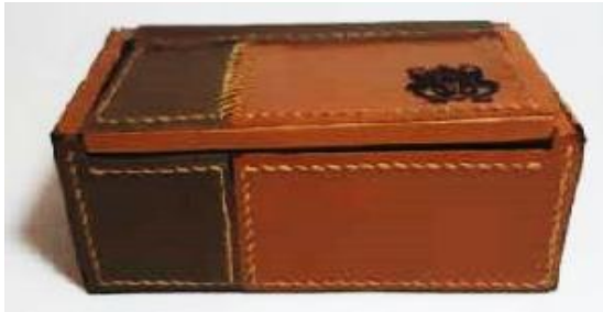
Gambar 28. Kemasan Model 7