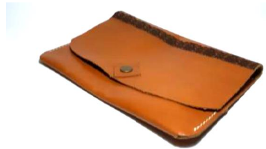
Gambar 24. Kemasan Model 3