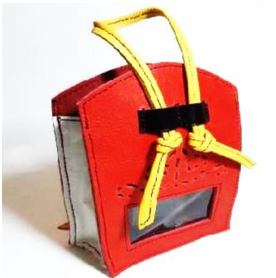
Gambar 22. Kemasan Model 1

Hasil perwujudan dalam bentuk produk kemasan bahan kulit limbah untuk produk olahan kayu gaharu dapat dilihat pada gambar-gambar di bawah ini.