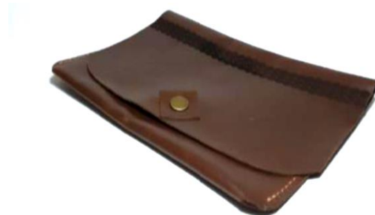
Gambar 25. Kemasan Model 4