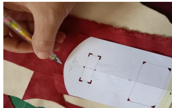
Gambar 16. Proses Pemolaan Outline

Pemolaan dilakukan dengan memindahkan luasan bidang dari pola ke kulit. Kaidah pemolaan memperhatikan efisiensi dan menghindari defek-defek kulit. Arah kemuluran dan ketegangan kulit dapat diabaikan karena kemasan ini tidak mengalami tekanan dan tarikan saat pengoperasiannya.