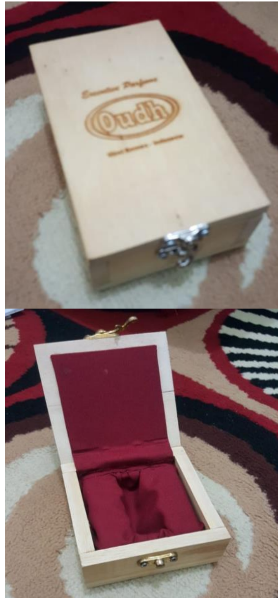
Gambar 4. Kemasan Kayu CV Global Agarwood Station

Saat ini kemasan yang sudah digunakan untuk mengemas produk olahan kayu gaharu terbuat dari kayu berbentuk kotak dengan berbagai macam ukuran.