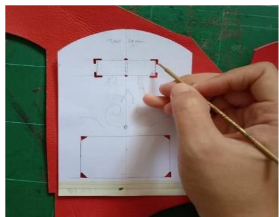
Gambar 17. Proses Pemolaan Marking