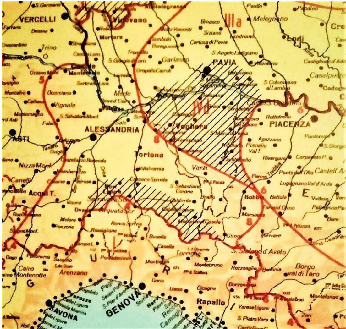
Figura 1. L’area delle Quattro Province nella Carta dei Dialetti Italiani (Pellegrini, 1977). Varzi si trova al centro dell’immagine. IIIa è la sigla per il lombardo occidentale, IVd indica invece l’area di transizione vogherese-pavese del gruppo emiliano (area tratteggiata).

Un'altra dimostrazione del carattere conservativo del varzese è l'epentesi di [g] al posto di D (primario o secondario) caduto tra vocali. Secondo Salvioni, già in età medievale il pavese si differenziava dalle parlate alessandrino-monferrine soprattutto per questo tratto (1902: 18) 15 , e il varzese è oggi l'unico dialetto dell'Oltrepò a presentare esiti come RŌTA