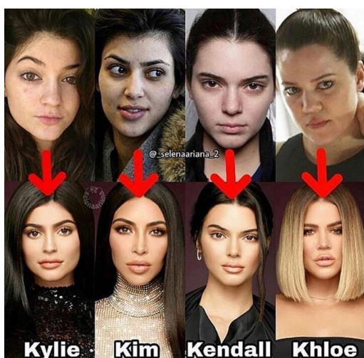
3. Kim Kardashian a její sestry, kde vidíme před a po estetických zákrocích.