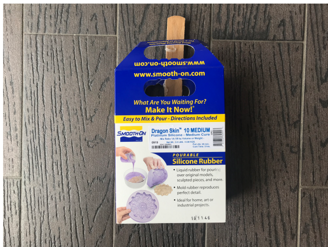
7. Silikon pro tvorbu SXF