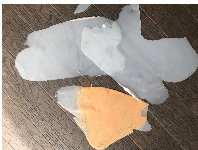
8. Silikon po aplikaci na modelce