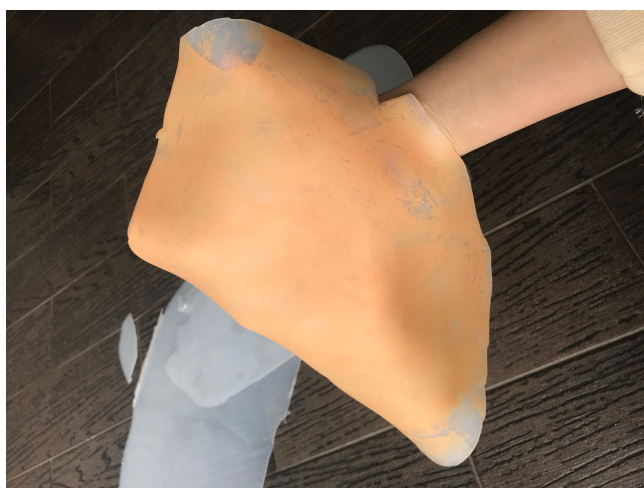
9. Detail silikonu po aplikaci