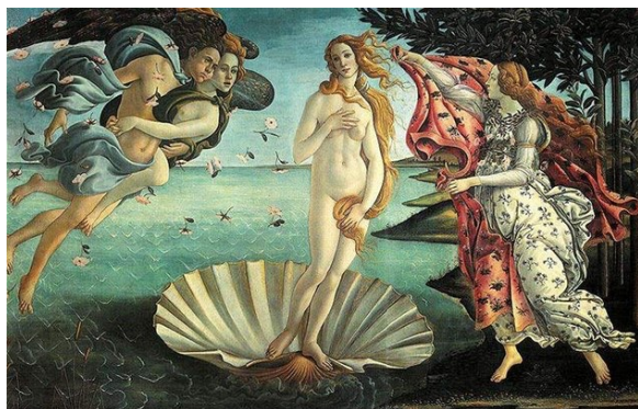
1. Obraz Zrození Venuše, Sandro Botticelli