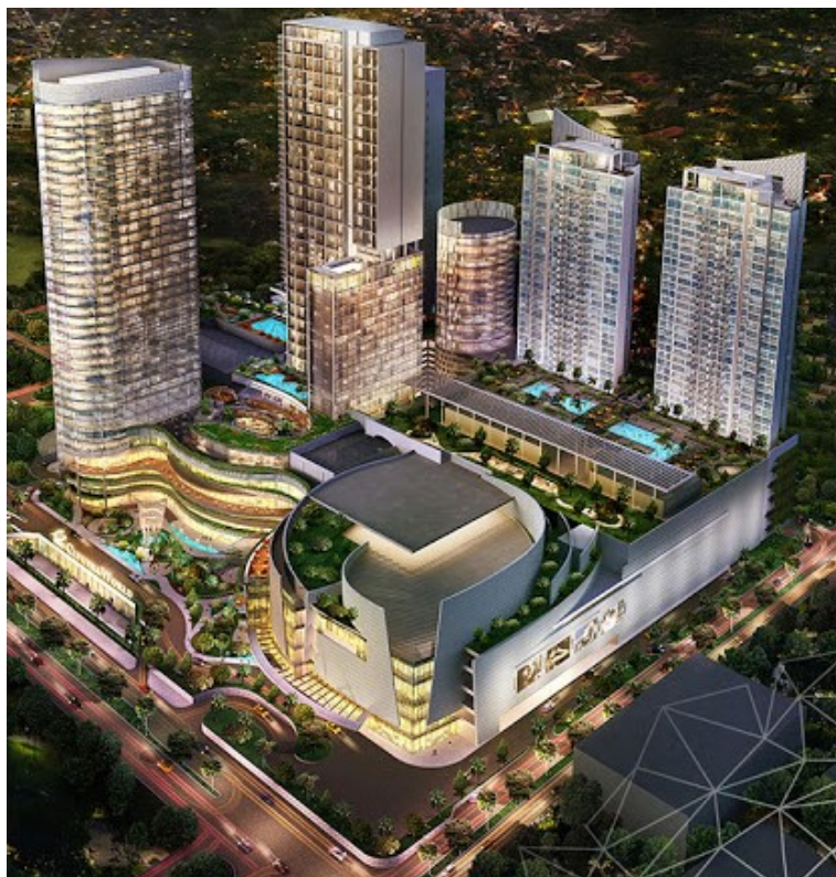
Gambar 2. Ciputra World Surabaya Mall

Centre pada Ground Floor , kemudian terdapat pula baby's room yang disediakan bagi ibu yang menyusui yang terdapat di VIP toilet lantai LG, serta VIP toilet di lantai satu hingga lantai tiga gedung mall (Ciputra World Surabaya, 2011).