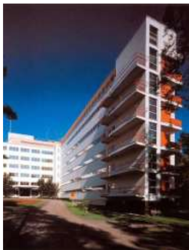
Gambar 1. Tuberculosis Sanatorium (Arsitek - Alvar Aalto)

terhadap pengalaman mistis. Hal itu sejalan dengan perkembangan arsitektur Klasik Eropa mulai dari zaman Barock hingga sebelum arsitektur modern dimulai, dengan pengalaman arsitektur yang berorientasi pada nilai – nilai ketuhanan, yang direpresentasikan dengan elemen – elemen vertikal yang dominan pada saat itu, hingga dengan kehadiran cahaya diantara ruang gelap.