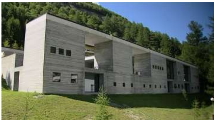
Gambar 3. Eksterior Bangunan Thermal Baths

Seperti yang dikatakan dalam bukunya Thinking Architecture bahwa terdapat suatu kekuatan dalam hal – hal biasa di kehidupan sehari – hari, (Zumthor 1988:17) Pengalaman arsitektur yang muncul dalam karya Peter Zumthor merupakan kesatuan pengalaman sensoris sehari - hari yang didapatkan dari pengalaman masa kecilnya ketika mengunjungi rumah bibinya.