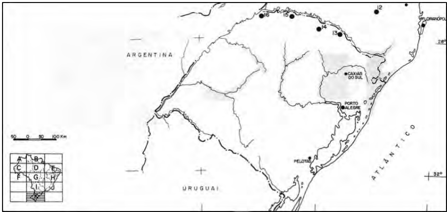
Mapa 1. 13.Nonoai; 14.Guarita; 15.Ligeiro; 16.Cacique Doble. Rio Grande do Sul, Brasil, 1944. Mapa dos Postos Indígenas do Rio Grande do Sul em 1944 produzido pelo Serviço de Proteção aos Índios. Publicado em Lima, Antônio Carlos de Souza. As órbitas do sítio: subsídios ao estudo da política indigenista no Brasil, 1910–1967 . Rio de Janeiro: Contra Capa; LACED/Museu Nacional/UFRJ, 2009.

de arrendamentos, a explorar ainda mais o trabalho indígena e a permitir a invasão cada vez maior de fazendeiros nas terras Kaingang. «A sua presença consolidou um novo processo de exploração da mão-de-obra indígena, dos recursos naturais e de usurpação de posse, o qual se efetivou via instituição da exploração agrícola (“roças do posto”), pela comercialização das madeiras nobres existentes na área, e ante a instauração do sistema de arrendamentos das terras». 37