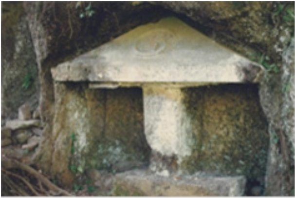
Gambar 11. Bangunan bertiang satu 1.

tengahnya dipahatkan tiang dengan ukuran sekitar 30 x 30 cm, tinggi sekitar 125 cm dan di atas tiang ini dipahatkan atap dengan konstruksi limasan. Keistimewaan bangunan ini adalah adanya tulisan (huruf) yang menempel pada atap bangunan. Tulisan (huruf) tersebut diidentifikasi sebagai tipe huruf Kadiri Kwadrat, yang berdasarkan hasil pembacaan beberapa orang pakar berbunyi “Sri” yang diduga huruf ini berasal dari abad ke-11 Masehi. Kata Sri di pahami memiliki banyak makna, seperti Sri dapat berarti kesuburan dalam kaitan dengan Dewi Sri , atau dapat juga berarti nama depan atau gelar dari seorang raja seperti Sri Maharaja dan lainnya. Bangunan tiang satu ini, terlihat sangat sederhana dan tidak memiliki ornamen atau hiasan, sehingga sangat sulit untuk diketahui fungsinya pada masa yang lalu, apakah sebagai bangunan umum biasa saja atau merupakan bangunan suci pemujaan. Untuk sementara diduga sebagai bangunan profan karena tempatnya diluar komplek bangunan suci. Penelitian yang lebih intensif dan lebih mendalam terkait fungsinya, perlu dilakukan dimasa yang akan datang.