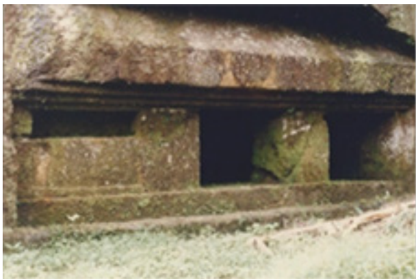
Gambar 5. Bangunan bertiang delapan ( sakatus ) satu bilik tertutup dengan satu lubang pintu dan dua lubang jendela.

Bangunan bertiang delapan ( sakatus ) ini, memiliki tiga bilik yaitu dua bilik terbuka dan satu bilik tertutup, pada prinsipnya memiliki denah yang sama dengan bangunan bertiang delapan dengan bilik terbuka. Perbedaannya adalah adanya bilik yang tertutup, dengan lubang pintu pada bagian tengah dan sebuah lubang jendela pada bagian samping bilik tersebut. Lubang jendela ini berfungsi sebagai tempat masuknya sinar yang menerangi bagian dalam bilik tersebut dan juga sebagai lubang sirkulasi udara, sehingga didalam ruangan terasa sejuk dan terang. Dengan demikian bangunan ini memiliki kelayakan untuk dijadikan tempat