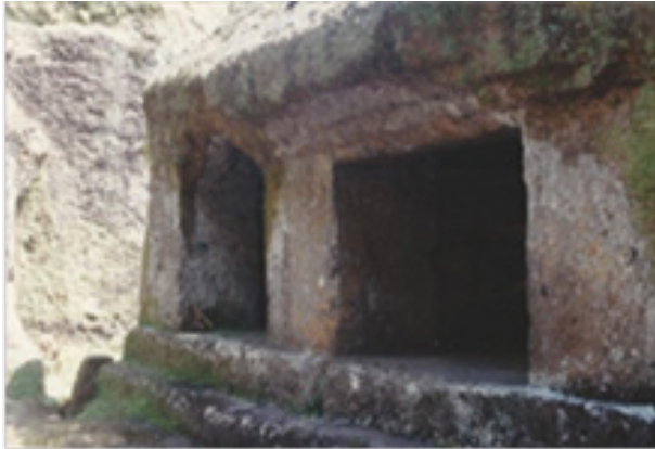
Gambar 7. Bangunan bertiang enam ( sakanem ) dengan dua bilik terbuka.

pintu dan penyekat, maka sinar dan udara dapat masuk dengan bebas. Dengan kondisi yang terbuka seperti ini, diduga bangunan bertiang enam ( sakanem ) ini dahulunya berfungsi sebagai bangunan tempat beristirahat, tempat bersemadi, tempat belajar dan lainnya.