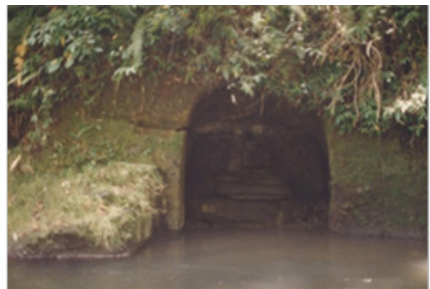
Gambar 4. Ceruk Pemujaan di Komplek Gunung Kawi, Tampak Siring.

Bangunan sakral/suci yang berupa ceruk pemujaan ini, terdapat di situs Gua Garbha, yang terletak disisi sebelah timur Sungai Pakerisan, dekat dengan permukaan air dan akan terendam apabila air sungai cukup besar. Permukaan ceruk berbentuk setengah lingkaran dengan tinggi sekitar 3 meter dan lebar 3 meter dan menjorok ke dalam sekitar 3 meter. Ceruk dipahat dengan cukup halus dengan permukaan yang sangat rapi dan ruang yang lega, dengan sinar dan udara yang cukup pada saat air surut. Pada bagian ujung ceruk (bagian yang paling dalam) terdapat pahatan datar dari batuan yang sama dengan ceruk, tetapi bagian ujung kirinya sudah rusak dan pecah. Di atas pahatan datar ini terdapat pula lapik arca yang memiliki hiasan/ukiran, tetapi kondisinya sudah sangat aus sehingga hiasan/ukirannya kelihatan tidak begitu jelas, tetapi samar-samar berbentuk padma ganda. Sangat disayangkan bahwa arca yang dahulunya berada di atas lapik arca ini sudah tidak diketahui asal usulnya. Dengan demikian tidak dapat diidentifikasi apakah arca tersebut mewakili agama Hindu atau Budha.