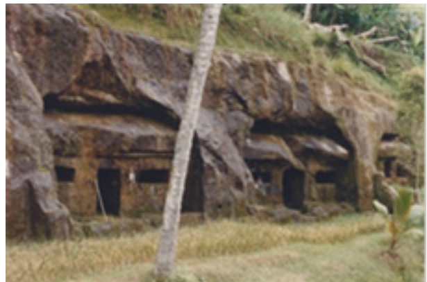
Gambar 6. Bangunan bertiang delapan ( sakatus ) tiga bilik, dua bilik terbuka, satu bilik tertutup dengan satu lubang pintu dan satu jendela semu.

Bangunan bertiang delapan ( sakatus ) dengan tiga bilik, dua bilik terbuka, satu bilik tertutup dengan lubang pintu dan satu jendela semu, selanjutnya diberi kode sub tipe B1.c. Pada dasarnya memiliki bentuk bangunan dan denah yang sama dengan bangunan tipe B1.b. Perbedaannya hanya terletak pada jendelanya saja, dimana pada bangunan ini tidak terdapat lubang jendela, tetapi terlihat pahatan yang