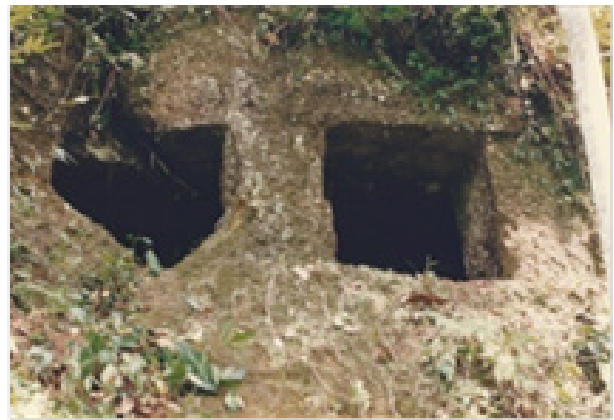
Gambar 8. Bangunan bertiang enam ( sakanem ) dua bilik dengan satu jendela besar.

Bangunan bertiang enam ( sakanem ) dua bilik dengan satu jendela besar ini adalah bangunan bertiang enam yang memiliki ukuran denah yang sama dengan bangunan sakanem lainnya dengan kedudukan tiang-tiang bangunan yang berjejer ke arah panjang, dengan dua bilik tanpa penyekat. Bangunan ini kelihatan sedikit berbeda dengan bangunan bertiang enam ( sakanem ) lainnya yaitu dengan adanya jendela yang besar yang menerangi salah satu biliknya, sehingga bilik memiliki cukup sinar, sedangkan bilik satunya lagi merupakan bilik terbuka tanpa lubang pintu. Bangunan ini terlihat lebih sederhana dibandingkan dengan yang lainnya, karena pada bangunan ini tidak terlihat adanya perbingkaiannya sebagaimana yang ada pada bangunan lainnya. Sepintas kelihatannya pahatan bangunan ini sepertinya belum selesai secara baik, sehingga bagian atapnya belum terbentuk dengan sempurna, serta pada bagian jendelanya sudah pecah. Fungsi bangunan ini kemungkinan besar sebagai tempat untuk