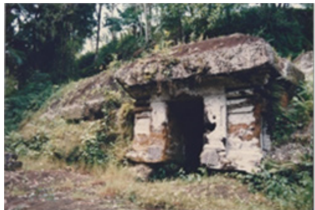
Gambar 12. Gapura (pintu masuk) komplek candi tebing Tegallinggah, Blahbatuh.

Gunung Kawi, Komplek Goa Garbha dan komplek Candi Tegallinggah. Bangunan-bangunan ini memiliki beberapa bentuk atau variasi, serta hampir semuanya memiliki konstruksi atap limasan. Karena merupakan pahatan batu, maka bahannya secara keseluruhan merupakan satu kesatuan batuan tebing, sehingga dapat dikatakan sebagai hasil karya yang luar biasa pada masanya. Melihat bentuk bangunan pintu masuk ini kiranya dapat dipersamakan dengan istilah pemesuan atau pamedalan yang merupakan satu unit pintu rumah atau pintu pekarangan untuk unit bangunan tradisional Bali. Pamesuan atau pamedalan mempunyai pengertian tempat masuk dan keluar, yang bermakna keluar dari tempat yang satu menuju tempat lainnya (Saraswati 2002, 4). Bangunan ini sering pula disebut dengan angkul-angkul adalah sejenis pamesuan dalam bentuk yang sederhana yang merupakan perkembangan dari peletasan yang diberi tambahan atap yang meng- ungkuli/ unkul-ungkul , yang meng- ungkuli orang yang lewat dan akhirnya menjadi angkul-angkul . Istilah pamesuan muncul sesuai dengan fungsinya untuk pintu masuk dan keluar, untuk istilah yang lebih sederhana dari Kori . Untuk tempat-tempat yang disucikan, istilah pamesuan diganti dengan Kori Agung (Arinton 1986, 45) atau disebut dengan gapura atau candi bentar . Dengan demikian keberadaan gapura atau pintu masuk yang ada pada masing-masing komplek