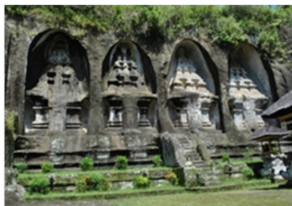
Gambar 2. Pahatan candi padas/candi tebing di kompleks Gunung Kawi, Tampak Siring.

Menurut kamus istilah arkeologi candi adalah semua bangunan peninggalan Hindu dan Buddha di Indonesia, baik itu berupa permandian kuna, bangunan suci keagamaan, semuanya disebut candi (Ayatrohaedi 1978, 35). Pada awalnya ada yang berpendapat bahwa candi adalah makam raja yang telah wafat atau meninggal. Secara konseptual candi yang bangunannya makin ke atas makin kecil dianggap refleksi dari bentuk gunung yang tinggi dan dipercaya sebagai tempat bersemayamnya para Dewa dan roh suci leluhur. Sebagai refleksi bentuk gunung, sehingga candi juga