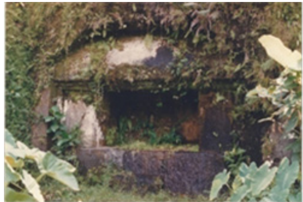
Gambar 10. Bangunan bertiang empat ( sakapat ) dengan satu bilik terbuka dan satu bilik tertutup.

Bangunan bertiang empat ( sakapat ) dengan satu bilik terbuka dan satu bilik tertutup ini, terdapat di sebelah selatan ceruk-ceruk pertapaan di kompleks Gunung Kawi, Tampaksiring. Bangunan ini dipahatkan pada tebing agak tinggi dengan denah segi empat panjang yaitu panjang 350 cm, lebar 150 cm dan tinggi sekitar 150 cm, didirikan di atas dasar atau bebaturan . Pada bebaturan ini berdiri empat tiang yang kokoh, pada sisi kanan terdapat bilik terbuka sepanjang 200 cm dan pada sisi sebelah kiri terdapat bilik tertutup dengan 150 cm, dan memiliki lubang