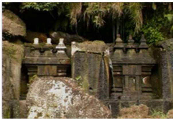
Gambar 3. Candi padas/candi tebing di Komplek Tegallingah, Blahbatuh.

Bangunan sakral/suci yang terdapat di DAS Pakerisan berupa pahatan/relief Candi Tebing atau Candi Padas, yang bentuknya sangat mirip dengan candi yang dipahatkan pada batuan tebing sungai (Kempers 1977, 79), Jumlahnya ada 13 candi tebing atau candi padas, dengan rincian 10 pahatan di Situs Gunung Kawi, satu di Situs Kerobokan dan dua di Situs Tegallingah. Secara umum bentuk dan gaya pahatannya hampir sama dan serupa, hanya saja ukurannya yang berbeda, besaran dan tingginya