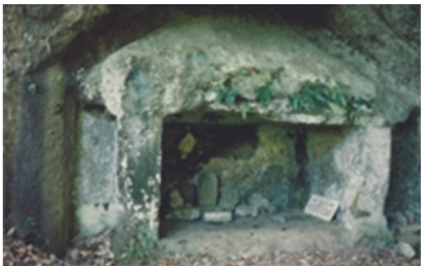
Gambar 9. Bangunan bertiang empat ( sakapat ) dengan bilik terbuka.

Bangunan bertiang empat ( sakapat ) dengan bilik terbuka yang terdapat di DAS Pakerisan terlihat pada beberapa tempat seperti dua bangunan pengapit candi tebing kesepuluh di kompleks Gunung Kawi, dua bangunan pengapit candi tebing Kerobokan, dan dua bangunan di kompleks Goa Garbha. Bangunan bertiang empat ( sakapat ) ini selanjutnya diberi kode sub tipe B.3 a. Bangunan memiliki denah segi empat dengan ukuran panjang sekitar 200 cm, lebar 150 cm dan tinggi sekitar 150 cm. Banyak dari bangunan ini bagian atap depannya sudah mengalami keruntuhan, sehingga garis-garis pelipitnya sudah tidak jelas, tetapi berdasarkan beberapa relief bangunan yang masih dapat diidentifikasi terlihat adanya perbingkaihan. Fungsi bangunan bertiang empat ( sakapat ) ini secara pasti memang belum dapat dijelaskan, tetapi bangunan ini diduga berfungsi sebagai tempat tinggal atau tempat berteduh dan berbagai aktivitas lainnya, pada saat berlangsungnya upacara keagamaan.