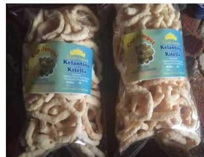
Gambar 1. Kelanting hasil produksi oleh KWT Plamboyan

Bahan yang digunakan adalah kelanting yang diproduksi oleh Industri Kecil Kelompok Wanita Tani Plamboyan (KWT) Plamboyan. Kelanting sebagai snack lokal memiliki rasa gurih bertekstur renyah, berwarna putih kekuningan, dan berbentuk bulat dengan diameter sekitar 5 cm ( Gambar 1 ). Selain itu juga diperlukan kuisisioner untuk memperoleh data primer.