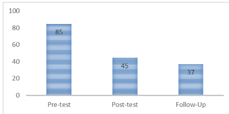
Gambar 3. Perbandingan skor SAS-A Pre-test, Post-test, dan saat Follow-Up

Pada fase pre-test atau sebelum intervensi, subjek mendapatkan skor SAS-A sebesar 85 dan termasuk dalam kategori kecemasan sosial tingkat tinggi. Pada fase post-test atau setelah intervensi, skor SAS-A yang didapatkan subjek adalah sebesar 45 poin. Terjadi penurunan sekitar 40 poin dari skor pre-test , dan terjadi perubahan level kecemasan sosial pada subjek, dimana ketika sebelum intervensi kecemasan sosialnya berada pada level tinggi (diatas 50 poin) dan setelah intervensi kecemasan sosialnya berada di level rendah (dibawah 50 poin). Fase follow-up dilakukan tiga minggu setelah intervensi dilakukan, dan pada fase ini subjek mendapatkan skor SAS-A sebesar 37 poin. Penurunan skor kecemasan sosial ini mengindikasikan keberhasilan pelaksanaan intervensi Modifikasi Kognitif Perilaku untuk menurunkan kecemasan sosial pada anak.