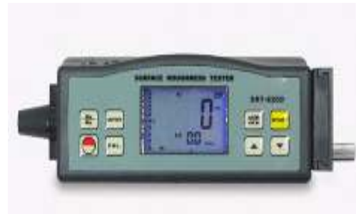
Gambar 2.2 Alat Uji Kekasaran Permukaan

Untuk mendapatkan nilai kekasaran permukaan yang halus dari proses ukiran dapat dilakukan dengan pemilihan mata pahat, penentuan feeding dan kedalaman potong yang sesuai dengan kebutuhan. Ketajaman dan kekuatan dari mata pahat sangat berpengaruh terhadap produk yang dihasilkan. Dalam tugas akhir ini difokuskan pada penggunaan beberapa material pahat dan benda kerja untuk mengetahui pengaruh jenis pahat dan benda kerja terhadap kekasaran permukaan yang dihasilkan dan lamanya waktu pemotongan.