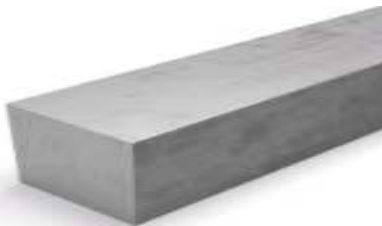
Gambar 2.1 Bahan Alumunium

Bahan Alumunium dipilih dengan bidang balok dengan dimensi 9 x 4 x 3 cm, dengan melakukan 5 kali percobaan. Untuk memudahkan penilaian terhadap tingkat kekasaran permukaan.